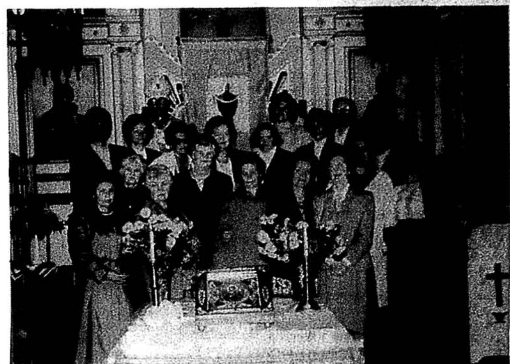
Сестрицтво св. Покрови при українській православній церкві Св. Троїці в Ірвінгтоні, Н. Дж., під час Молебня до Пречистої Діви Марії