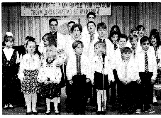
Діти виступають в мистецькій програмі

Богоматері «Блаженній в жанах», уривок з поеми «Неофіт».