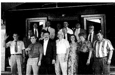
Група українських банкірів, які прибули до ЗСА

Нью Йорк (Ю. П.). — Група президентів українських банків, 14 осіб, перебуває на тридцятихвилинних відвідинх ЗСА з метою ознайомитися з фінансовими установами в Нью Йорку, Чикаго і Вашингтоні.