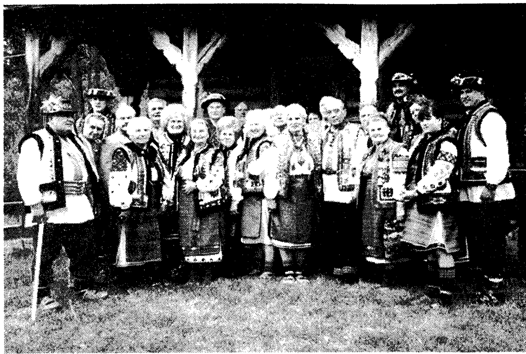
Група гуцулів під час з'їзду