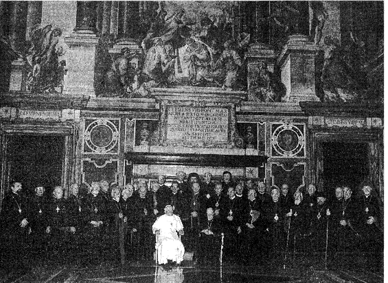
Учасники Синоду в Римі з Папою Іваном Павлом II і Кардиналом Мирославом Любачинським (посередні).

повідні записки. Владика Михайл під кінець своїх гостей у нас пошує це йому дуже близьку проблему постуляції Митрополита Андрея Шептицького, спонсором якої він саме є, та збірника творів Митрополита п. з. Церква і церквона єдність" (Документи і матеріали 1899-1944 років, том І-й). Один із перших примірників цієї книжки, яку ми маємо нагоду лише на хвилину взяти у руки, Владика Михайл перепав Папі Іванові Павлові II в часі Синоду у Римі. Тут Владика Михайл розповідає із ентузіазмом про величезну бібліотеку-архів Митрополита у Львові, в якій він при кожній нагоді працює, а яка є відповідно упорядкована науковими силами Львова. І тут ми торкаємося так важливу і болючу для нас українців-католиків справу беатифікаційного процесу щодо Митрополита Андрея, бо він вимагає доволі довго. Владика Михайл, якого Папа Іван Павло II поклав на голову Комітету мученичів, висновок нам, що треба нам усім вірним бути більше активними у подаванні фактів про можливих мучеників Української Греко-Католицької Церкви та її ісповідників.