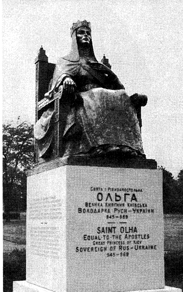
Пам'ятник св. Ользі в Бавнд Бруку