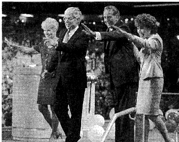
П. Дол і Дж. Кемп з друзями на конвенційному підвигі

Сан Дієго. — У четвер, 15-го серпня, на вечірній кінемой сесії Республі-канської конвенції Роберт Дол, кандидат на прези-дента ЗСА у цьогорічній виборів, і його політич-ний партнер кандидат на віцепрезидента Джек Кемп офіційно у своїх