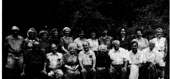
H... .. G... ..