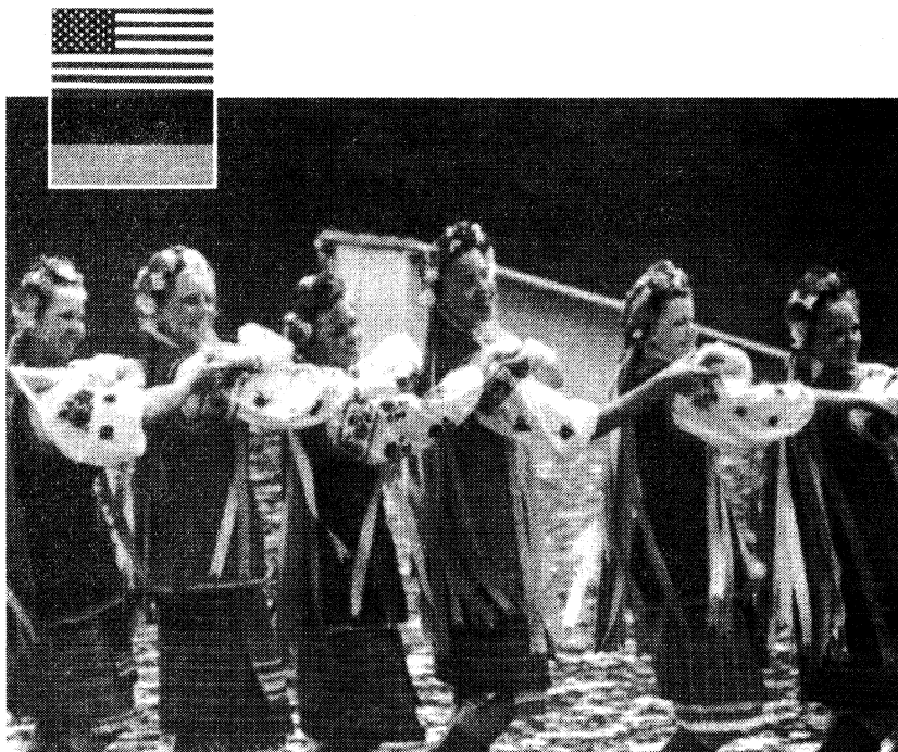
Paid for by the Democratic National Committee

It's not just because the Administration and Democratic leaders are working hard to secure an independent and prosperous Ukraine.