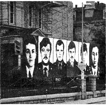
Шість портретів засмислених пожежників.

Від 5-го жовтня до 17-го листопада відбувається в Оттаві унікальна виставка мистця Степана Геца з Англії. Він — українське другого покоління, вже кілька років описує чорнобильську трагедію, представляючи її в різних аспектах. В Оттаві цією виставкою займається галерея САВ у співпраці з оттавськими пожежниками. Відкрита виставка було в суботу, 5-го жовтня, в 1-й годі по полудні. На подвір'ї галерії напроти Рідо центру поставлено високо на рушуваний ря-