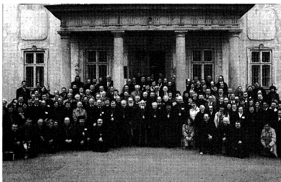
Делегати на Патріаршому соборі УГКЦ перед Патріаршою Палатою

раїні і на поселеннях, що найкраще вказувало на єдність нашої Церкви. Здається, що на соборі домінував дух Слуги Божого Митрополита Андрія і Патріарха Іоанна та дух Другого Ватиканського Собору.