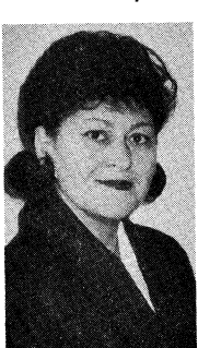
Л. Бичкова.

Згідно з вислідами останньої лікарської перевірки, функціонування серця російського президента Бориса Єльцина значно поліпшилося після проведеного ним минулого місяця операції, а його нездоровлення проходить без будь-яких ускладнень, як про це повідомляють американські лікар-діагетики. «Він видужує чудово», підкреслив д-р Майкл Дібік з медичної школи університету Бейлор у Гюстоні.