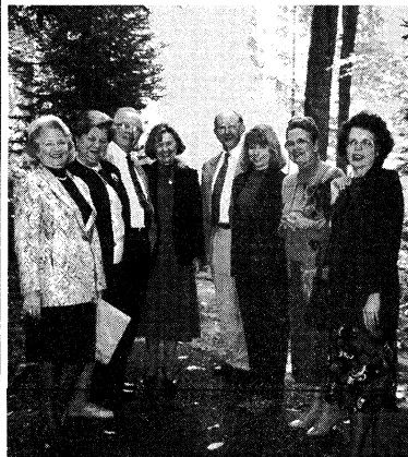
Під час прогулянки...