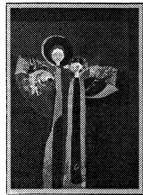
Guardian Angels — 1994 by Christina Sai, Bloomfield, NJ

Цей пакет риздвяних карток надається також на подарунок для Ваших приятелів.