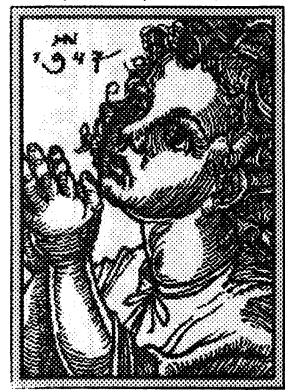
Praying Child — 1947 by Jacques Hnzidovsky, New York, NY