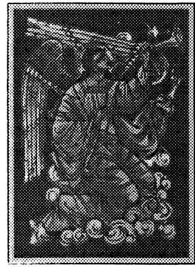
Angel — contemporary by George Kozak, Detroit, MI

Український Народний Союз видав нові Риздвяні карточки на 1997–1998 р. Темою яких є ангели. Пакет начисляє з дванадцятьох карток, шість карток зі святочними побажаннями, а шість чистих, які можна використати на різні нагоди.