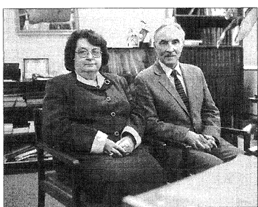
Голова США А. Кравчук і голова Управи Українського Музею в Нью Йорку проф. І. Лучечко в редакції „Свободи”.

— Я сказала б так: ідеї зароджувалися від відчуття потреби. Чого бракує нам, українцям діаспори