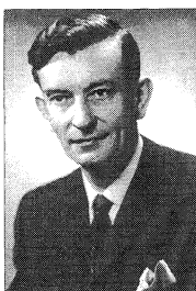
Св. п. Іван Вахнянин

теї, підручників, поезій, повістей. Він написав чимало хороших пісень та оперу "Купало", яку було поставлено навіть у Нью-Йорку, заводи УНСО-зона.