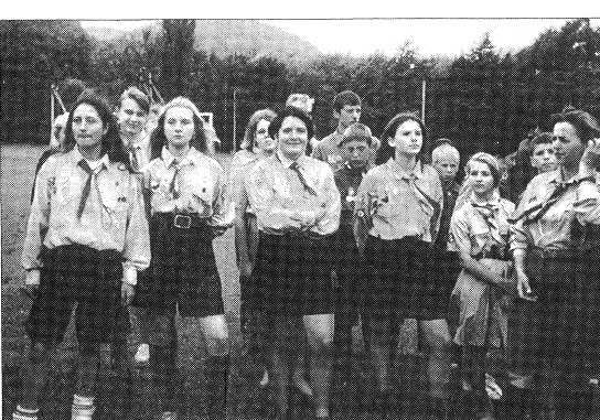
Курні Ім. О. Теліу на джемборі в селі Невішкому у Карпатах.