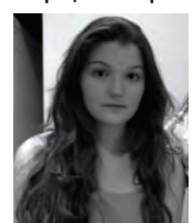
Неоніла Марія Коссак