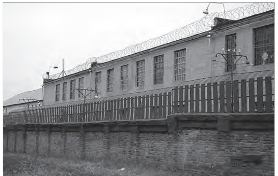
Качанівська жіноча виправно-виховна колонія ч. 54 у Харкові.

4 січня 30 активістів партії „Батьківщина“, які зібралися перед входом до колонії, встановили два намети, у яких збиратимуть звернення і листи від прихильників Ю. Тимошенко, а також роздаватимуть харків'янам агітаційні матеріали. (Бі-Бі-Сі, „Українська правда“, УНІАН)