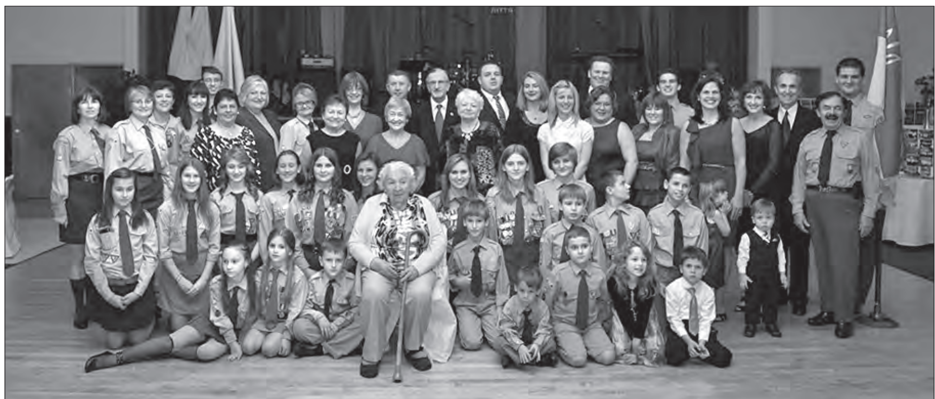
Учасники свята на честь 60-річчя Осередку Спілки Української Молоді Америки в Джерзі-Сіті, Нью-Джерзі.