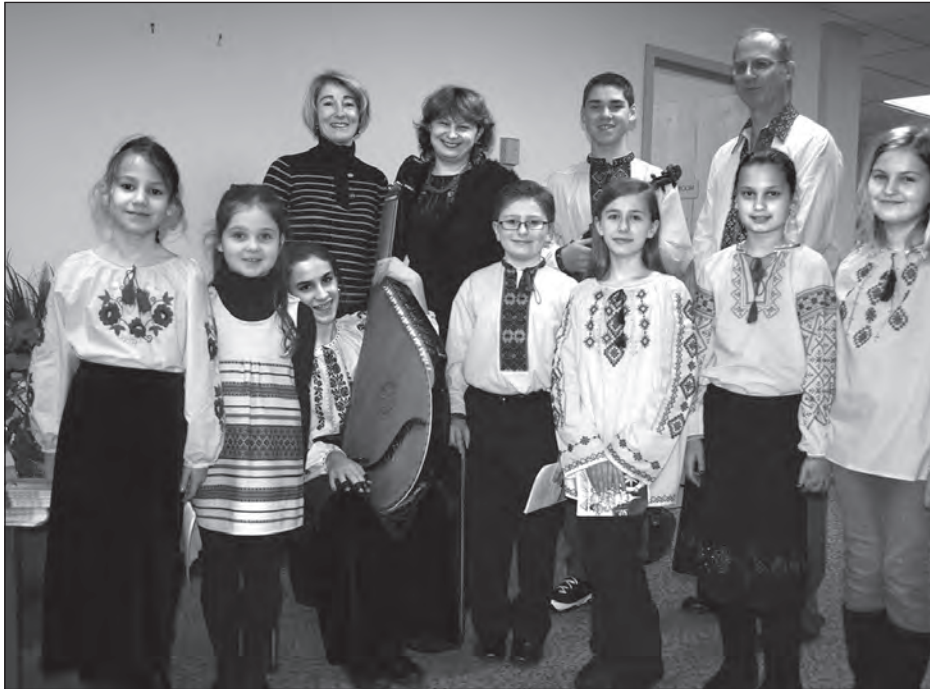
Гості з Школи у Випані, Нью-Джерзі, Українського Музичного Інституту в Головній канцелярії Українського Народного Союзу.

Гостям було вручено грошовий даток УНСоюзу на потреби школи.