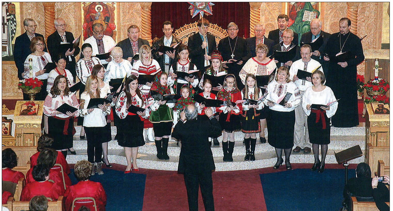
Виступає хор собору св. Володимира.

Собор св. Володимира має два хори – англійський та український, що співають дві Літургії кожної неділі.