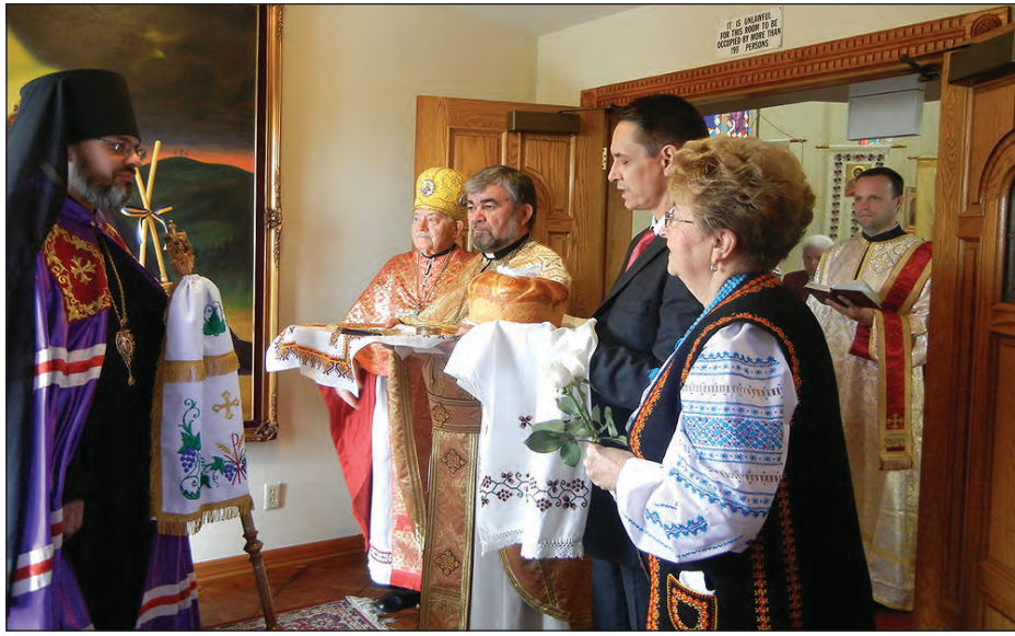
Зустріч Владика Даниїла в парафії св. Апостола Андрія Первозваного.