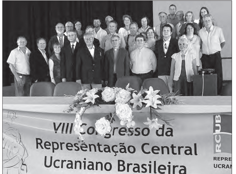
Євген Чолій (четвертий зліва) серед учасників VIII Конгресу Українсько-Бразилійської Центральної Репрезентації.

КУРИТИБА, Бразилія. – 25-27 листопада 2011 року з метою участі в VIII Конгресі Українсько-Бразилійської Центральної Репрезентації (УБЦР) президент Світового Конгресу Українців (СКУ) Євген Чолій здружиною Анною здійснив подорож до Куритиби.