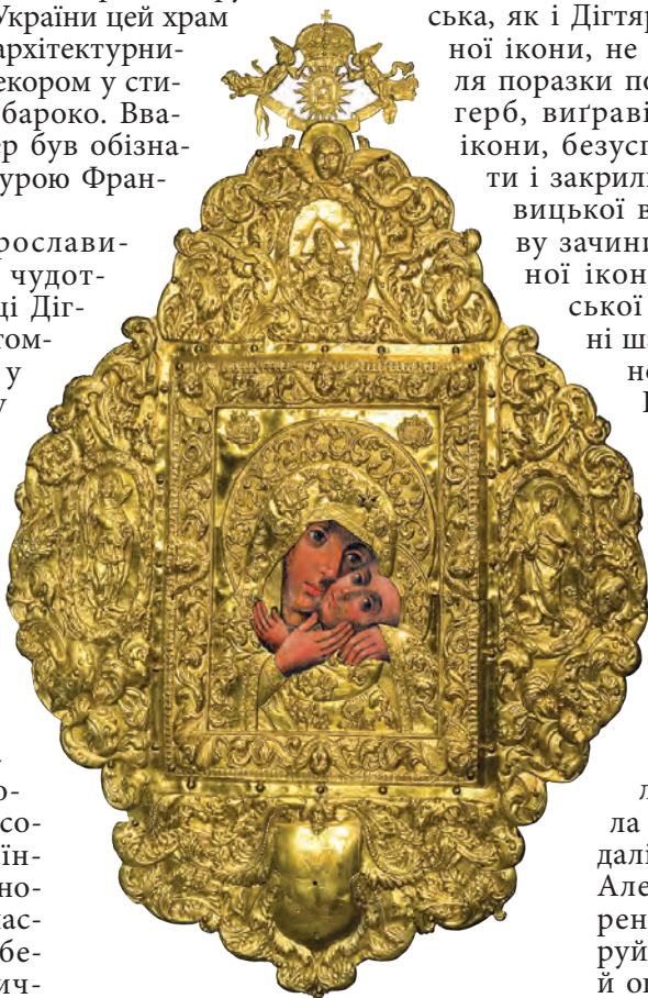
Копія Чудотворної ікони Богородиці Дігтярівської 1794 року. Фото: Микола Турчинов (2011), Національний заповідник „Чернігів стародавній“. Позолочені срібні шати ікони фундавані Іваном Мазепою, Музей історичних коштовностей України. Комп'ютерна реконструкція ікони з шатами: Василь Сидоренко (2012).