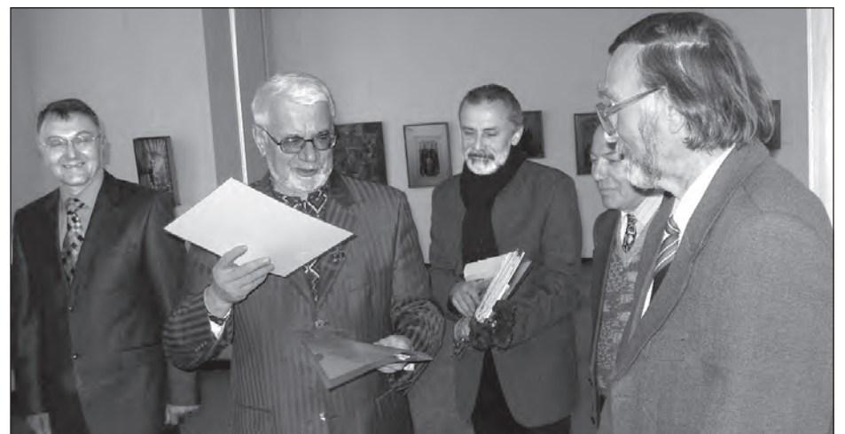
Під час урочистого вручення Всеукраїнської премії ім. Братів Богдана і Левка Лепких.

го. Спонсором видання стала Бережанська філія Кредитної спілки „Вигода“.