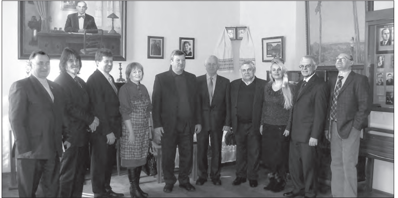
Активісти Міжнародного громадського об'єднання „Рівненське земляцтво“ у Літературному музеї Уласа Самчука в Рівному.

З'явилася книга у видавництві „Азалія“ Рівненської організації Національної Спілки письменників України, у „Бібліотечці Літературного музею У. Самчука в Рівному“, завдяки матеріальній допомозі розпорядників спадщини Уласа