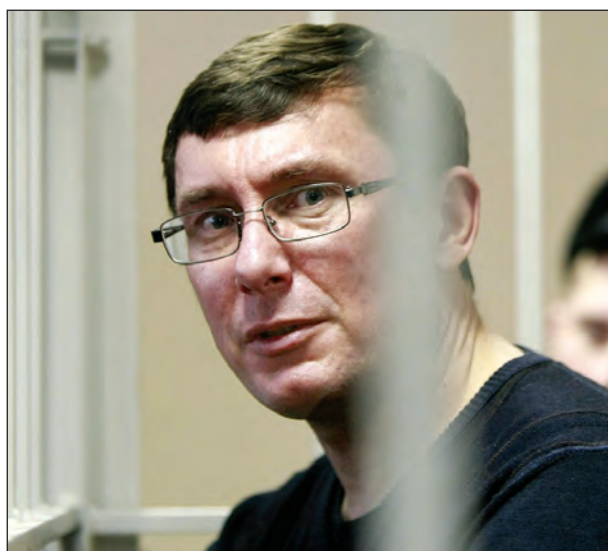
Юрій Луценко.

Деякий час відеотрансляцію цього судового засідання вів, з затримкою і перервами, телеві-