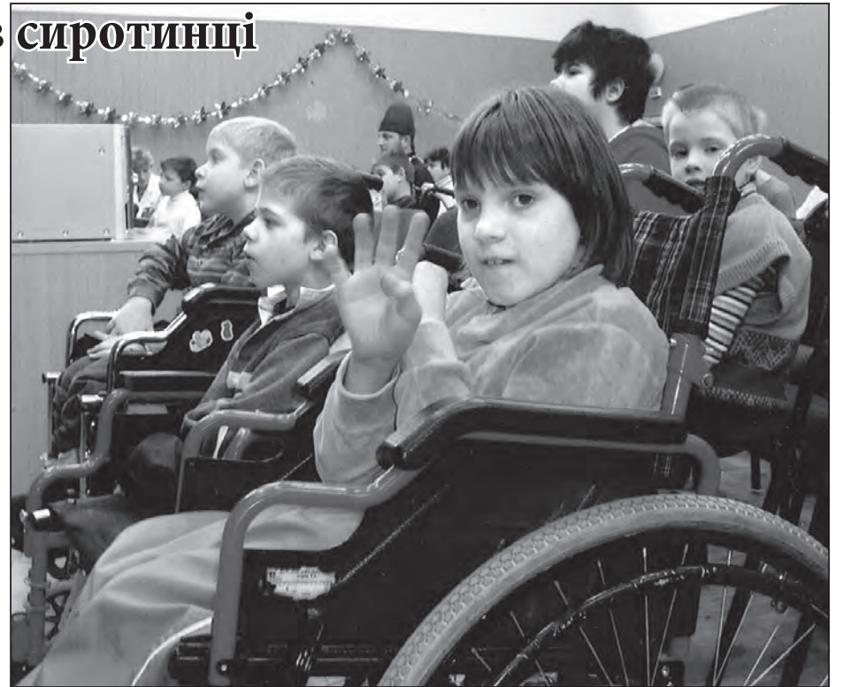
Під час свята в Дніпропетровському обласному дитячому будинку для дітей з фізичними вадами.

Фідель Сухоніс – редактор журналу „Бористен“, письменник.