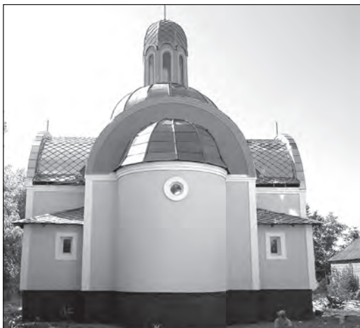
Українська греко-католицька церква Архистратига Михаїла в селі Березове на Донеччині.