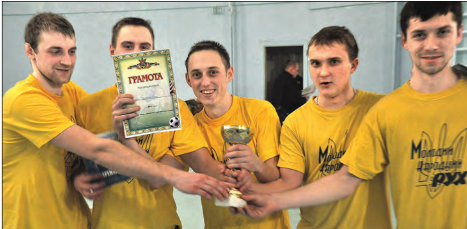
Переможці турніру „Молодий Народний Рух“ з нагородами.