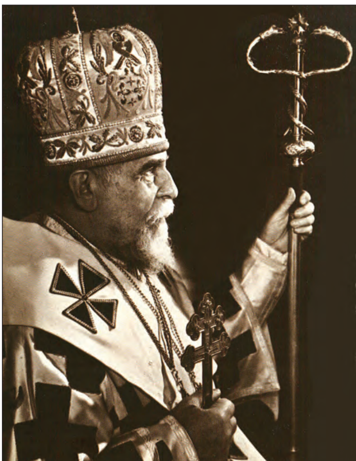
Патріарх Української Греко-Католицької Церкви Іосиф Сліпий (1892-1984).