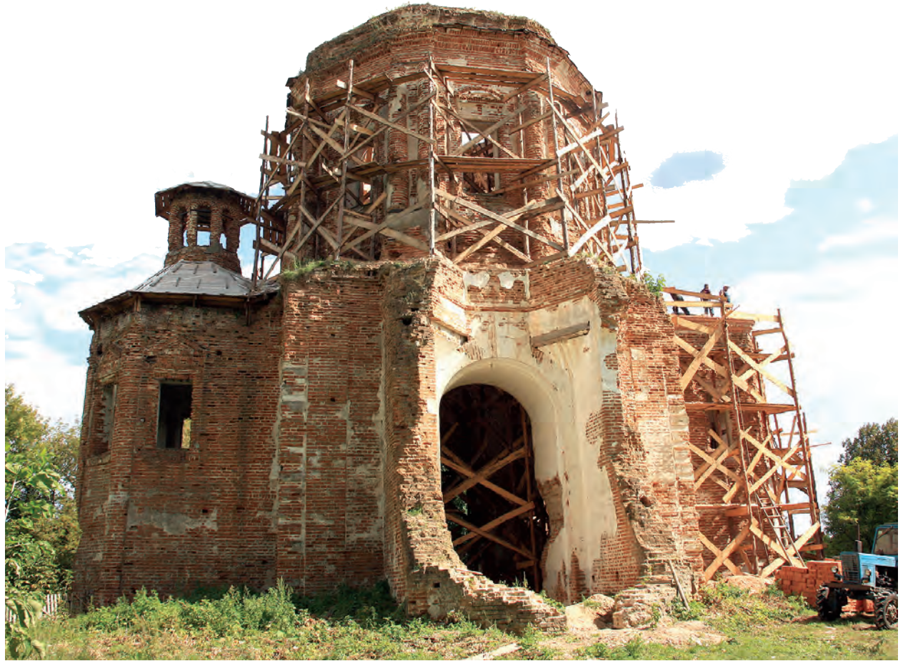
Постає з руїни історичний храм св. Покрови Української Православної Церкви Київського патріархату в селі Дігтярівці Новгород-Сіверського району Чернігівської області.

Дігтярівка пов'язані з важливими історичними подіями Мазепаїного повстання за незалежність козацької держави. У жовтні 1708 року поблизу того козацького села на березі Десни стала табором шведська армія. Там І. Мазепа зі своїми козаками приєднався до короля Карла XII і уклав українсько-шведський військовий і політичний альянс з метою звільнити центральну Україну від підлегlosti Москві. За місцевим переказом, у Покровській церкві перед образом Матері Божої Дігтярівської гетьман присягнув на вірність королеві. 2008 року поблизу села місцеві власті встановили гранітний пам'ятник І. Мазепі та Карлові XII на вшанування 300-ліття їхнього історичного союзу.