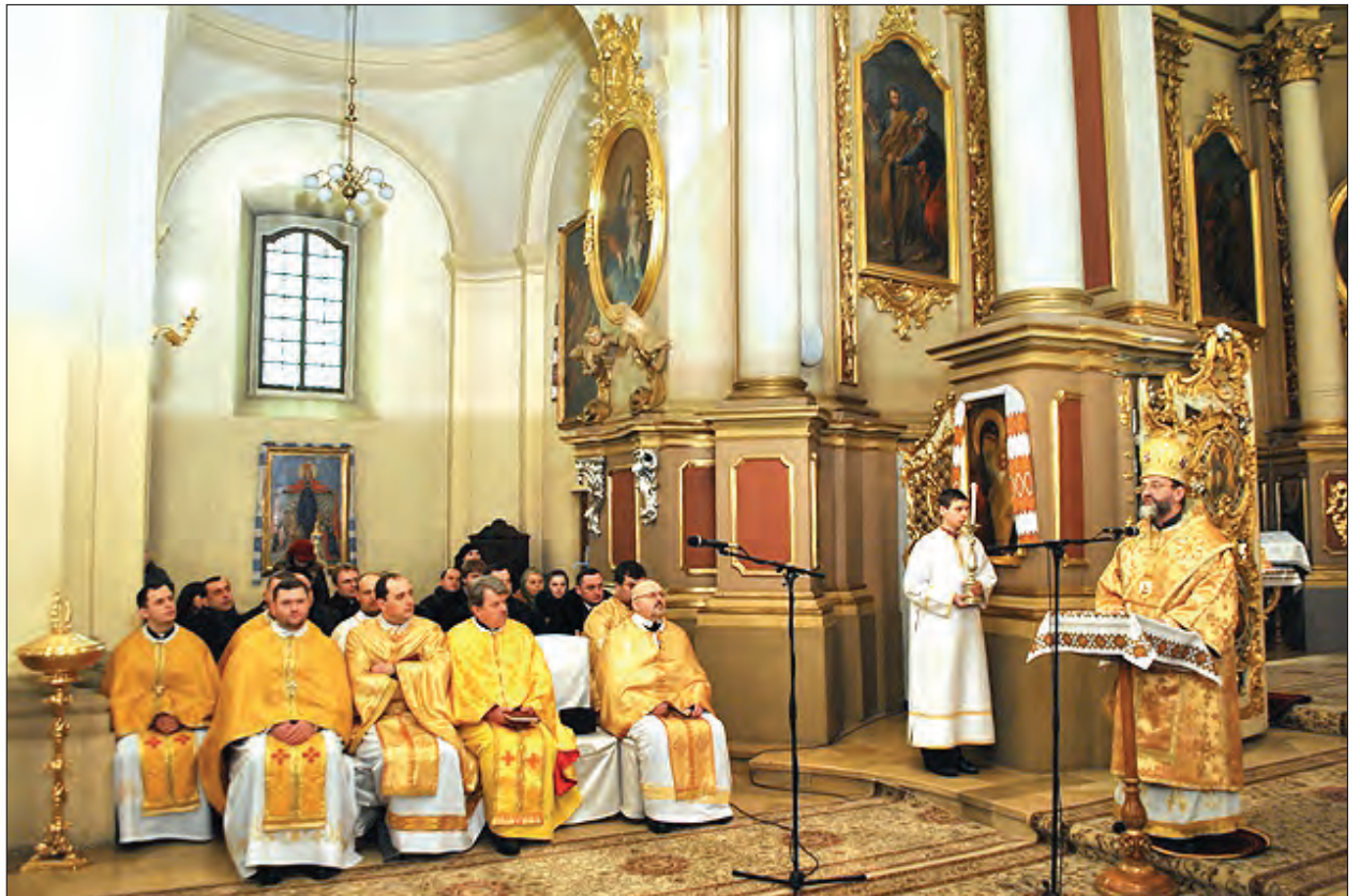
Під час проповіді Архиепископа-Митрополита Української Греко-Католицької Церкви Ігоря Возняка у Львівському соборі св. Юра.

О. Турій також повідомив, що наближається до успішного кінця підготування до друку