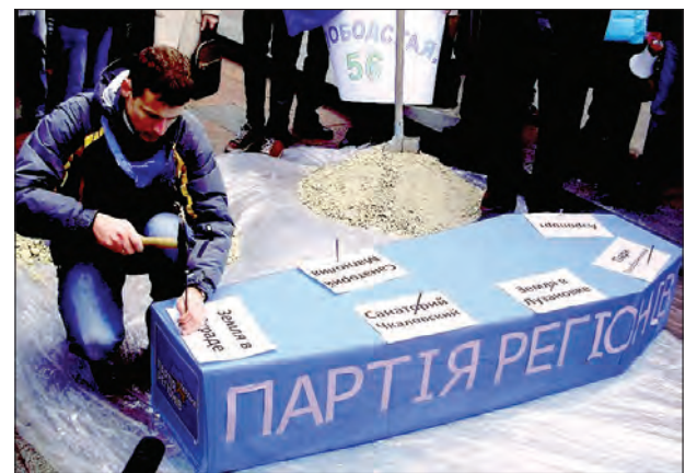
Цвяхи у домовину Партії регіонів.