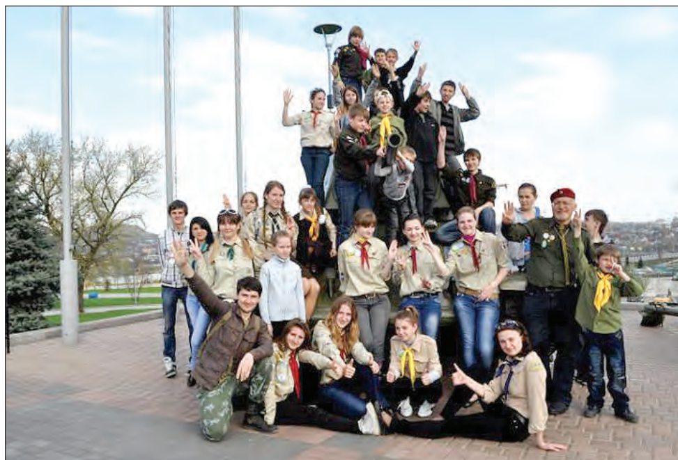
Учасники святкування 100-річчя Пласту в Донецьку.

На закінчення пластуни відвідали виставку старовинних ікон у мистецькому центрі „Арт-Донбас“. Для організації святкування пластуни виграли грант обласного управління у справах сім'ї та молоді.