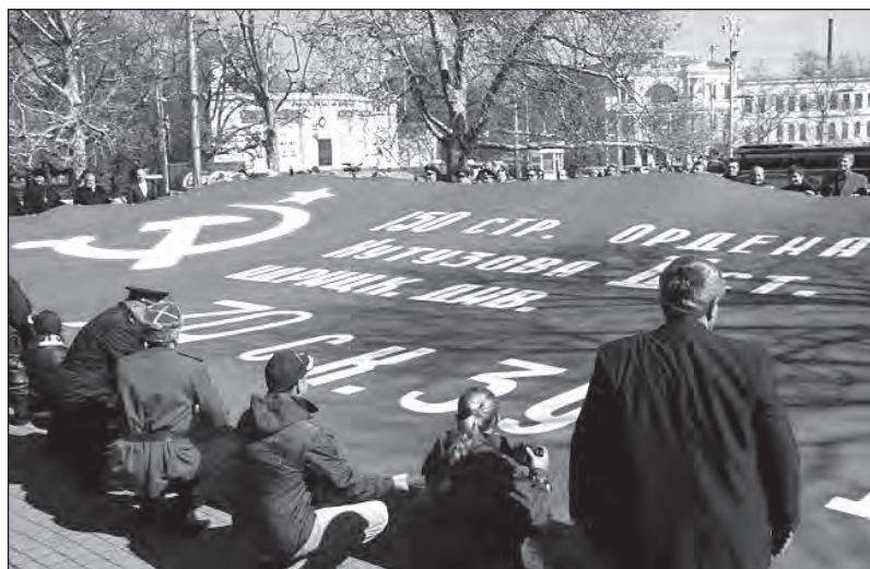
Копія червоного „прапора перемоги“ у Севастополі на старті автопробігу.