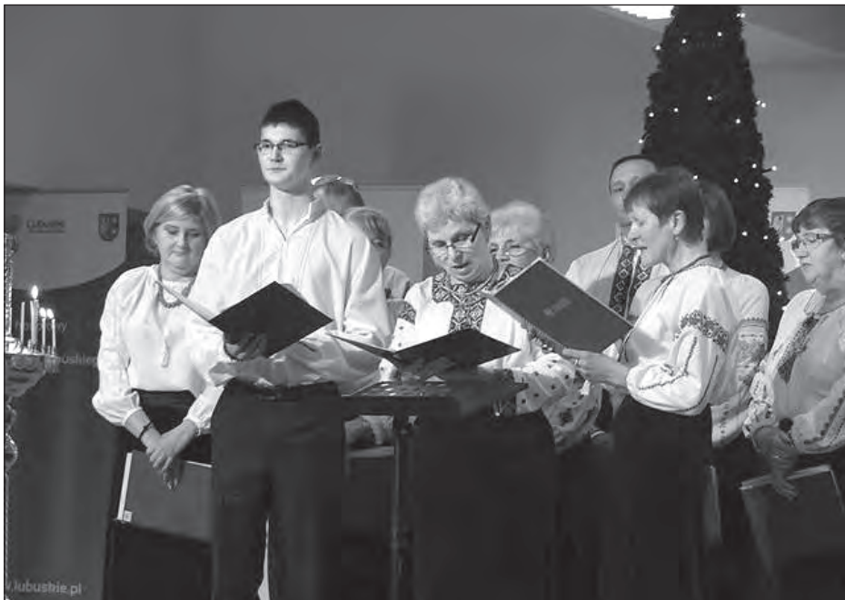
Виступає мішаний хор „Калина“ з Зеленої Гури.