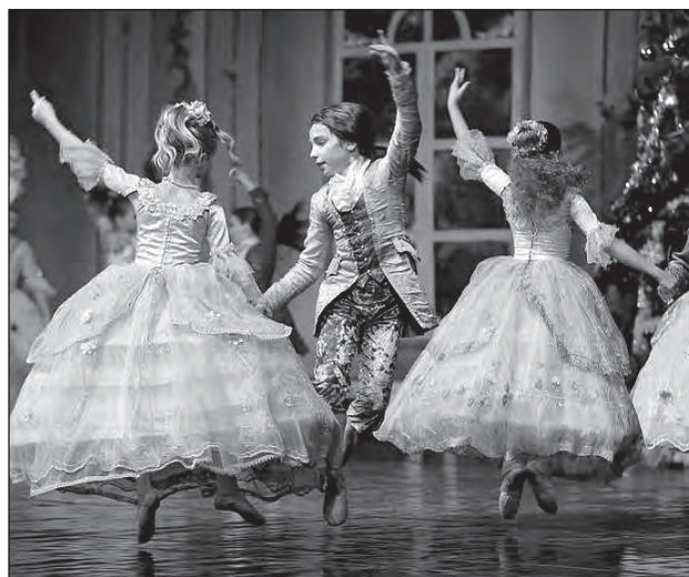
Сцена з вистави Донецької школи хореографічного мистецтва.

Право відкрити фестиваль було надане Імператорській школі російського балету з Санкт-Петербурга, створеній у 1991 році лавреатом міжнародних конкурсів Олександром Антонелі.