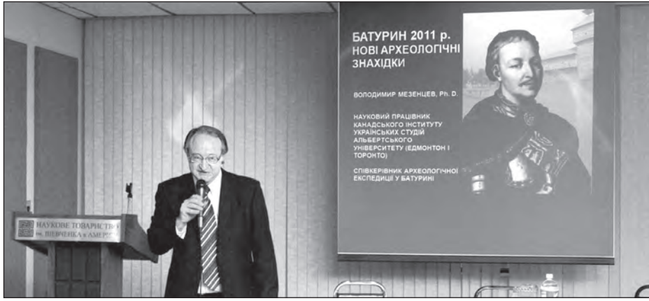
Проф. Володимир Мезенцев під час доповіді в НТШ в Нью-Йорку.

НЮ-ЙОРК. – 11 лютого в лекційній залі Наукового Товариства ім. Шевченка відбулася доповідь відомого українського археолога, професора Понтифікального Інституту середньовічних студій Торонтського університету (Канада) Володимира Мезенцева на тему „Батури-2011: нові археологічні знахідки“.