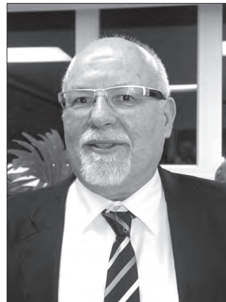
Проф. Франко Сисин.

Надзвичайно цінував він усну та матеріальну культуру селян: зби-