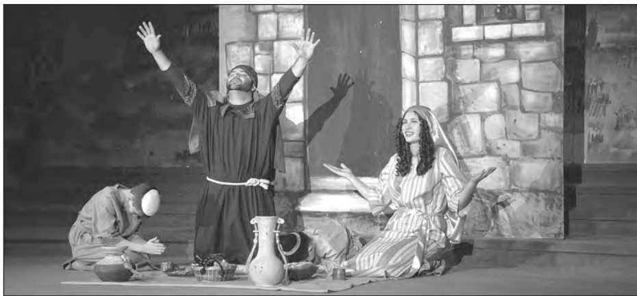
Сцена з вистави: ізраїльтяни святкують Пасху.

Коли драму показували, зала була повна. Всі 150 хвилин виступу пройшли, як кажуть, на одному диханні і для акторів, і для глядачів. Тепер вашінгтонці готуються до виступів у Канаді.