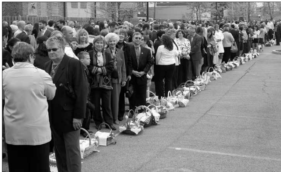
Віряни чекають на посвячення великодніх кошиків.