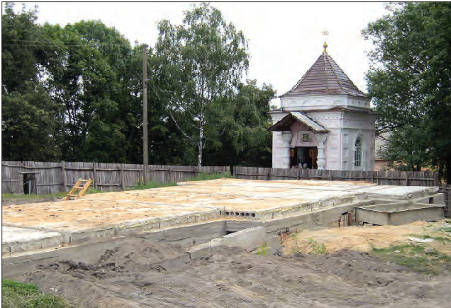
Каплиця в Острозі.