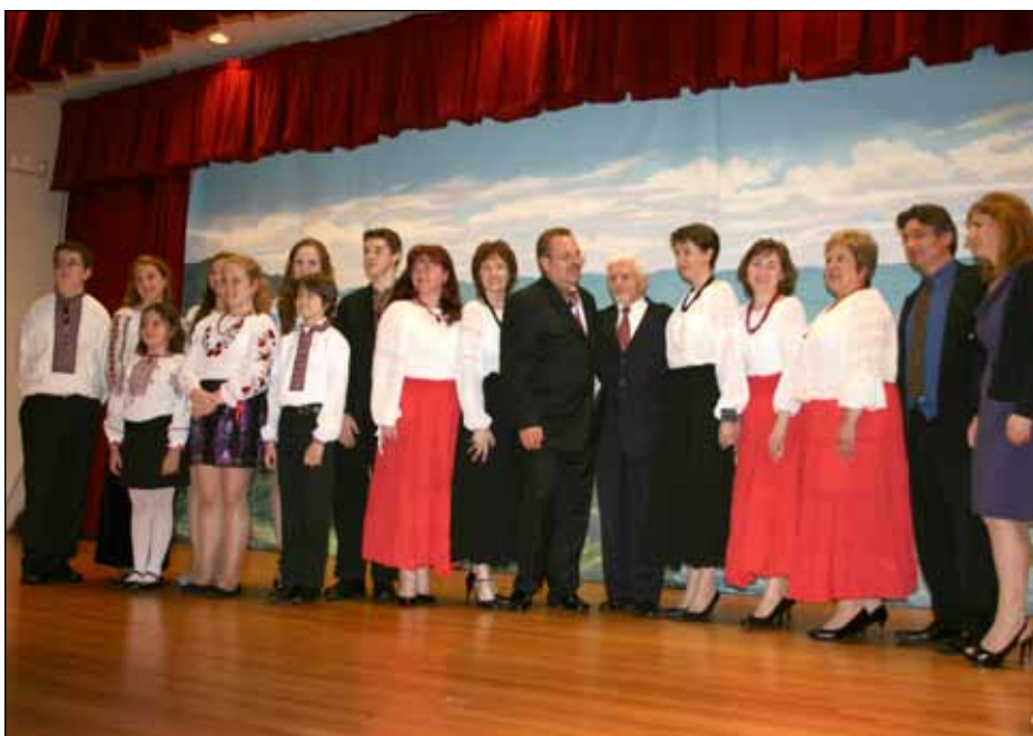
Учасники відзначення в Українському Американському культурному центрі Нью-Джерсі 65-річчя Акції „Вісла“.