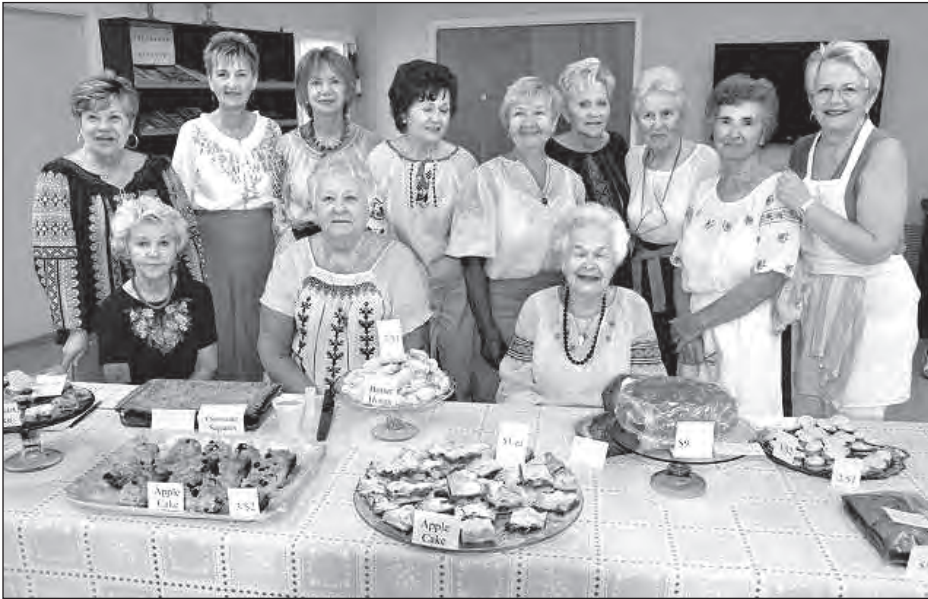
Організатори Великоднього базару в Норт-Порті, Флориди.