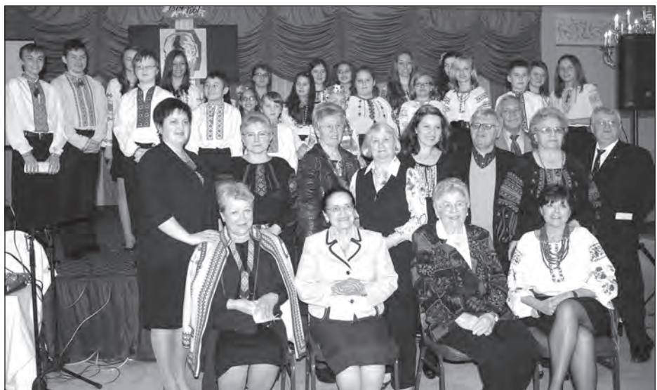
Члени Громадського комітету та учасники шевченківського свята у Ворені.