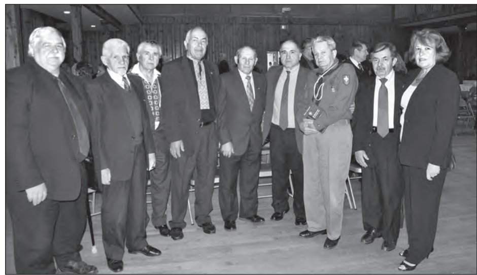
Учасники відзначення в Пасейку, Нью-Джерзі, 65-річчя трагічної Акції „Вісла“.