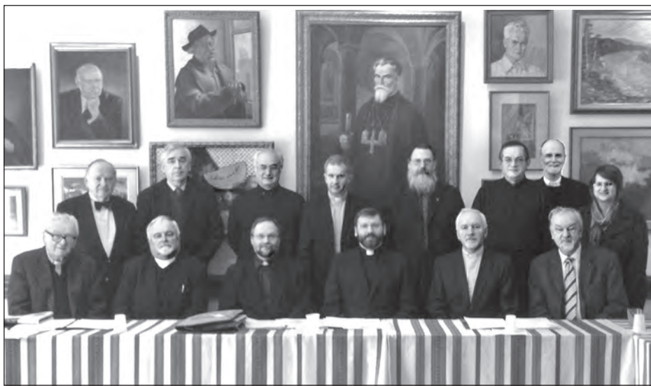
Учасники зборів Товариства „Свята Софія“ в Римі.