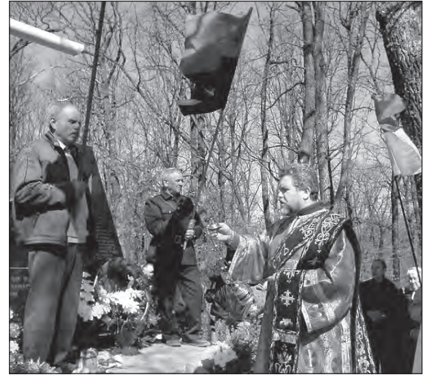
Вшанування пам'яті вояків Української Повстанської Армії в селі Гурби.

До могили вояків були покладені квіти від вдячних патріотів України. Потім відбулося відтворення бою далекого квітневого дня 1944 року.