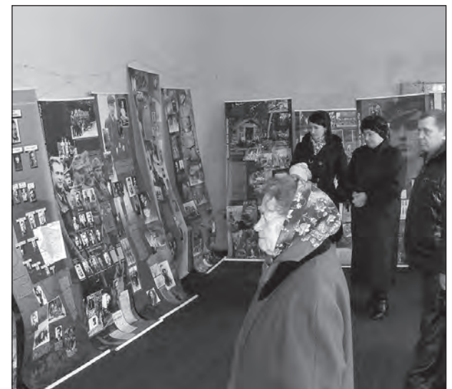
На виставці „Правда про УПА“ у селі Лісники, Тернопільська область.