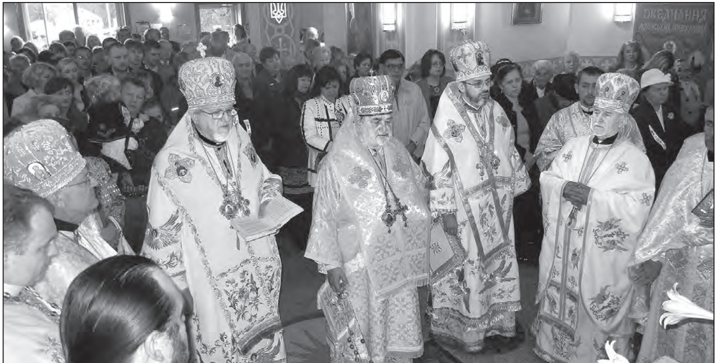
Митрополит Константин, Архієпископ Антоній та Єпископ Даниїл під час Літургії в церкві-пам'ятнику св. Андрія Первозваного.

Константин та Єпископ Даниїл проповідували українською та англійською мовами, закликаючи духовну паству до миру та любови.