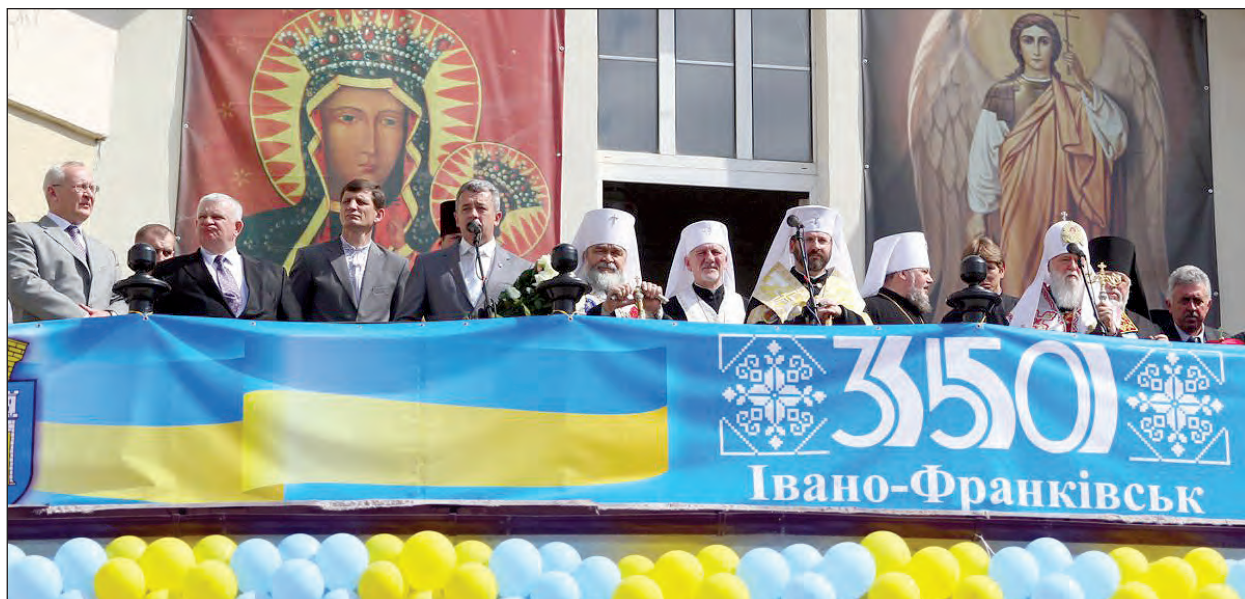
5 травня відбулося святкування 350-річчя Івано-Франківська, котре розпочалося з покладання квітів до пам'ятника Іванові Франкові. Потім колона делегацій з різних областей України та інших країн, керівників області та міста під звуки духової оркестри пройшла центральними вулицями до міської Ратуші, де відбулося урочисте відкриття свята і відслужено Молебень.