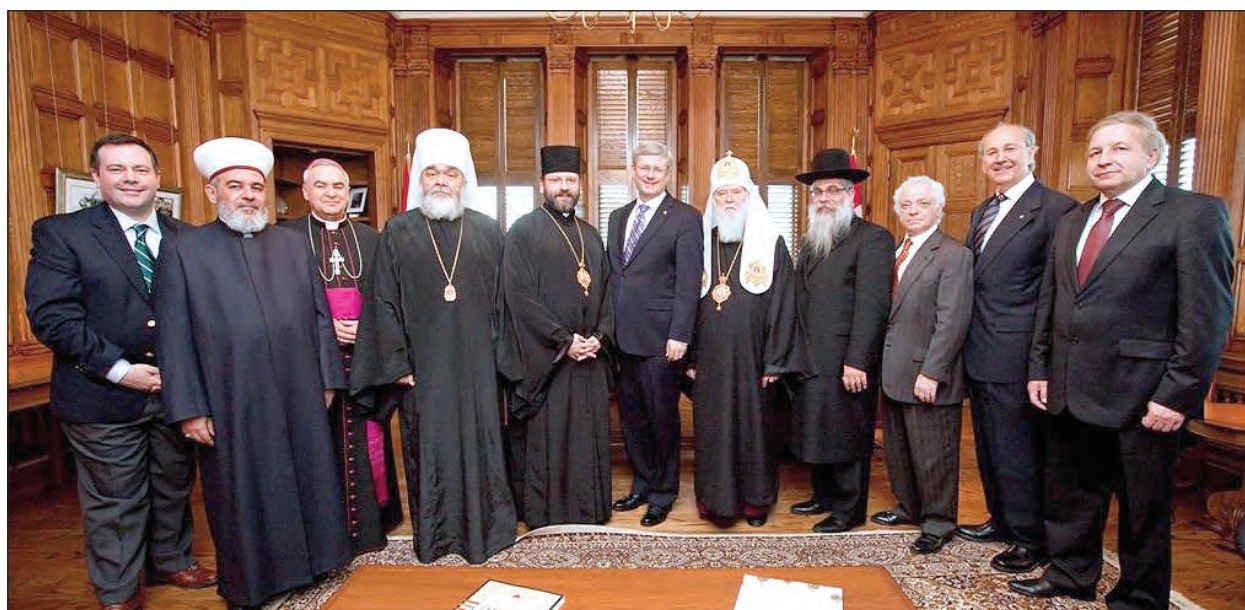
Члени делегації від Ради Церков та релігійних організацій України з Прем'єр-міністром Канади Стівенном Гарпером (в центрі).

ОТАВА. – У зв'язку з тим, що 24 квітня Парламент Канади одностайно схвалив пропозицію щодо вшанування Митрополита Андрея Шептицького, Конгрес Українців Канади у своїй заяві з цього приводу висловив глибоку вдячність законодавцям країни.