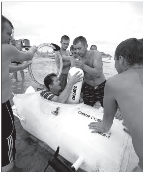
Субмарина „Чикур-1“ вирушає у підводний світ.

Човен важить 420 кілограмів, може безперервно пливти під водою упродовж двох годин. Якщо