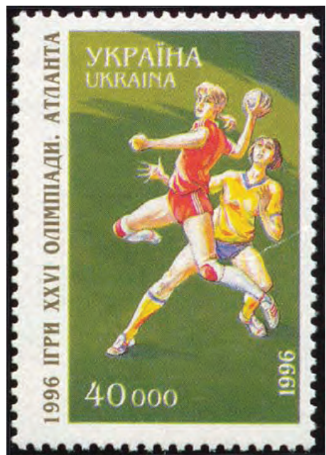
1996 рік. Марка з нагоди Олімпіади в Атланті.