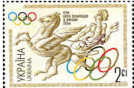
2004 рік. Марка на честь Олімпіади в Атенях.