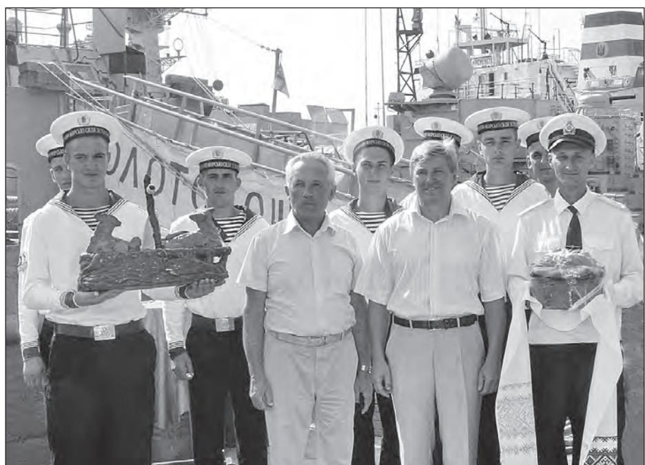
Гості з Золотоноші зустрілися з моряками військового корабля „Золотоноша“.

Особливо сердечними були зустрічі гостей з Черкащини з моряками мінного тральщика „Черкаси“ та військових кораблів „Золотоноша“, „Сміла“, „Чигирин“, з якими черкасців пов'язують давні дружні взаємини. Черкасці вручили подарунки командам.