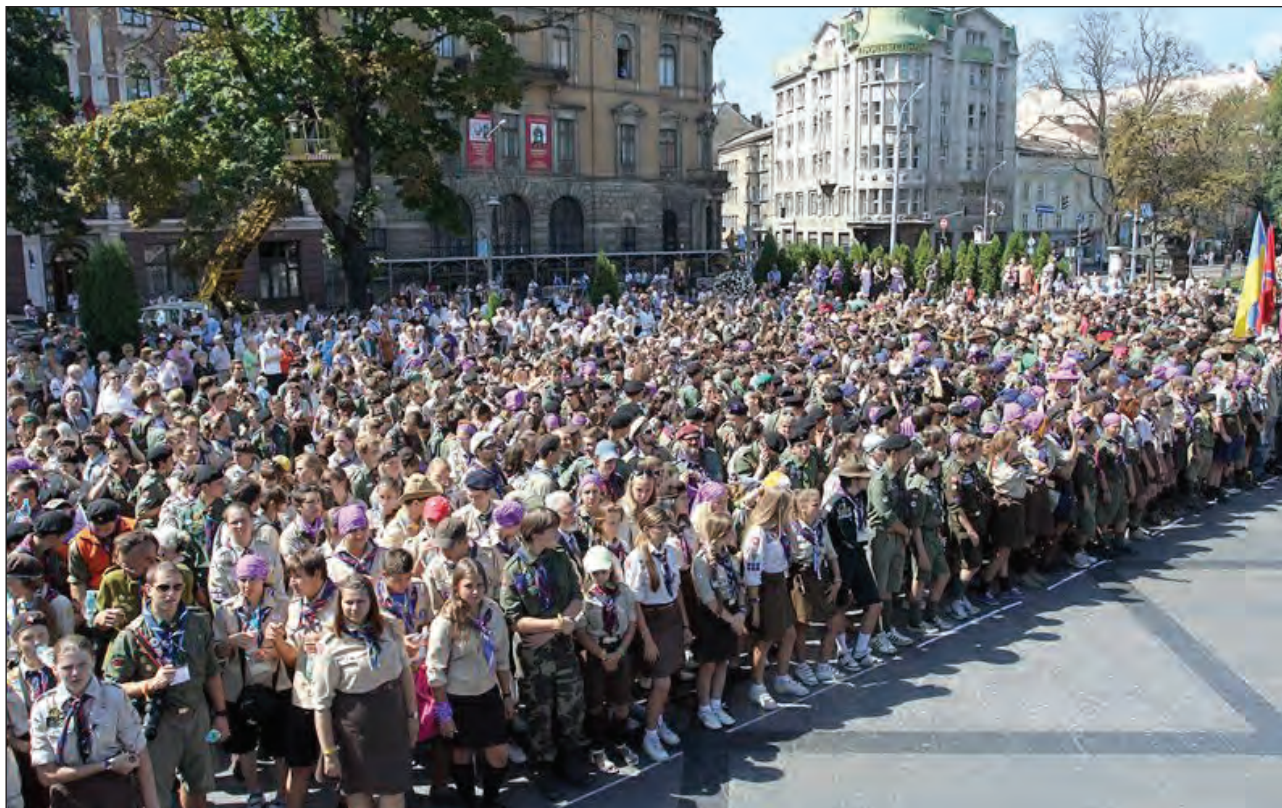
Урочисте відкриття Ювілейної Міжкрайової Пластової Зустрічі у Львові, 19 серпня.