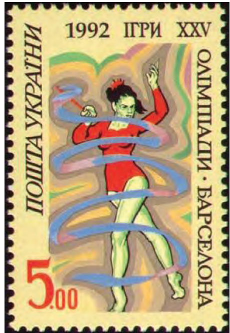
1992 рік. Марки на честь Олімпіади в Барселоні.