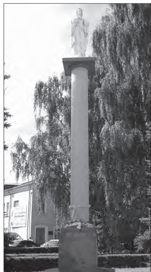
Колона Божої Матері на вулиці 16 липня в Рівному.

Візитівкою вулиці є велична колона Божої Матері, встановлена на місці колишньої колони, яку в 1952 році знищила радянська влада. На виставці представлені фотографії з минулих століть і сучасні цікавинки, а також твори рівненських художників.