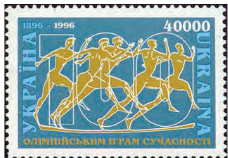
1996 рік. Марка до 100-річчя Олімпійських ігор.