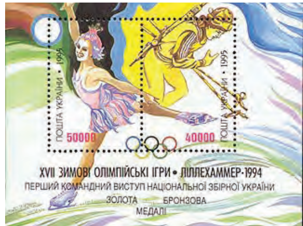
1994 рік. Блок до Зимової Олімпіади в Лілегамері.