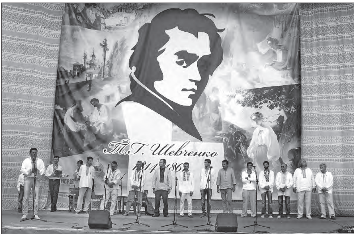
Підведення підсумків фестивалю кам'яних скульптур „Живий камінь“ в Черкасах.