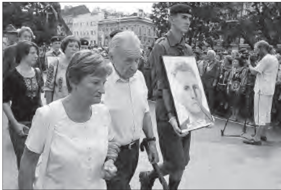
Герой України Юрій-Богдан Шухевич на святкуванні у Львові 100-ліття Пласту.

Роман Шухевич – 1-ий курінь ім. Петра Сагайдачного, 7-ий курінь ім. князя Лева, 1-ий курінь старшопластунів ім. Федіра Черника, 3-ий курінь старшопластунів „Лісові чорти“, 10-ий курінь старшопластунів „Чорноморці“.