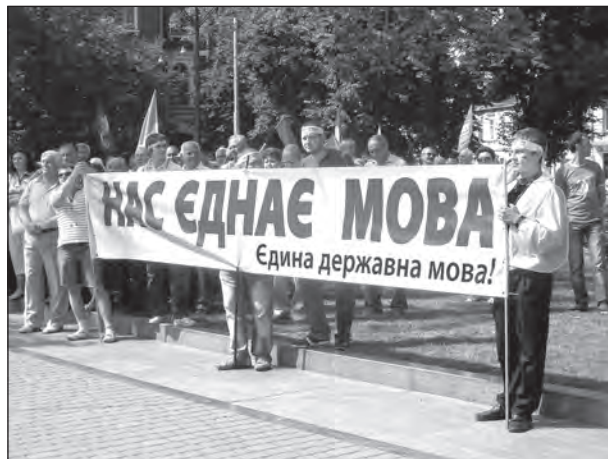
Гасло віча „Єдина державна мова“.