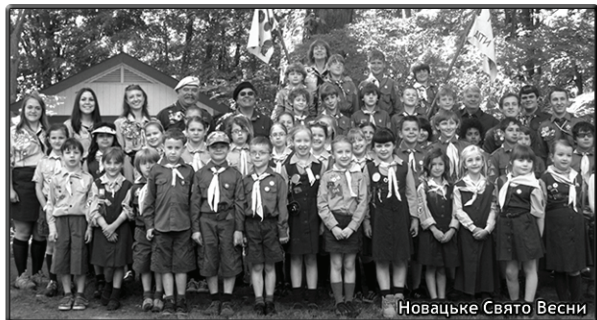
Новацьке Свято Весни

Пластова програма включає що-тижневі сходи в пластовій домівці, прогульки та літні табори в природі.