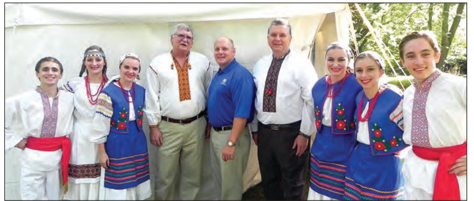
Учасники святкового концерту на оселі ім. Олега Ольжича в Лігайтоні.