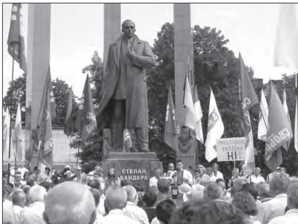
Віче біля пам'ятника Степанові Бандері.

До громади звернулися Єпископ-помічник Львівський Української Греко-Католицької Церкви Венедикт (Алексійчук) та Митрополит Львівський Української Автокефальної Православної Церкви Макарій (Малетич).