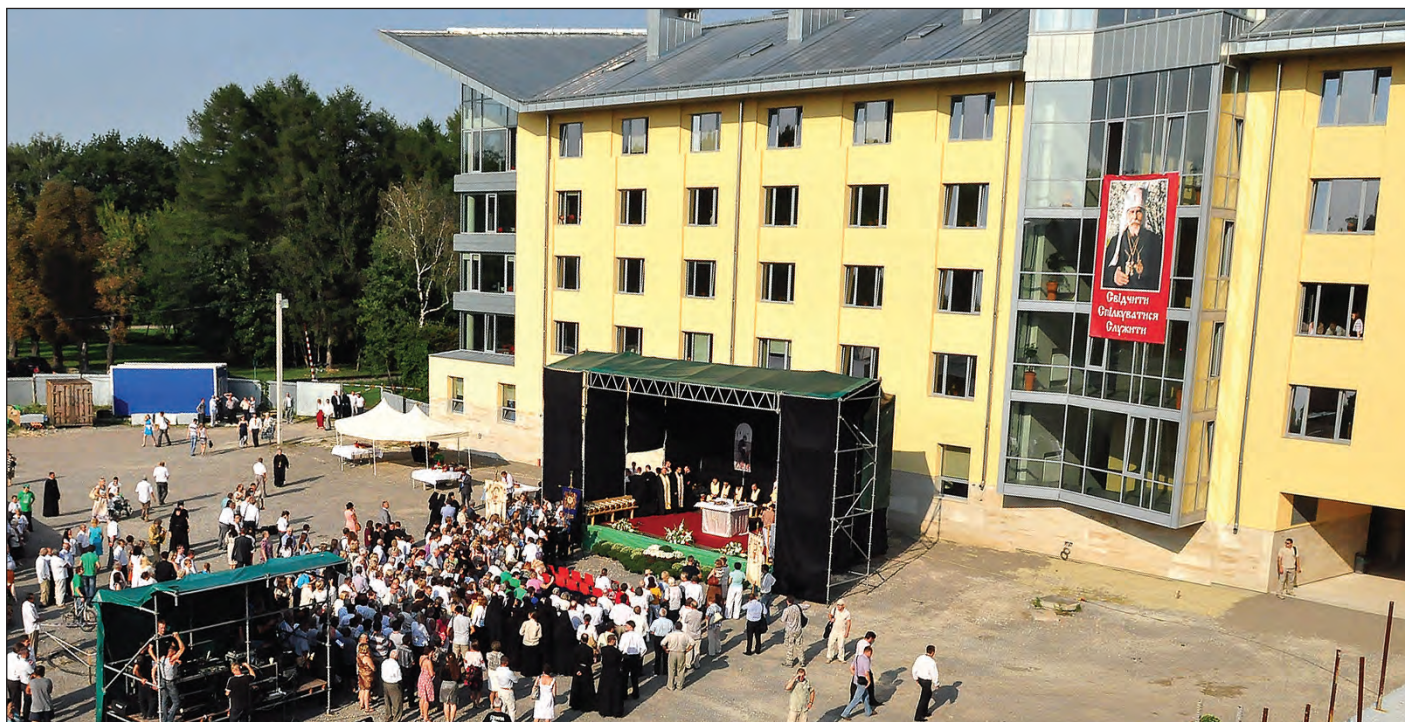
На території Колегіуму УКУ в радісний день його освячення, 26 серпня.

Також новозбудований Колегіум УКУ матиме мешкання для осіб з особливими потребами. Такого, за словами ректора, не було в жодному університеті. „Люди, які мають