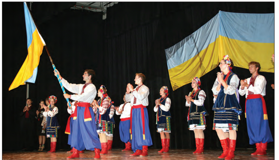
Ансамбль „Іскра” завершує свято винесенням прапора України.

На закінчення вечора уся зала заспівала „Ще не вмерла Україна”.