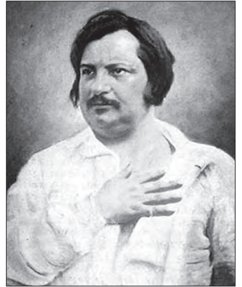
Оноре де Бальзак.

33-річного літератора листівка заінтригувала, йому лестила непересічна обізнаність незнайомки в колізіях романів. В газеті 9 грудня 1832 року з'явилася замітка про те, що О. де Бальзак одержав адресоване йому послання, але не знає, куди надіслати відповідь. Почалося романтичне листування, але Ева з роду графів Ржевуських була заміжньою вже 14 років. Її чоловік Вацлав Ганський був на 22 роки старший за неї. Е. Ганська таєм-