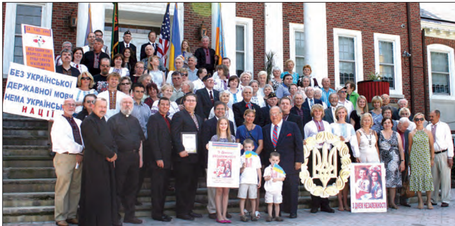
Учасники піднесення прапора України перед міською радою в Юніоні.

Спонзорували свято Українська Американська Кредитова спілка „Самопоміч”, похоронне заведення „Литвин і Литвин”, „Olympic Community Market” і „T. P. Electrical Service”.