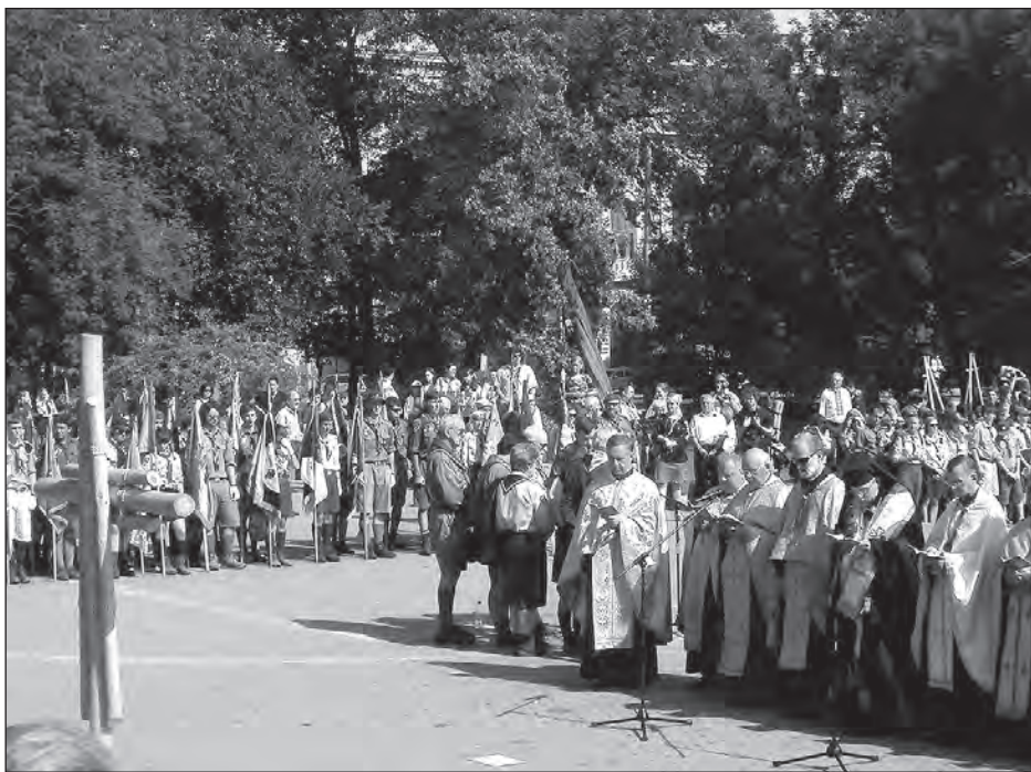
Пластовий провід на урочистій церемонії закінчення Ювілейної Міжкрайової Пластової Зустрічі.

Потім у центрі міста, біля пам'ятника Королеві Данилові, пластуни організували виставку-ярмарок, а увечорі, на території Українського Католицького Університету, відбулася велика прощальна пластунська ватра.