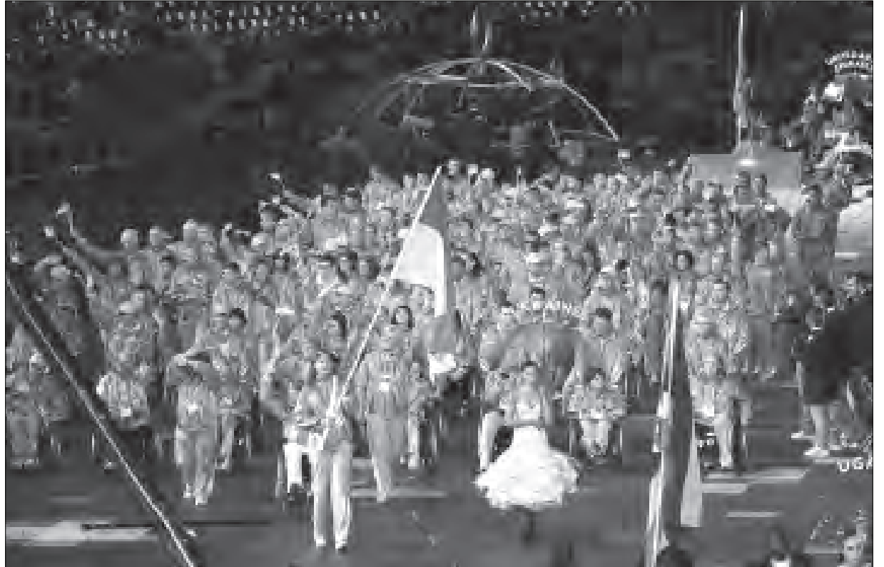
Національна команда України на відкритті Паралімпіади-2012.

ЛОНДОН. – XIV Паралімпіада розпочалася з церемонії відкриття 29 серпня і триватиме до 9 вересня. Церемонія відбулася на тому ж стадіоні, де раніше відкривали XXX Літні олімпійські ігри. Відкрив церемонію знаменитий фізик Стівен Гокінг, прикутий до інвалідного крісла.