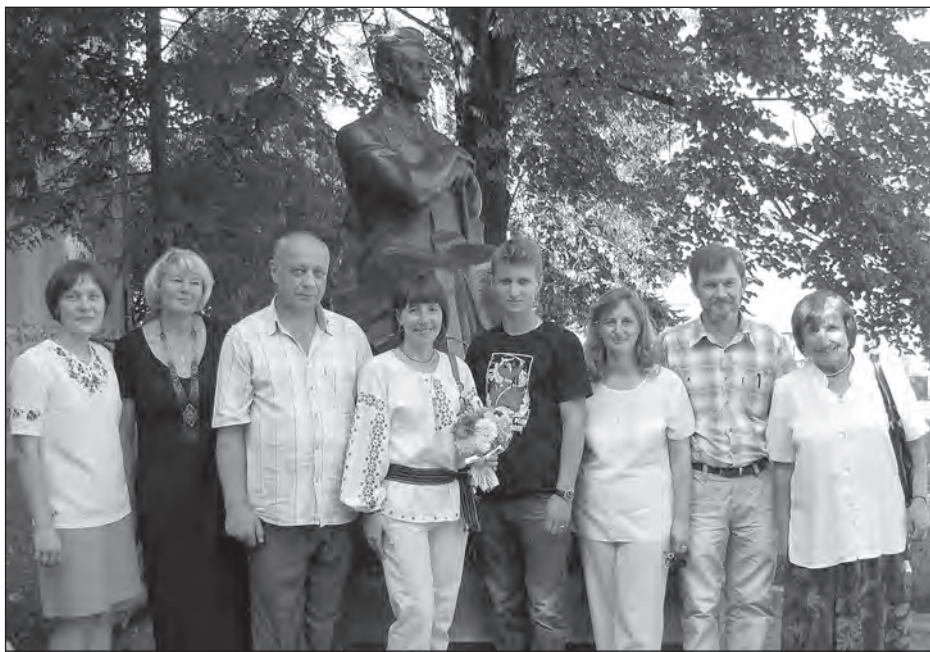
Учасники свята біля пам'ятника Богданові Лепкому.

Завершилось свято покладенням квітів до пам'ятника Б. Лепкому і виконанням відомої на весь світ пісні „Журавлі“ на його слова.