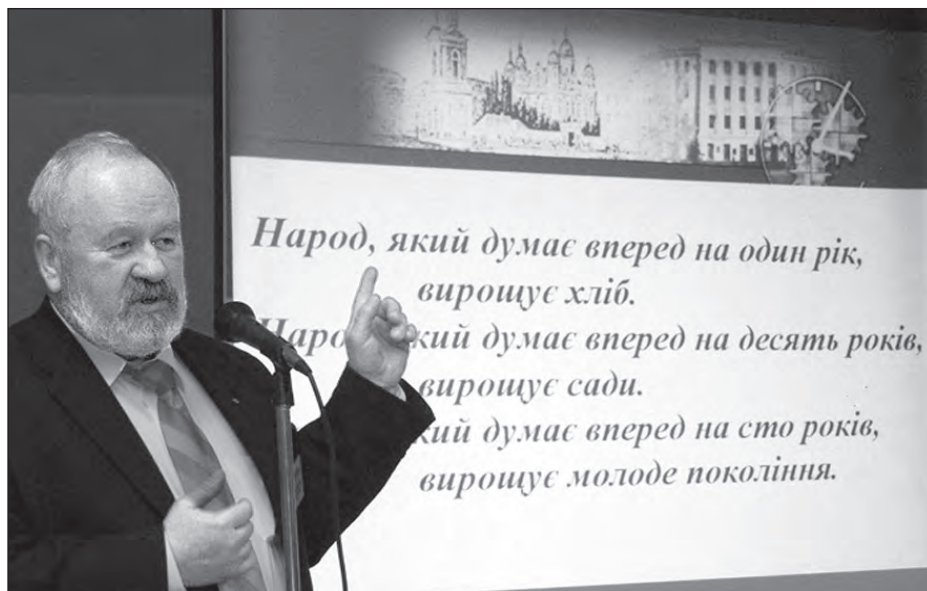
Почесний президент Національного університету „Києво-Могилянська академія“ Вячеслав Брюховецький.

Добродійні внески також потрібні для грантів викладачам, для залучення найкращих професорів і викладачів та сприяння у їхній навчальній і виховній праці.