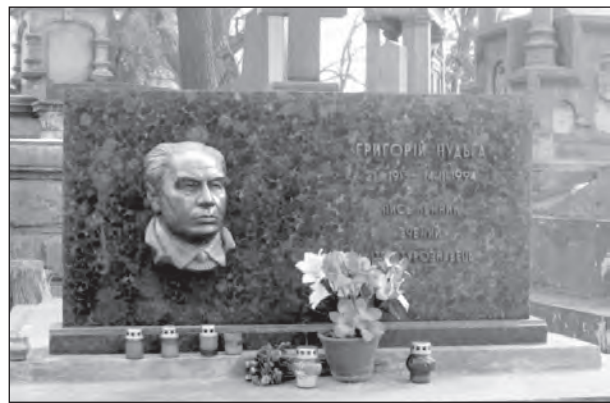
Могила Григорія Нудьги на Личаківському цвинтарі у Львові.

Була також низка дослідницьких робіт до антологічних видань з солідними вступними статтями, максимально насиченим довідковим апаратом, бібліографією та коментарями. Це, зокрема, монографії „Пародія в українській літературі“ (1961) і „Українська балада“ (1970), в яких вчений розгортає широкий погляд на ці жанри в українській літературі, простежує їх розвиток в історич-