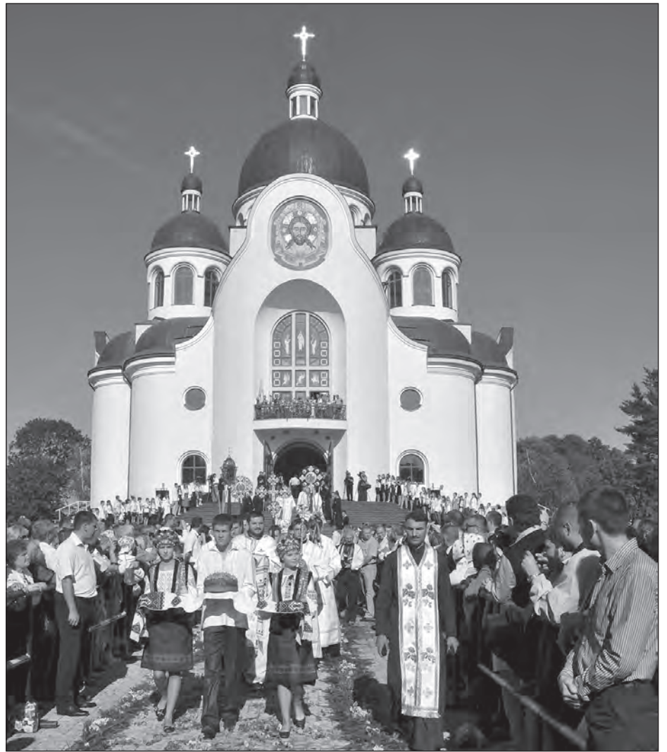
Під час урочистого освячення собору Преображення Господнього у Коломиї.