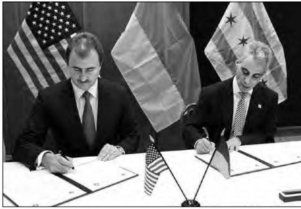
Голова Київської міської державної адміністрації Олександр Попов (зліва) і посадник Чикаго Рам Емануель підписують Спільну декларацію міст-побратимів.

Церемонія іменування вулиці відбулася за участі посадовців міста та представників української громади. В Українському культурному осередку делегацію привітали хлібом-сіллю українські американські ветерани, учасники танцювального ансамблю „Громиця”,