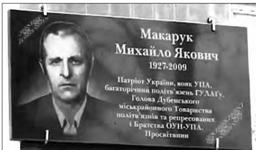
Меморіальна дошка на честь Михайла Макарука.

М. Макарук пішов з дому у 16 років. Його заарештували як зв'язкового УПА і засудили на 20 років каторжних робіт та п'ять років позбавлення прав.