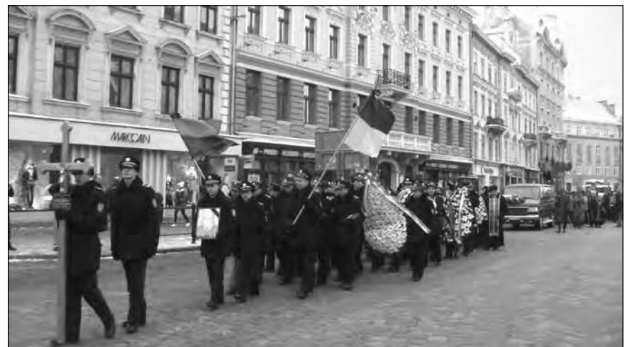
Похоронна процесія на вулиці Львова.