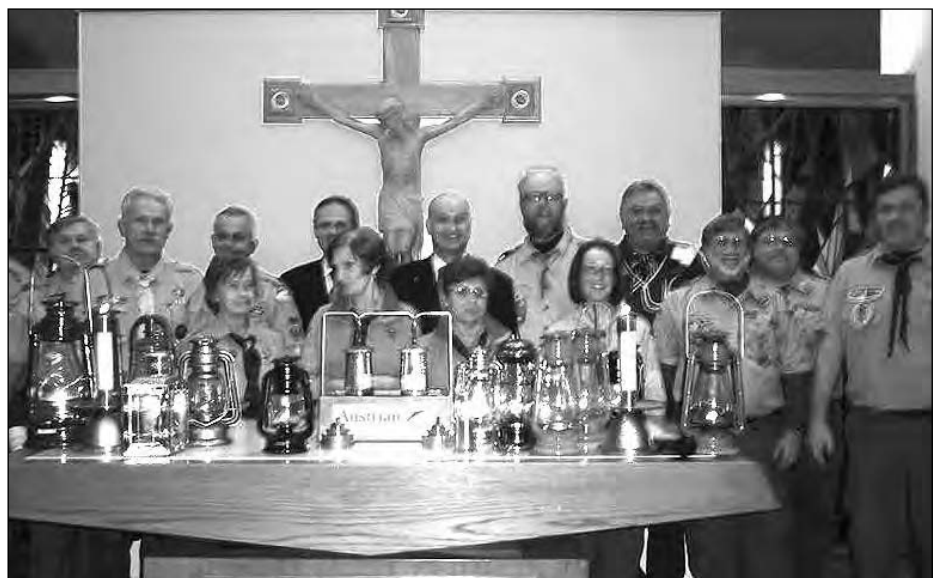
Учасники передання „Вогню миру“.