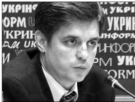
Надзвичайний і Повноважний Посол України в Канаді Вадим Пристайко.

„Після 18 місяців відсутності посла в Канаді, ми вітаємо призначення Вадима Пристайка Надзвичайним і Повноважним Послом України в Канаді, – заявив президент КУК Павло Грод. – Беручи до уваги важливі зв'язки між нашими двома країнами, а також важливі події, що відбуваються в Україні, дуже важливо мати представництво вищого рівня у Посольстві та консульствах Канади. Наша громада знає В. Пристайка з часу його