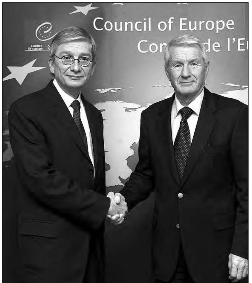
Президент Світового Конгресу Українців Євген Чолій (зліва) і Генеральний секретар Ради Європи Торбйорн Ягланд.

9 листопада під час візиту до Страсбурга Є. Чолій зустрівся з місцевими українцями. Під