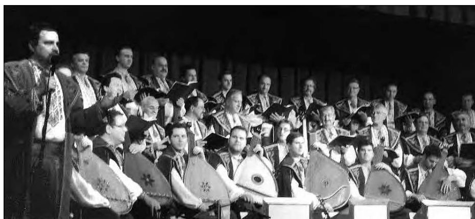
Капля бандуристів ім. Тараса Шевченка.