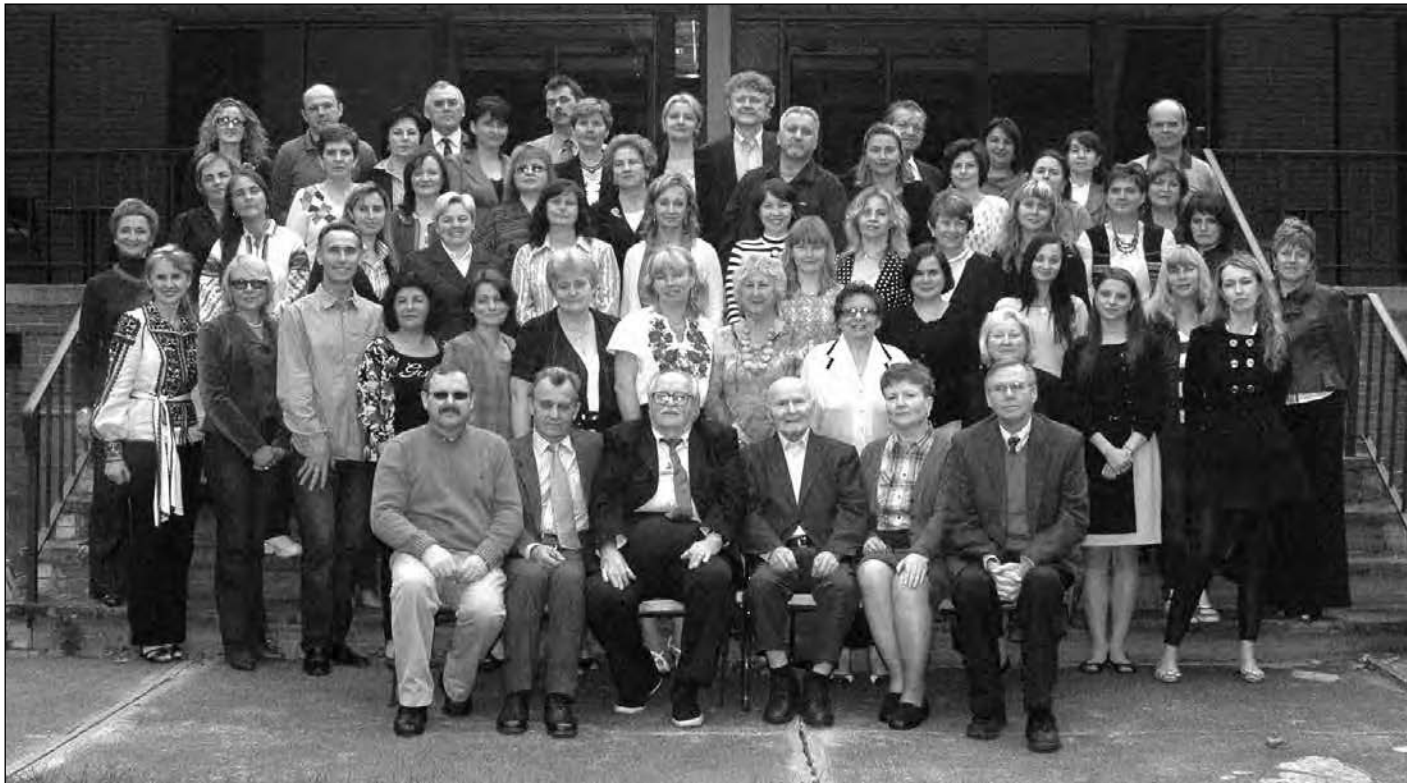
Учасники Всеамериканської конференції учителів Шкіл українознавства в Еленвілі, Нью-Йорк.

Конференція мала велике значення для виховання дітей і пошуку правильного шляху до юних сердець, щоб вміло, майстерно розвинути таланти, навчити мови, історії, культури, допомогти самоутвердитись як істинним українцям, хоч і в еміграції.