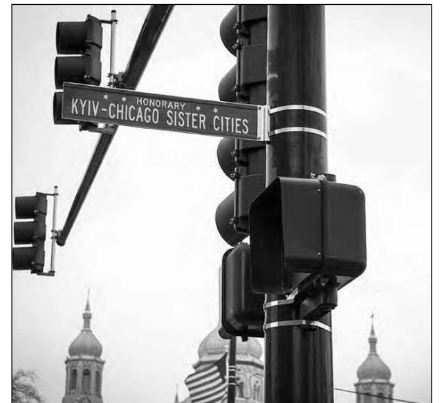
Новий вказівник „Honorary Kyiv-Chicago Sisters Cities Way” на вулиці, що проходить через „Українське село”.