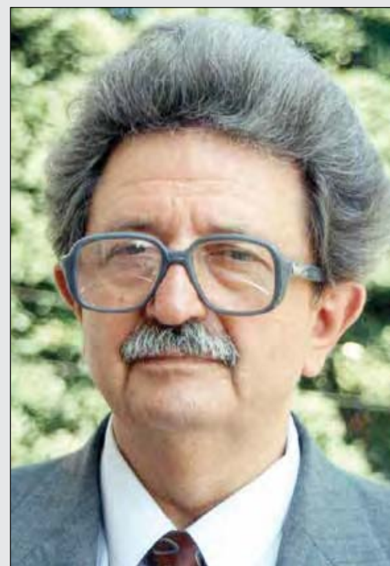
Св. п. Михайло Горинь

ЛЬВІВ. – У ніч на 13 січня помер у Львові, на 83-му році життя, український дисидент, правозахисник, політв'язень радянських таборів Михайло Горинь. Останні місяці відомий українець важко хворів.