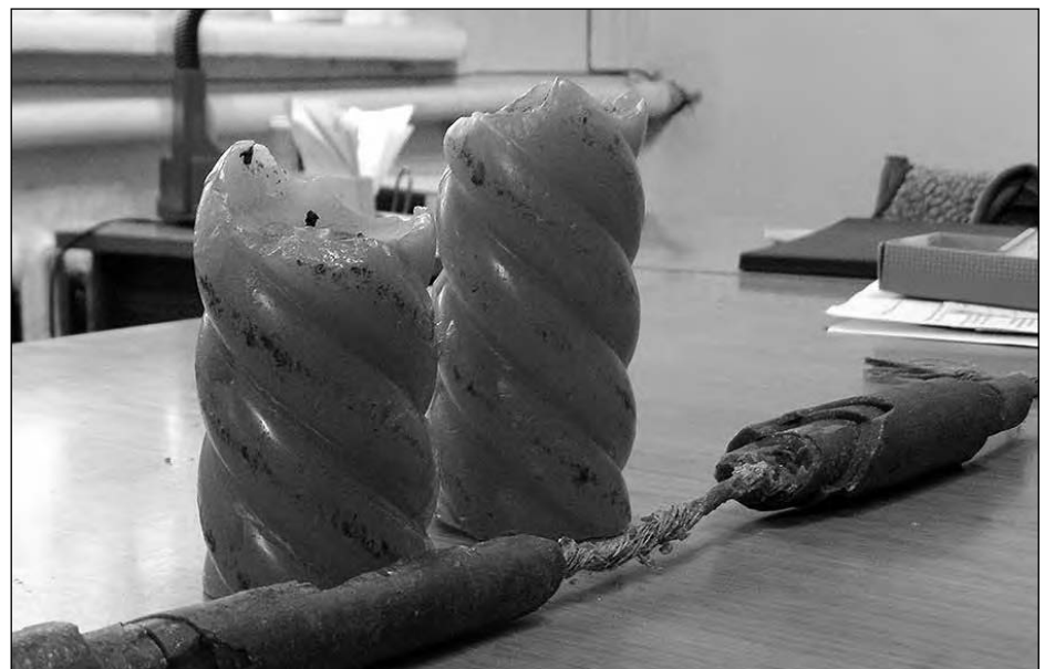
Свічки з фондів краєзнавчого музею в Рівному.