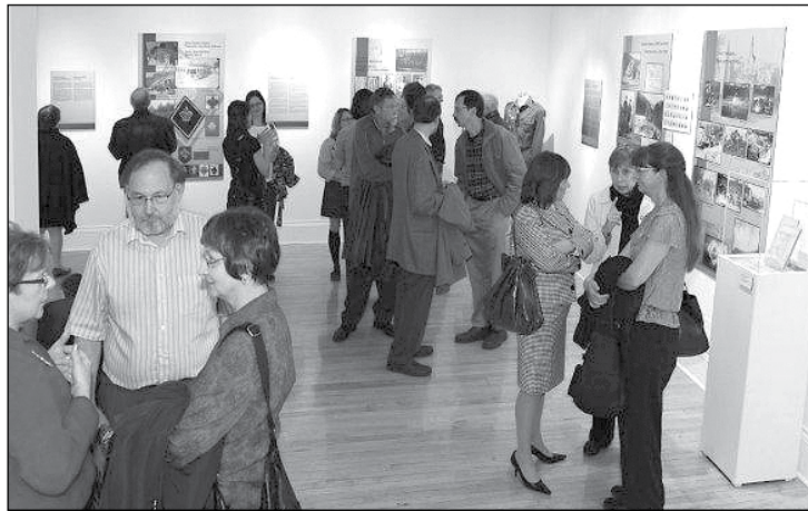
Загальний вид виставки.