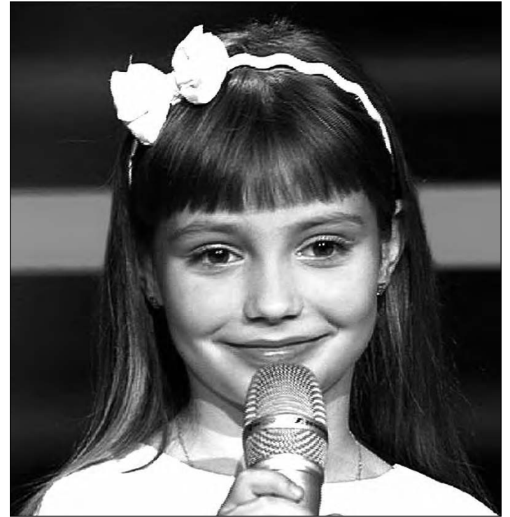
Ганнуся Ткач – найкращий голос України.