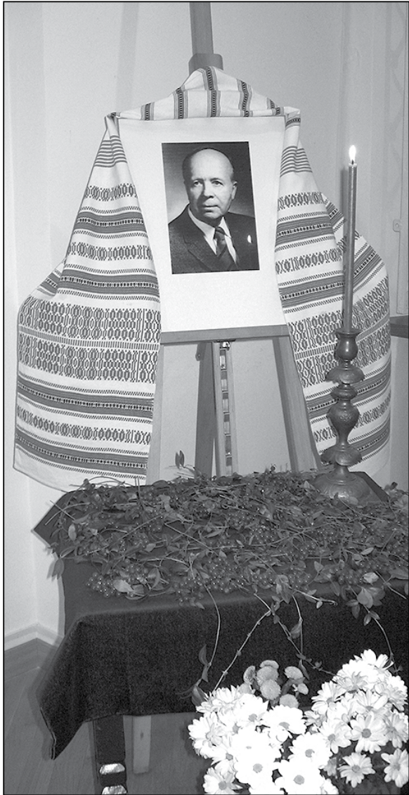
Фрагмент виставки, присвяченої академікові Григорієві Костюкові.

На завершення вечора о. Петро Бойко прочитав уривок зі спогадів Г. Костюка „Зустрічі і прощання“.