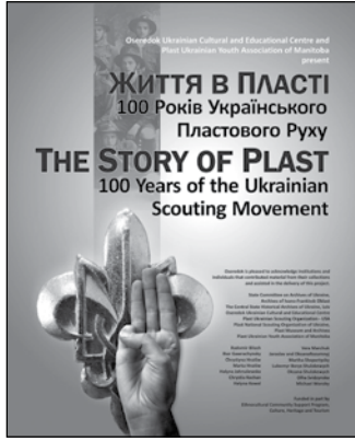
Афіша виставки про 100-ліття Пласту.