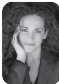
Фіона Мирфі сопрано