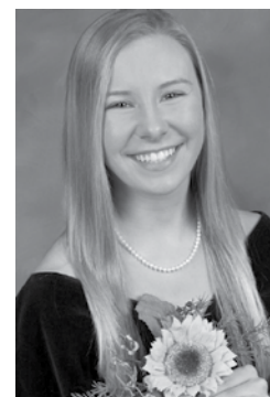
Андріана Доліба Андрій Тарасюк