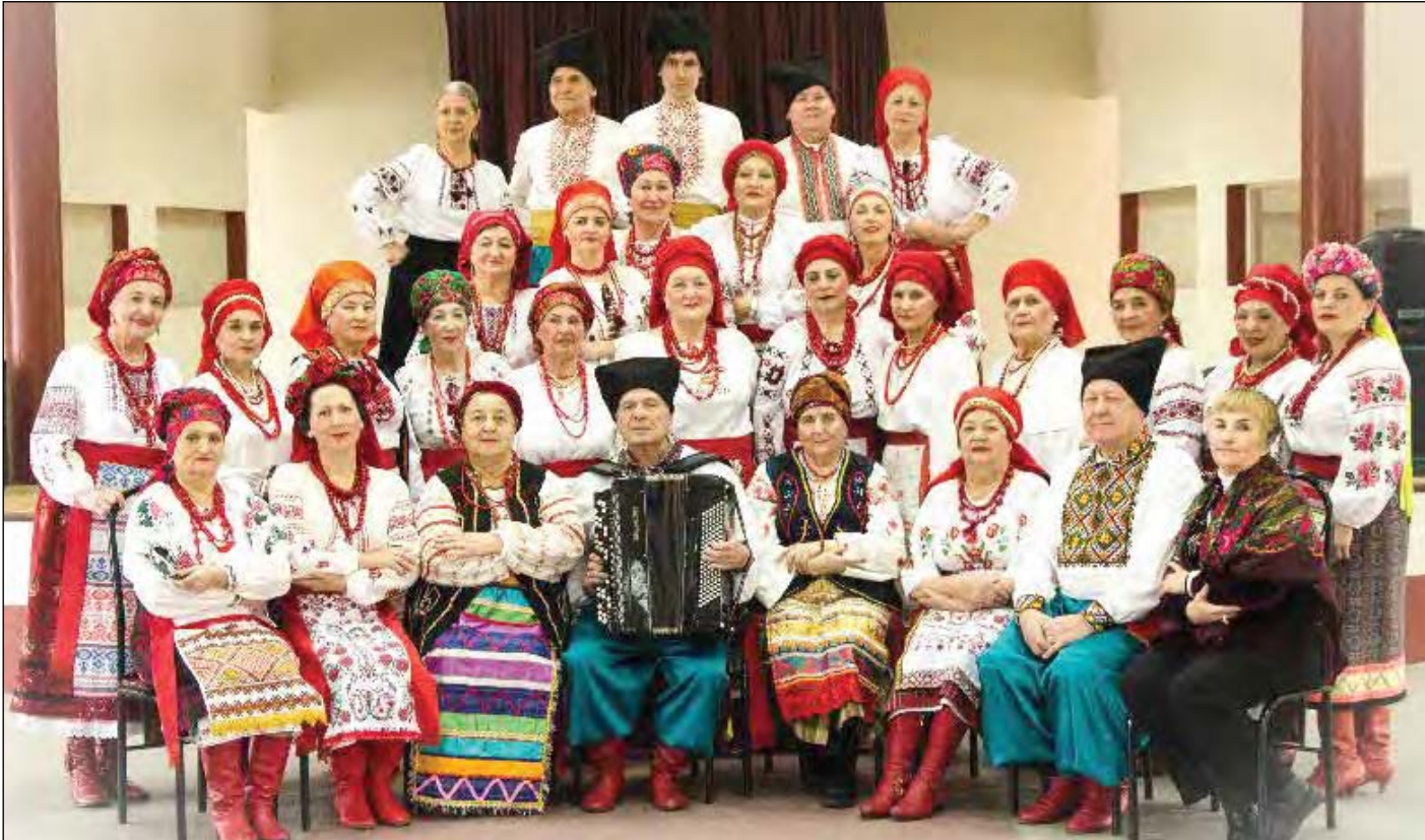
Народний український хор „Мрія“ в Хабаровську.