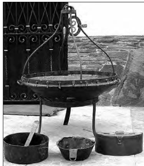
Прилад для відливання свічок (XVII ст.) з храму села Страклів.