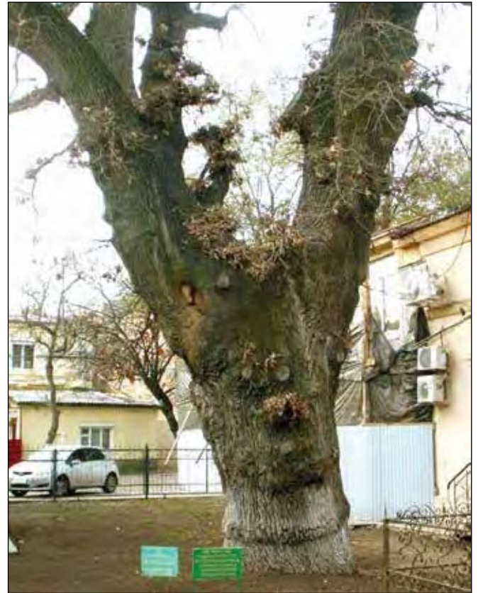
200-літній дуб „Чорна ніч“ на проспекті Шевченка в Одесі.

Громадськість не втрачає надії, що й за іншими позовами козаків суди винесуть справедливі рішення, і багатостраждальний велетень радуватиме людей своєю величною красою.