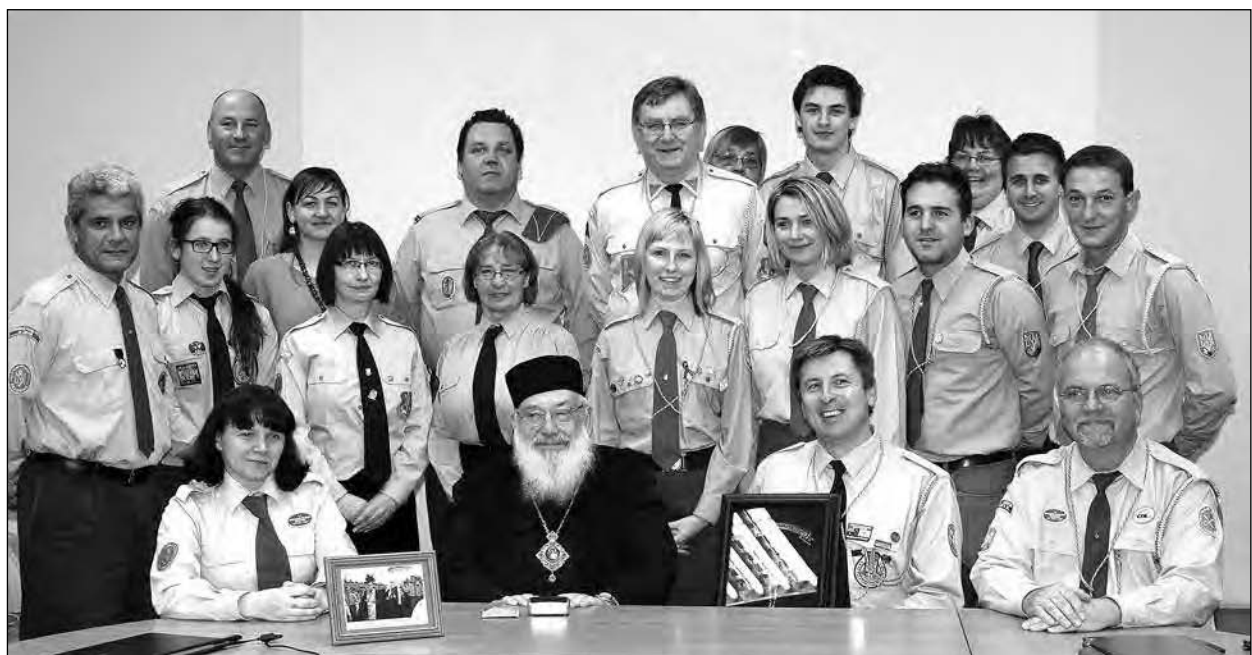
Делегати Світового Пленуму СУМ у Києві в листопаді 2012 року.