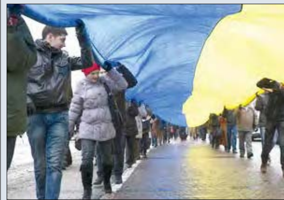
Учасники живого ланцюга несуть розгорнутий український прапор.

КИЇВ. – 22 січня на мосту Патона кияни відсвяткували День Соборности і 95-ту річницю проголошення Незалежності України, об'єднавши два береги Дніпра живим ланцюгом.