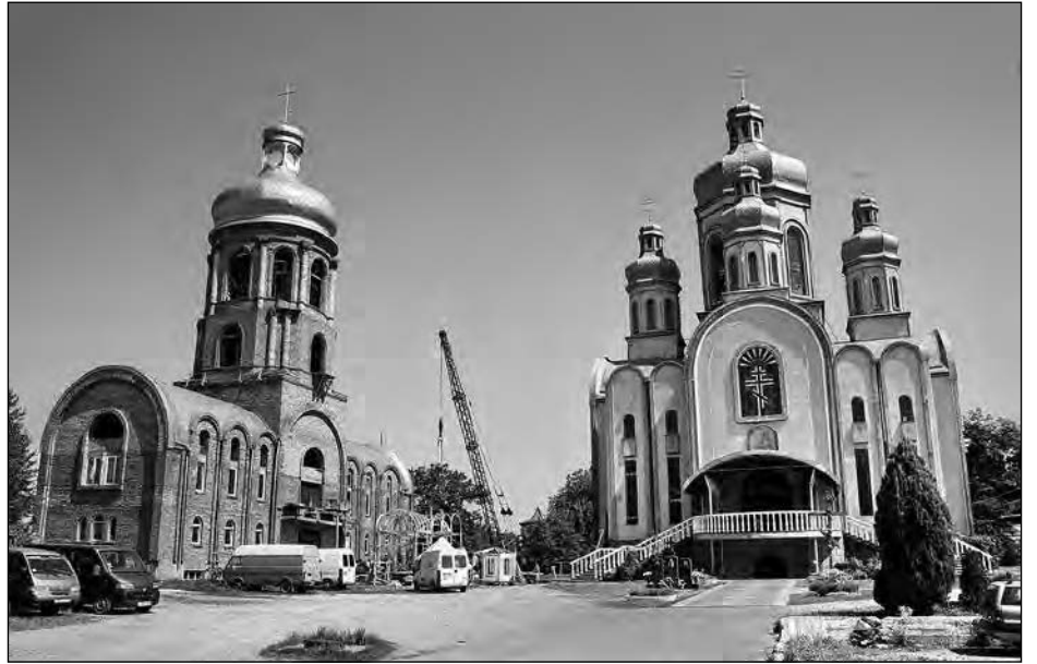
Православний собор Успення Пресвятої Богородиці.

Люблять вони своє місто, беруть його історичне минуле. Переконалися у цьому можна з мого фоторепортажу.