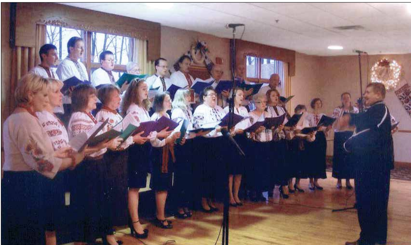
У Пармі співає церковний хор.

Завершальним акордом став спів „Многая літа“ усім присутнім на торжествах.