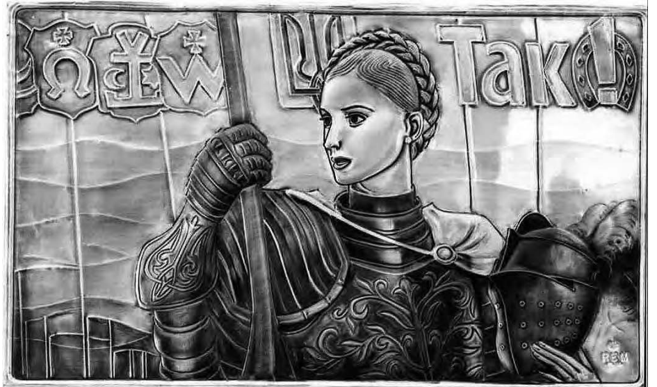
Рема Багаутдин. „Юлія Тимошенко“.

Тимошенко картину Р. Багаутдина і сказав: „Коли я був у США, цю картину попросив мене передати великий український художник Рема Багаутдин, який створив портрет Юлії Тимошенко в образі Жанни Д'Арк. Я виконав це доручення і вручив картину її доньці Євгенії“.