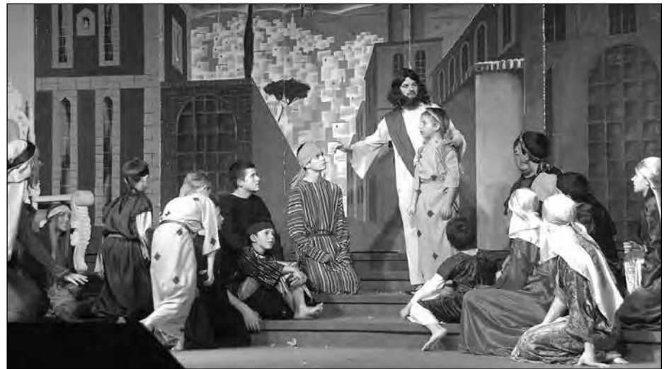
Сцена з вистави „У світ прийшов Спаситель“.

Театр виступав також в Україні і Росії, зокрема в Донбасі і Криму, де ще міцно вкорінені радянські пережитки. В репертуарі театру є Великодній мюзикл „Чому ти мовчиш?“ та вистава „Молитва матері“.