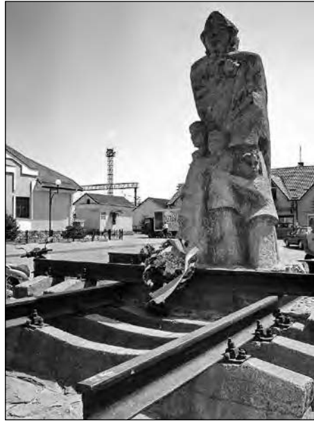
Меморіал депортованим українцям з Лемківщини, Надсяння і Підляшшя.