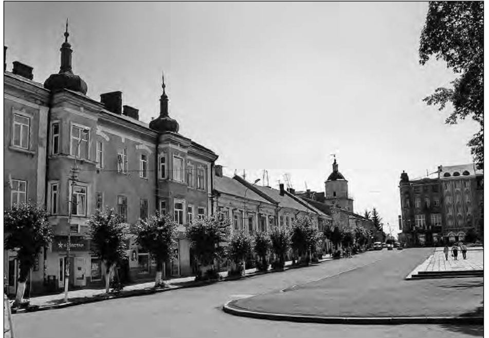
Ратушина площа в Самборі.