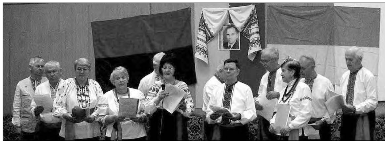
Співає сільський самодіяльний хор.

Діяла виставка книжок національної спрямованості, де можна було придбати, рідкісні видання Зиновія Книша (Торонто, 1970), Олега Штуля-Ждановича (Нью-Йорк, 1997), „Реабілітації не буде“ (видана у Москві 2011 року й відразу заброньована російською владою).