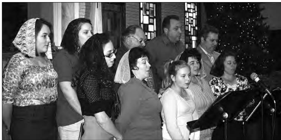
Колядники з Філадельфії.

Потім співав хор з Філадельфії. Жіноцтво приготувало частування, яким завершилася святкова зустріч.