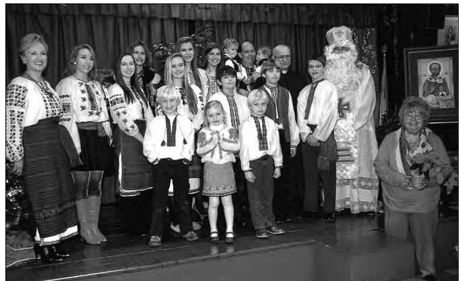
Св. Миколай відвідав Українську католицьку церкву св. Михайла.