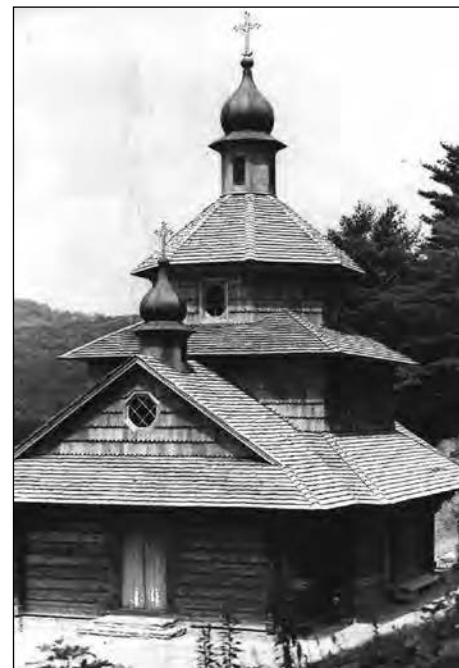
Проект церкви Ярослава Паладія.