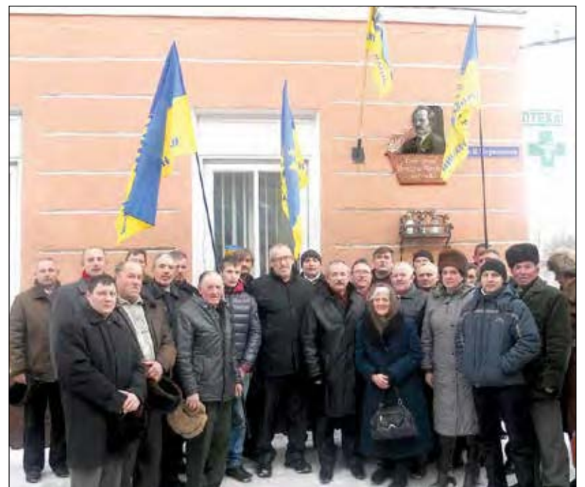
Учасники відзначення 75-річчя В'ячеслава Чорновола біля меморіальної дошки в Бережанах.

25 грудня було покладено квіти до меморіальної дошки В. Чорновола в Бережанах. Тематичний вечір, присвячений 75-річчю В. Чорновола, проведено у районному будинку народної творчості.