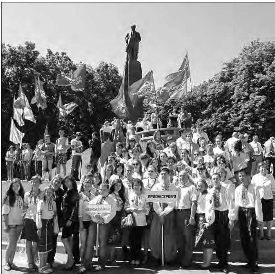
Переможці конкурсу 2012 року в Каневі.