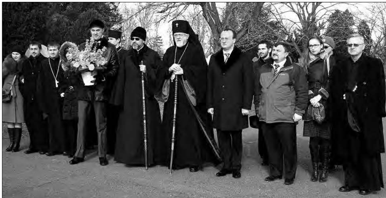
Учасники відзначення Дня Соборности покладали квіти до пам'ятника „Борцям за волю України“.