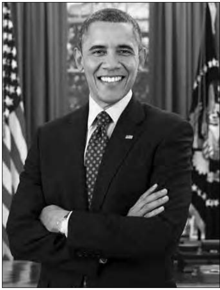
Барак Обама, 44-ий Президент США.

ВАШІНГТОН. — У США і журналісти, і прості громадяни ще довго обговорюватимуть події, що відбулися напередодні, 21 січня, у Вашингтоні. Під час церемонії інавгурації 44-ий Президент Барак Обама згідно з вимогою Конституції склав присягу 20 січня і офіційно вступив на свою посаду. Однак, оскільки цей день є вихідним для державних установ та судів у США, публічно присягу довелося повторити наступного дня, 21 січня. Вранці президентське подружжя відвідало церковну службу, після чого вони попрямували в Капітолій. До присяги Президента привів головний суддя Верховного суду Джон Робертс. Віце-президента Джозефа Байдена до присяги привела суддя Верховного суду Соня Сотомайор. Гостями церемонії члени Конгресу, Кабінету, судді Верховного суду, губернатори штатів і члени дипломатичного корпусу. Всі вони розмістилися на споруджених на сходах Капітолію трибунах. Сам Б. Обама виголошував присягу та інавгураційну промову на спеціальному подіумі, захищеному куленепробивним склом. Однак, за церемонією могли спостерігати і пересічні громадяни, які розташувалися під Капітолійським пагорбом і на Еспланаді — головному вашінгтонському бульварі. За деякими підрахунками, їх зібралось майже 800 тис.