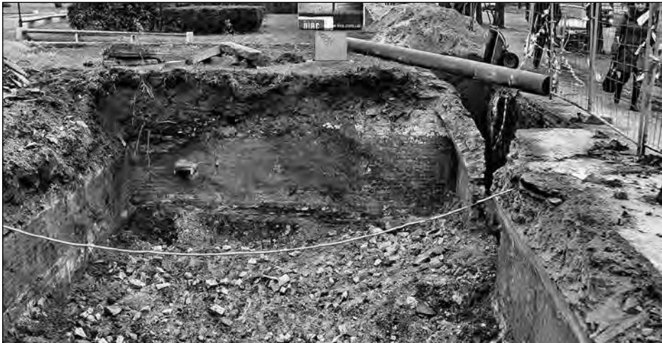
Рештки старої будівлі, виявлені в центрі Черкас.