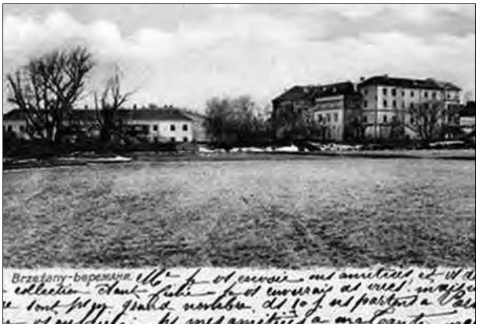
Бережани на старій картці.

Микола Проців – старший науковий працівник Бережанського краєзнавчого музею.