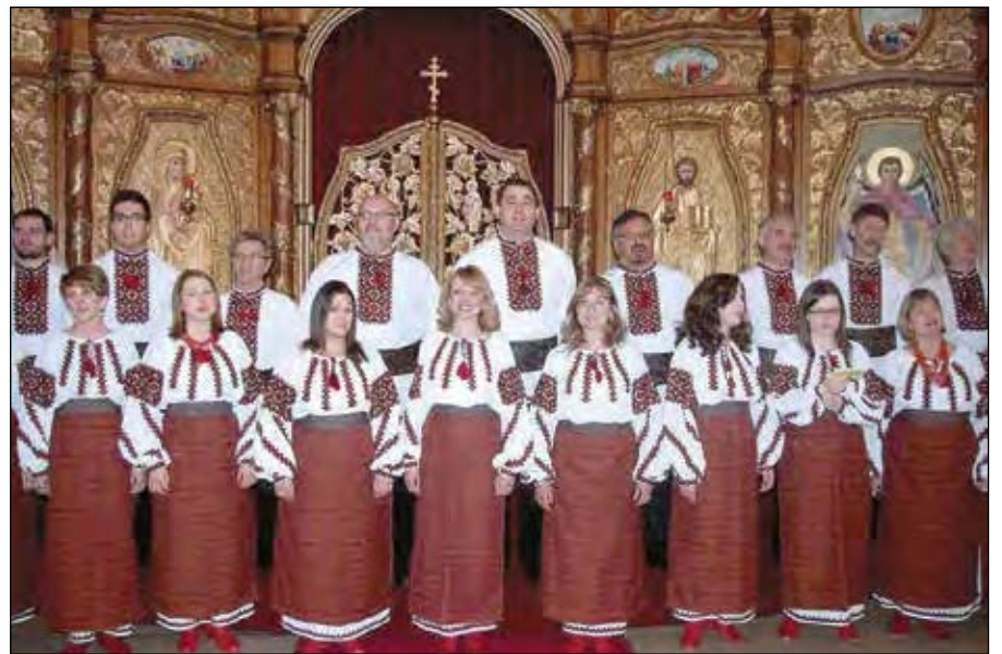
Виступає Український народний хор „Вітер”.

З нагоди концерту у притворі катедри відбулася збірка добровільних датків на проект „Orphanage Project in Ukraine care of Western Eparchy” (допомога сиротинцям в Україні), про який розповів під час програми о. Корнель Зубрицький. Було зібрано 3,806 дол.