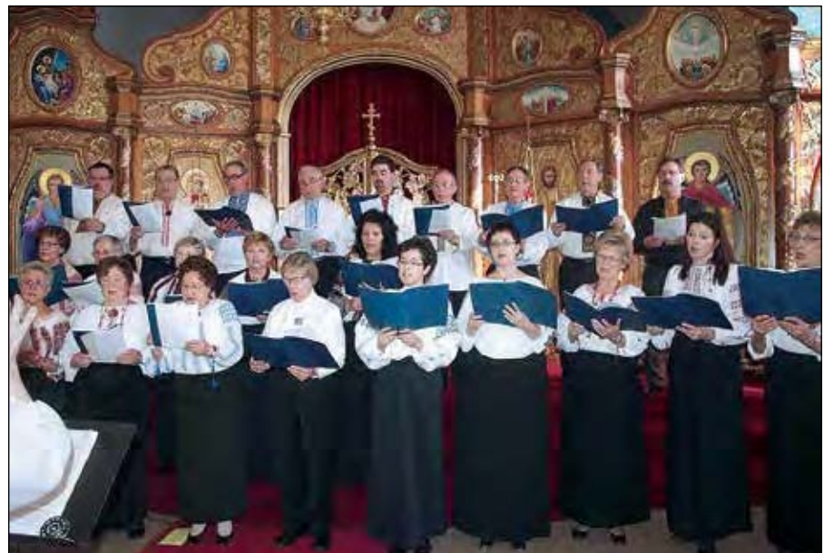
На сцені – збірний український православний хор.