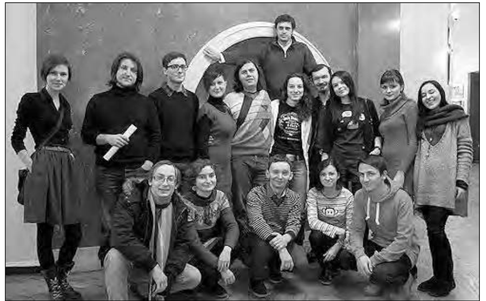
Творча молодь, яка своєю поезією вшанувала в Києві героїв Крут.