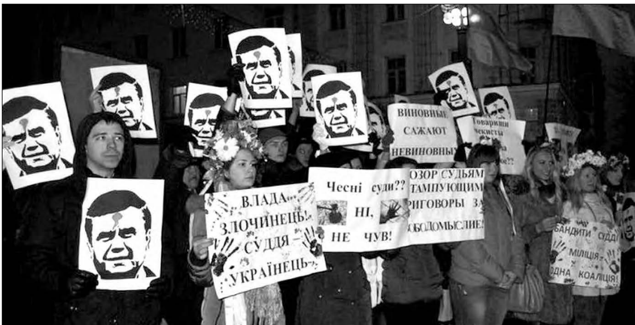
Віче в Сумах на знак солідарності з засудженими.

Першими таку акцію провели в Сумах. У Києві молодь пікетувала Адміністрацію Президента України. Віча солідарності відбулися також у Харкові та Рівному. Як і передбачали учасники цих акцій, рішення суду, який на догоду владі безжально покарав сумських студентів, спровокувало появу нових трафаретів у Львові, Києві, Одесі, Севастополі, Кривому Розі та інших містах.