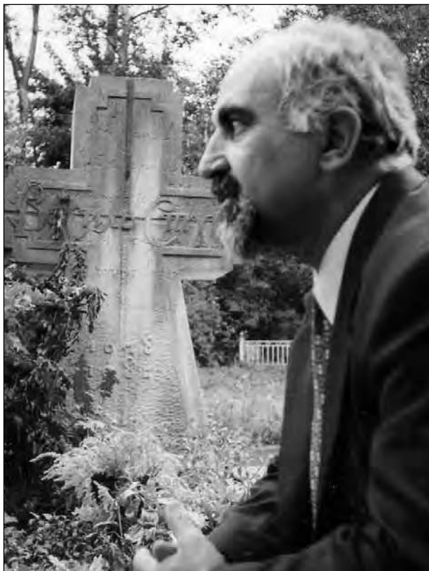
Паруйр Айрікян біля могили Василя Стуса на Байковому цвинтарі 11 вересня 1999 року.

Вирок суду: сім років таборів суворого режиму і три роки заслання.