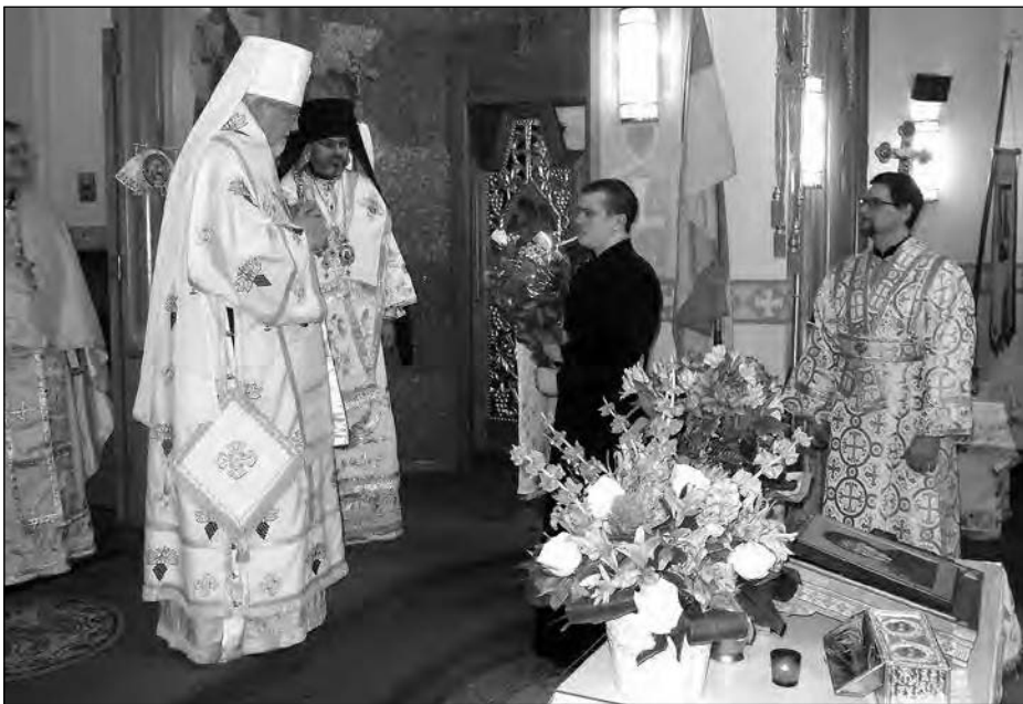
Під час Служби Божої в пам'ять загиблих у бою під Крутами.

Того ж дня на Аскольдовій могилі, де похована частина крутянців, було розповсюджено тисячі брошури „Крути. Пам'яті героїв Крут“, яку щорічно великим накладом видає „Смолоскип“ (у цьому році при фінансовій допомозі Фондації ім. Івана Багряного).