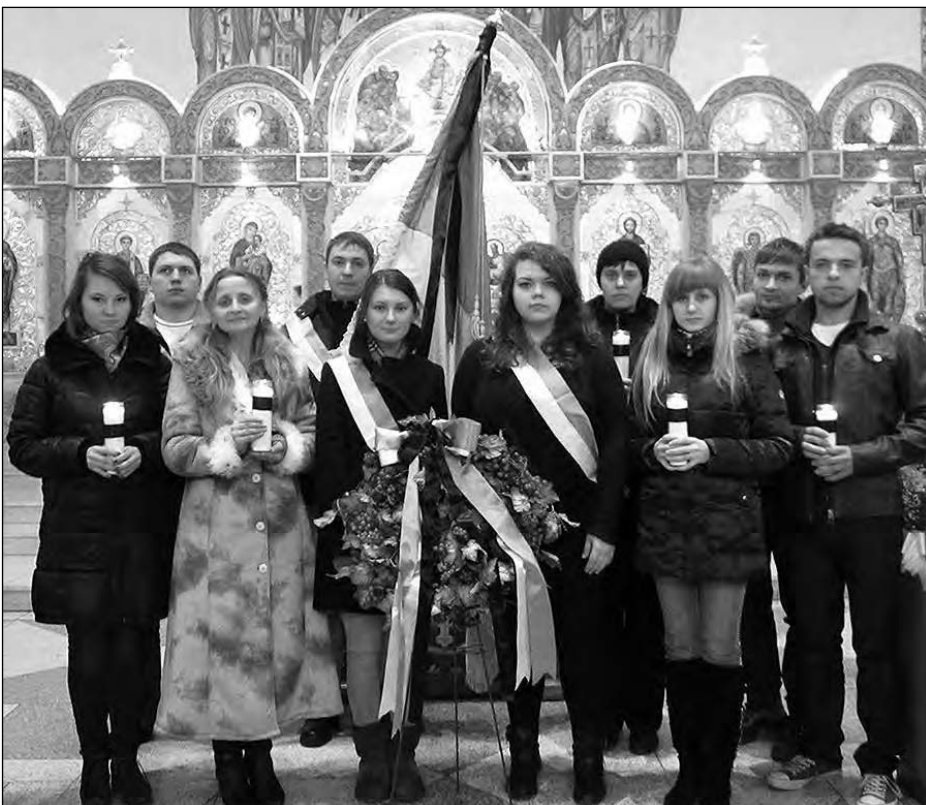
Вшанування пам'яті героїв Крут в церкві св. Юра в Нью-Йорку.