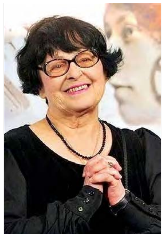
Кіра Муратова на Римському міжнародному кінофестивалі.

Прикро, що фільмів Народної артистки України, нагородженої орденом Князя Ярослава Мудрого, лавреата Державної премії ім. Тараса Шевченка, багатьох фестивальних нагород у різних номінаціях не бачили і не знають навіть одесити.