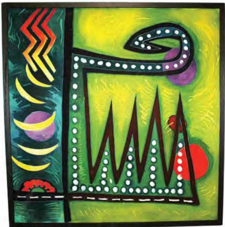
Наталка Валенюк. „Берегиня“ (батік).