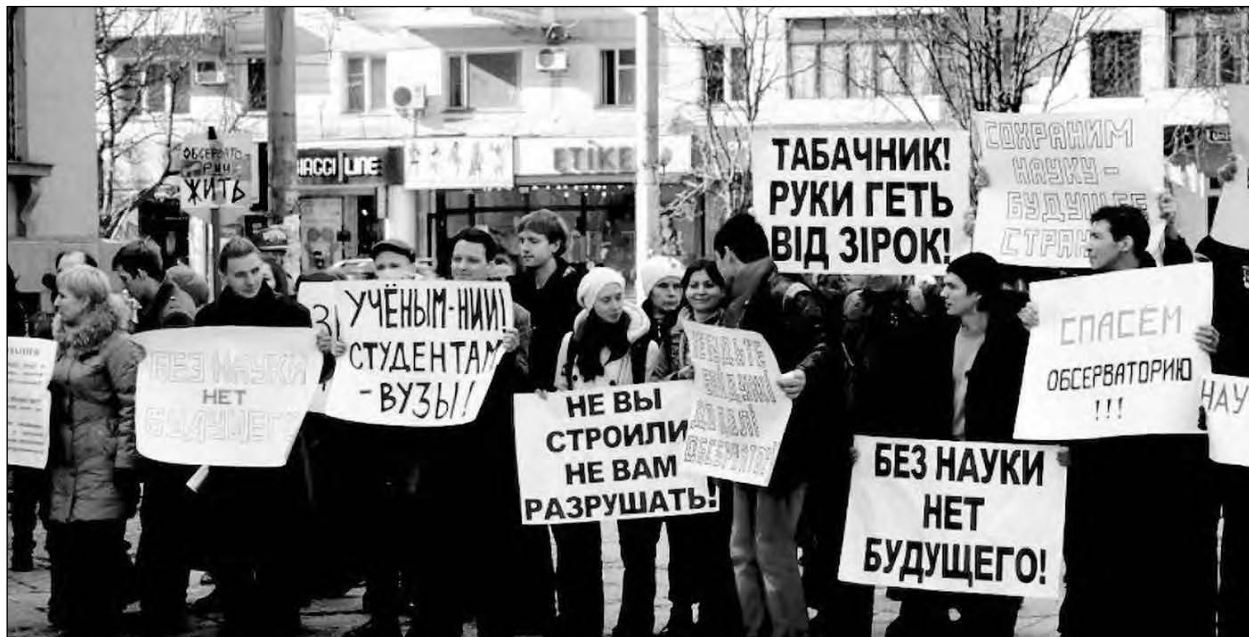
Акція у Симферополі на захист Кримської обсерваторії.

Кримська обсерваторія здатна вирішувати широке коло актуальних астрофізичних і астрометричних завдань. Дев'ять з 26 її телескопів визнані національним надбанням України, а радіотелескоп TP-22 входить до світової мережі радіоінтерферометрії. Обсерваторія здобула світове визнання, її наукові проекти відповідають найвищим стандартам, а частина з них є міжнародними.