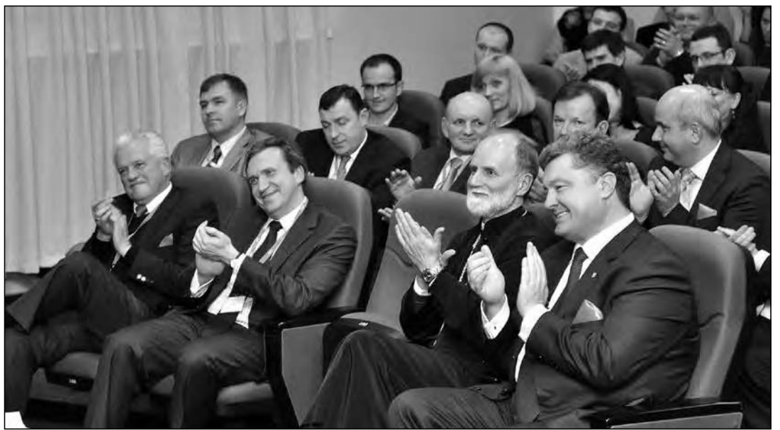
Учасники конференції у Львівській бізнес-школі УКУ.