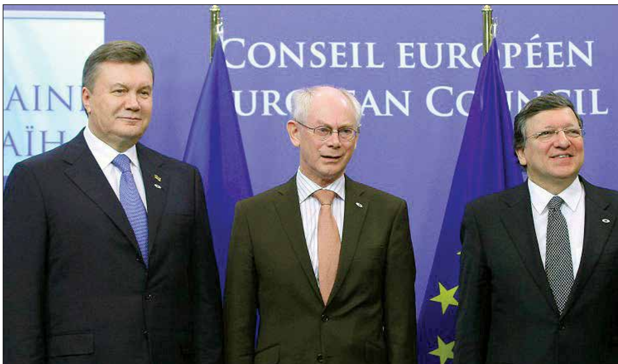
Президент України Віктор Янукович, голова Європейської Ради Герман Ван Ромпей і голова Європейської Комісії Жозе Мануель Баррозу під час зустрічі в Брюсселі.

БРЮСЕЛЬ. – 25 лютого відбулася 16-та з черги зустріч „Україна–Європейський союз“, на яку поклали великі надії багато українських та європейських політиків. Зустріч відбувалася – і спостерігачі вважають цю обставину важливою – в будинку Ради Європи. На урочистій церемонії відкриття були присутні Президент України Віктор Янукович, Голова Ради Європейського союзу Герман Ван Ромпей і Президент Європейської комісії Жозе Мануель Баррозу.