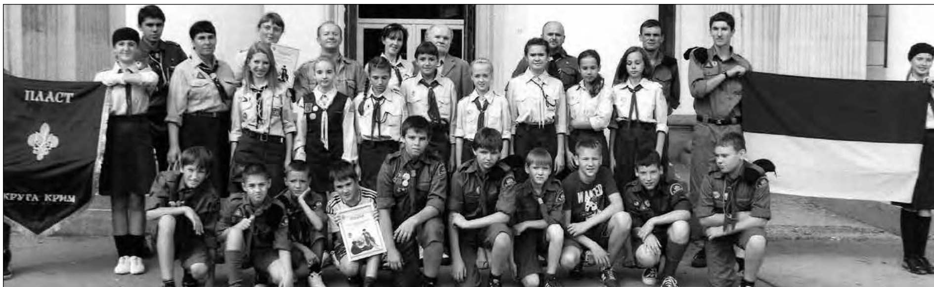
Кримські пластуни з символікою Пласту і України.