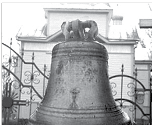
Знайдений дзвін повернувся до храму Різдва Богородиці.

Дослідники з допомогою металошукачів схованку виявили біля плоту, що огорожує храм. На неї натрапив Олександр Кушнірук. Таким чином знайшовся дзвін вагою у 100 кілограмів.