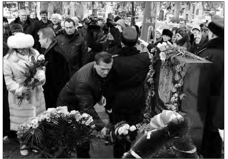
Покладання квітів до пам'ятника на могилі Ольги Басараб.

На завершення був виконаний гімн пластуни, а юначки куреня ім. О. Басараб та інші запалили свічки пам'яті про нескорену українську патріотку.