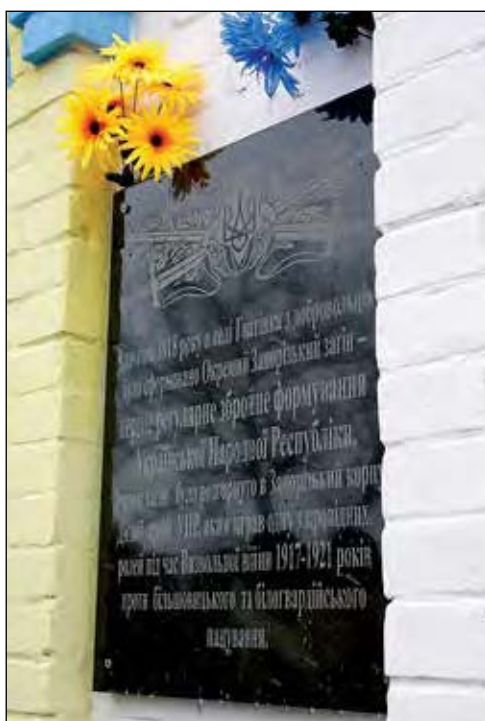
Меморіальна дошка на стіні капличці.

„Героїка“ встановила вже понад 20 монументів та пам'ятних знаків у Києві, Херсонській, Рівненській, Івано-Франківській, Черкаській, Тернопільській, Хмельницькій та Київській областях.