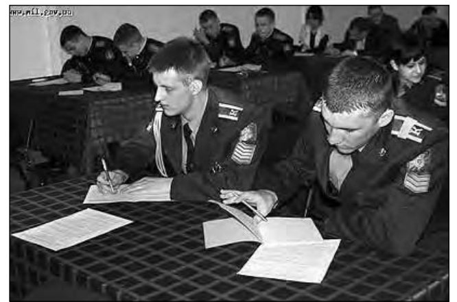
Під час конкурсу з української мови.