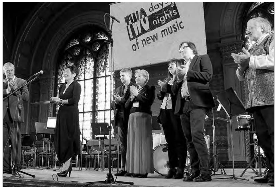
Відкриття фестивалю „Два дні й дві ночі нової музики“.

Чільне місце було відведено українській новій музиці – звучали твори Валентина Сильвестрова, Володимира Рунчака, Юлії Гомельської, Людмили Самодаєвої, К. Цепколенко, Сергія Шустова, Ігоря Щербакова, Олександра Шмурака та інших композиторів. Їх виконали хори „Оріяна“, „Solo Musika“, інструментальний ансамбль „Senza sforzando“ та інші.