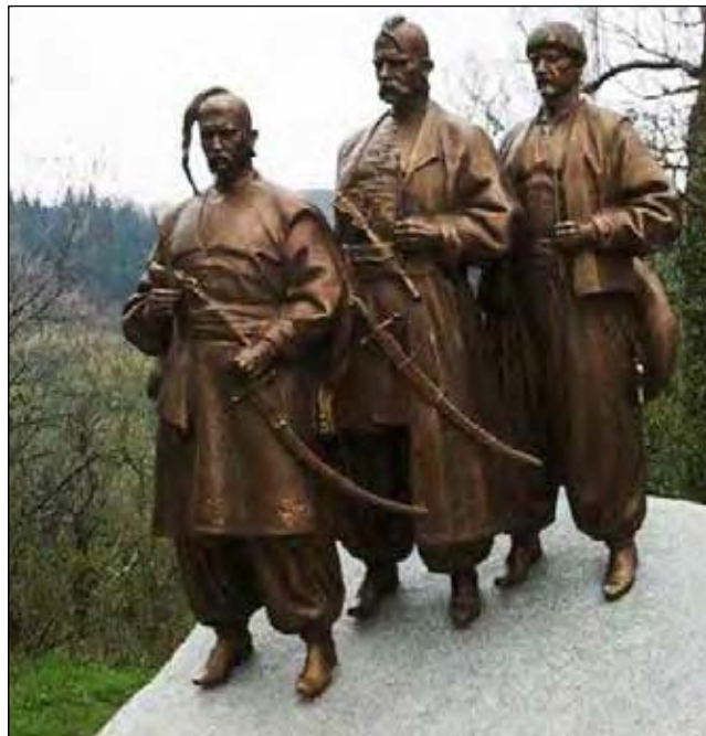
Пам'ятник українським козакам у Відні.