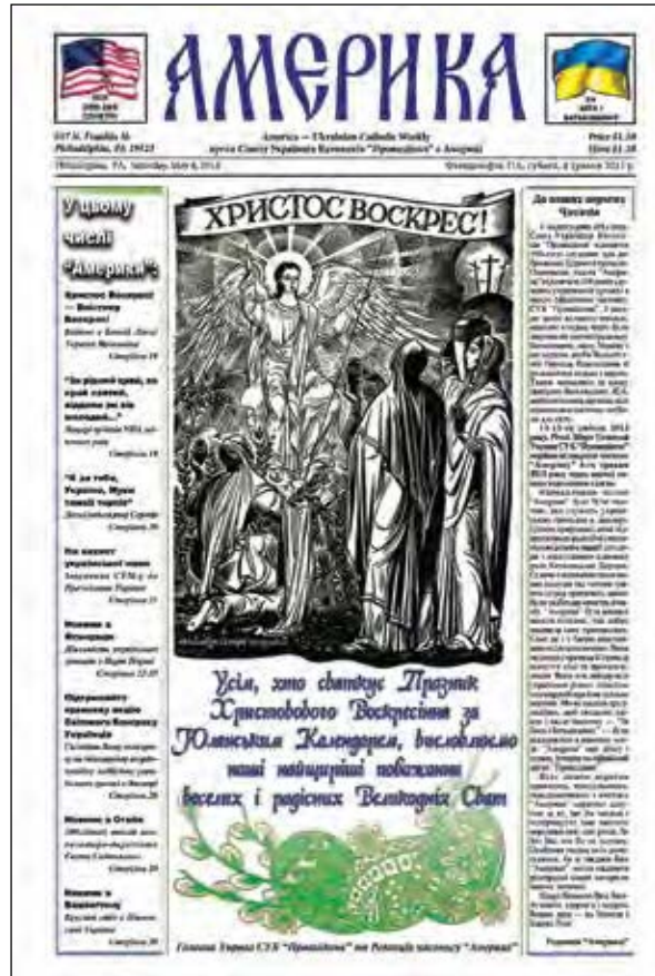
Перша сторінка останнього числа тижневика „Америка“.

ПАРСИПАНІ, Нью-Джерсі. – 4 травня у Філадельфії вийшло останнє число тижневика „Америка“ – офіційного часопису Союзу українців-католиків „Провидіння“. Припинити видання через високі видатки було вирішено на річних зборах головної управи, які відбулися 12-13 квітня.