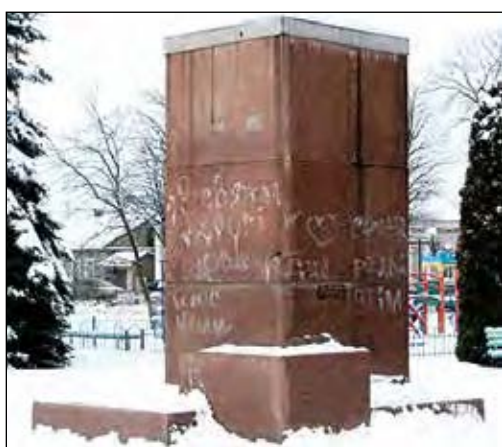
Постамент у Радивиліві вже 20 років чекає на скульптуру.

ОЛБАНІ, Нью-Йорк. — Дослідницька компанія „WealthInsight“ підрахувала капітали найбагатших людей планети, з'ясувавши, які мегаполіси світу є місцем проживання найбільшого числа мільярдерів. Першуні в оцінюванні є Нью-Йорк, де мешкають 70 мільярдерів. Дослідники відзначають, що в першу чергу йдеться про Мангеттен. Слідом за ним йдуть Москва (64 особи), Лондон (54), Гонг-Конг (40) і Пекін (29). Під мультимільонерами „WealthInsight“ розуміє забезпечених громадян з капіталом понад 30 млн. дол. Тут перше місце в оцінюванні дістається Лондонові, де проживають 4,224 мультимільйонери. На другу сходинку потрапляє японська столиця Токіо (3,525), третє - Сінгапур (3,154). Нью-Йорк опинився лише на четвертому місці, адже в ньому мешкають 2,929 багатіїв, а на п'ятому – Рим (945 мультимільйонерів). Водночас аґентство пророкує США скорочення числа багатіїв більш ніж на 300 тис. („Кореспондент“)