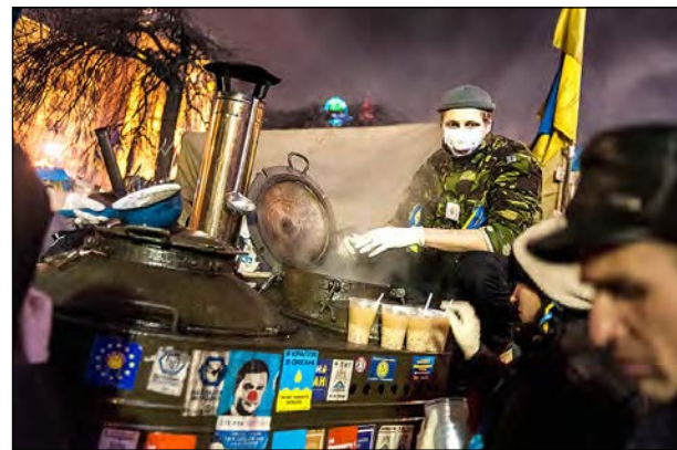
Найгарячіша річ Майдану – чайна парова машина.