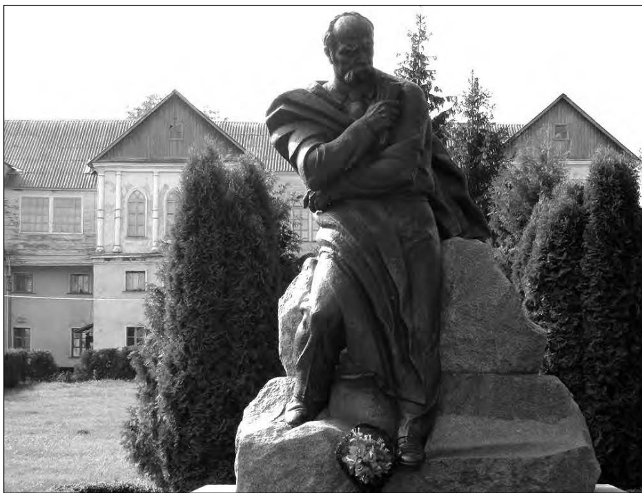
Пам'ятник Тарасові Шевченкові.

Дивно, що парк чомусь так і не набув загальноукраїнської слави. Може, це і на краще. Адже на його просторах можна залишитися на самоті, відчути себе мандрівником у часі і просторі, помріяти в тиші.