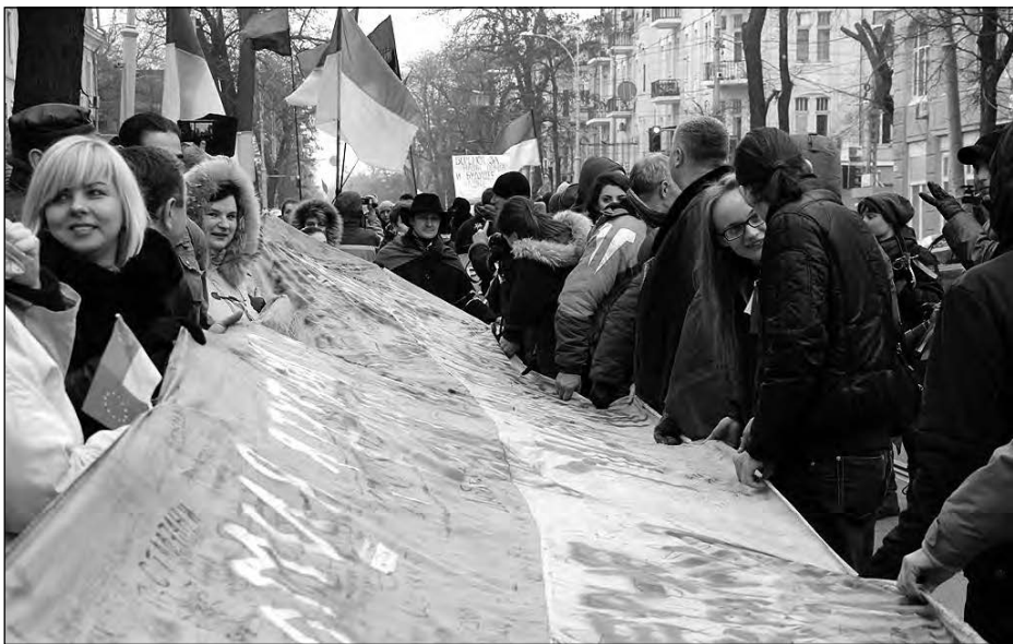
На марші учасники форуму зі знаменом столичного Євромайдану.