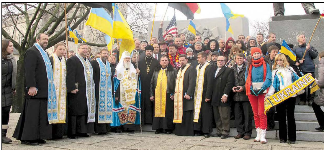
Учасники Молебня біля пам'ятника Тарасові Шевченкові у Вашингтоні.