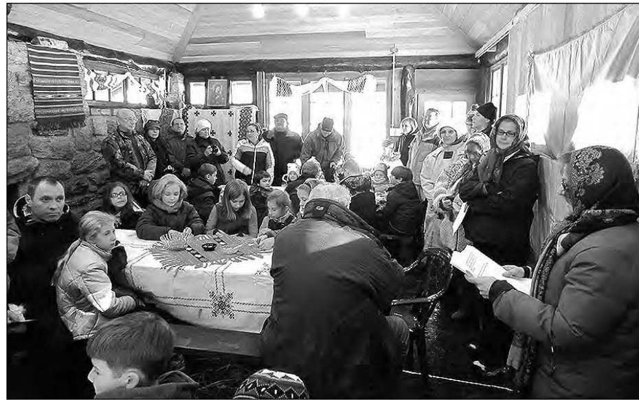
Молодь слухає розповідь про українські різдвяні звичаї в „Українській хатинці“.