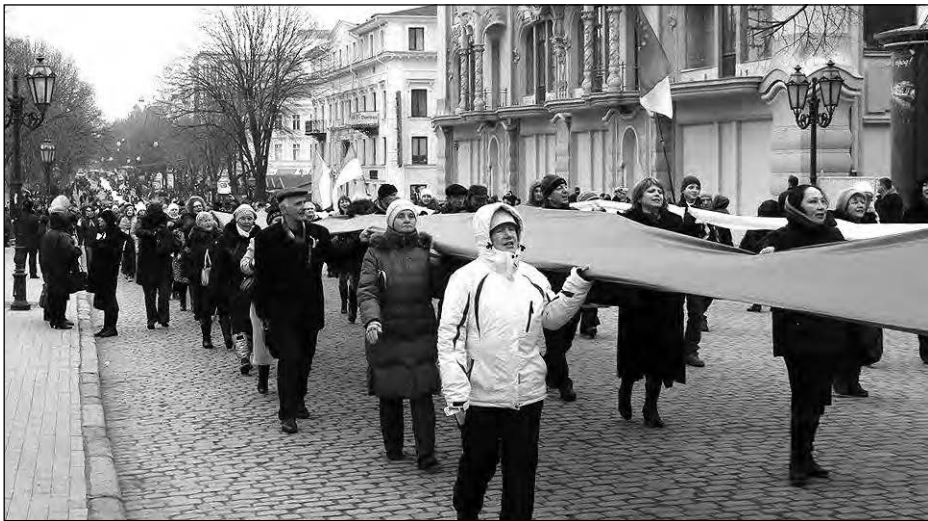
Півкілометрове полотнище прапора України на Дерibasівській вулиці.

На плякатах можна було прочитати: „Україна починається з Одеси“, „Одеса – не Росія“, „Ми на своїй, Богом даній землі“. Учасники маршу скандували: „Одна єдина соборна Україна“, „Разом і до кінця!“, „Схід і захід – разом!“.