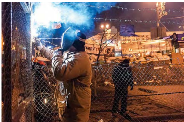
Активісти постійно ремонтують і покращують барикади.

Виставка плякатів Євромайдану триватиме до 2 березня.