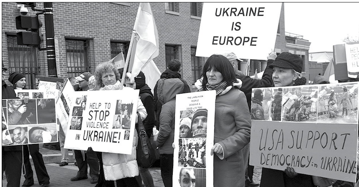
Акція протесту біля Посольства України.