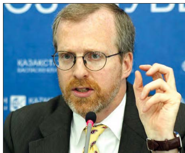
Дейвід Креймер.