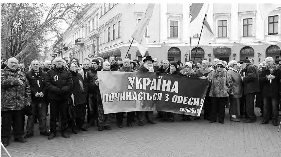
Учасники віча біля пам'ятника Дюкові Рішельє.