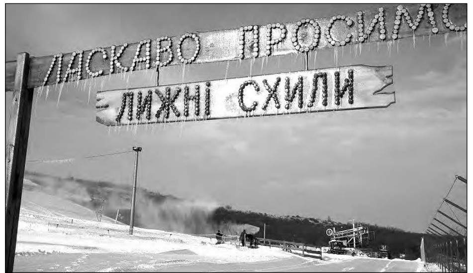
Вхід до гірсько-лещетарського курорту