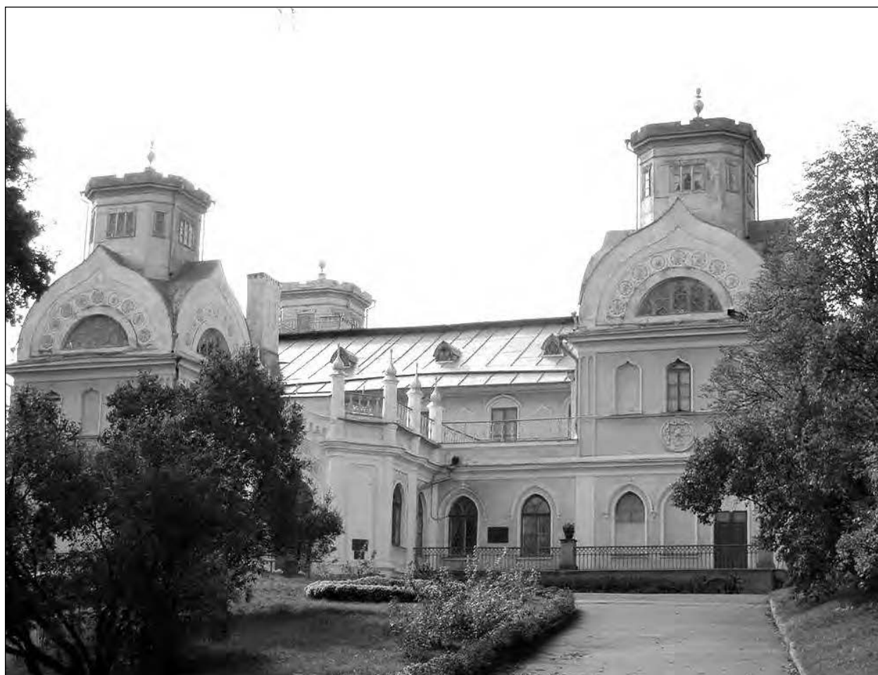
Палац в Корсуні-Шевченківському.

Нового імпульсу розвитку міста надав польський Князь Станіслав Понятовський, племінник останнього польського Короля Станіслава-Августа, який доклав чимало зусиль для відбудови Корсуня, звільнив селян від кріпос-