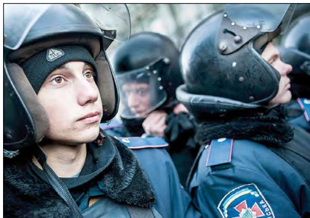
Уряд шле проти Майдану учнів військових шкіл.