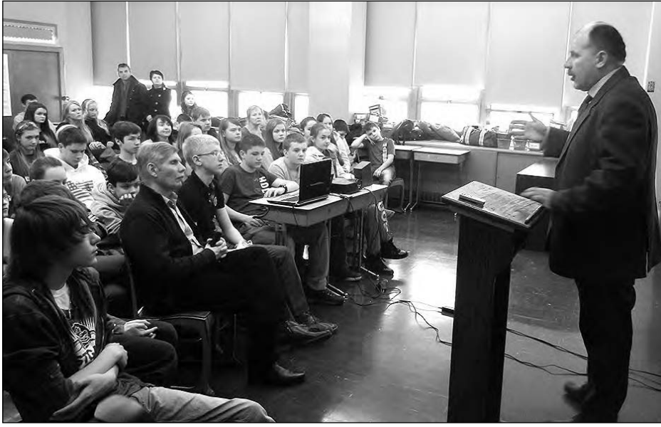
Народний депутат України Олег Медуніця розповідає учням старших класів про сучасні події Майдану.