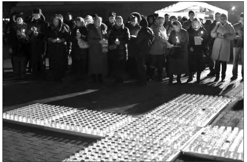
Панахида на Соборній площі в Одесі.

Активістки центру постійно приходять на допомогу дівчатам і жінкам у важких життєвих ситуаціях, в разі незапланованої вагітності.