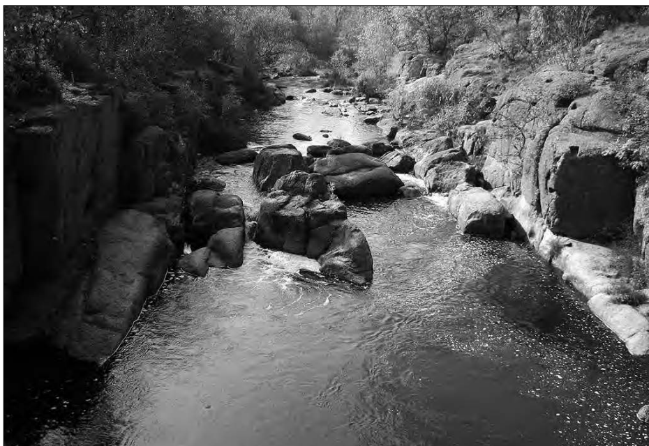
Іноколи Рось можна перейти, перестрибуючи з каменя на камінь.