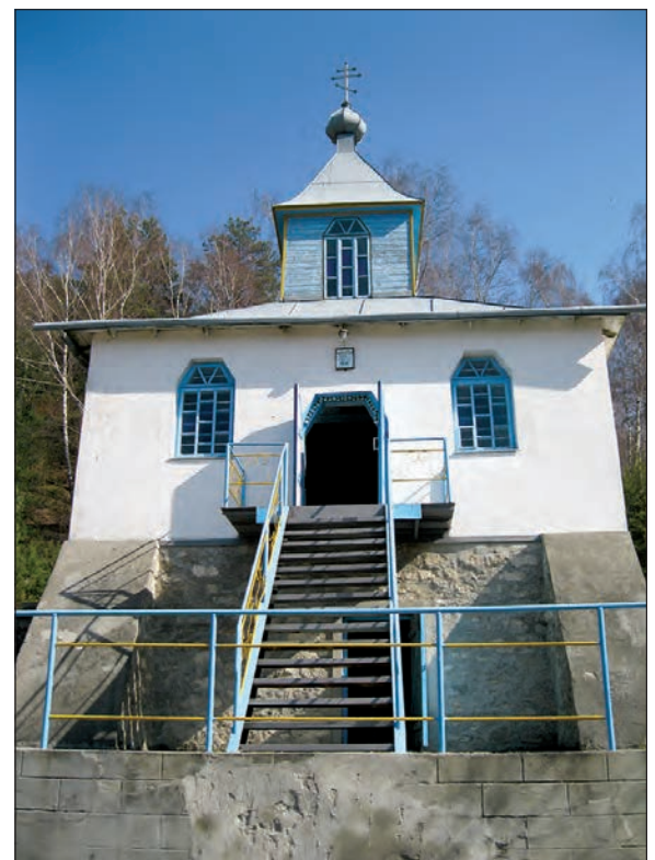
Богданова церква в Підлісцях.