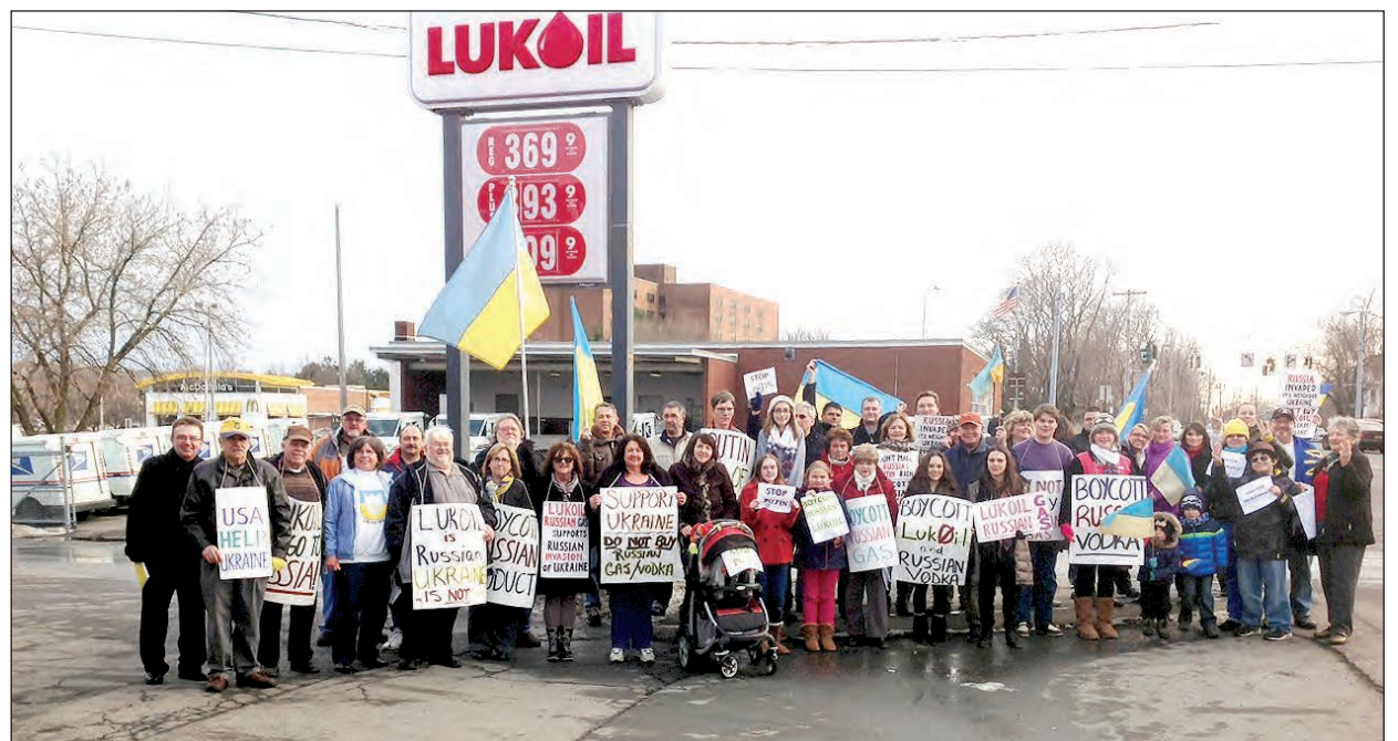
Пікетування бензостанції компанії „Лукойл“ у Вотерфліті, Нью-Йорк.

Протестанти обрали саме цю бензостанцію з чотрьох таких у регіоні, тому що поблизу живе найбільше українців.