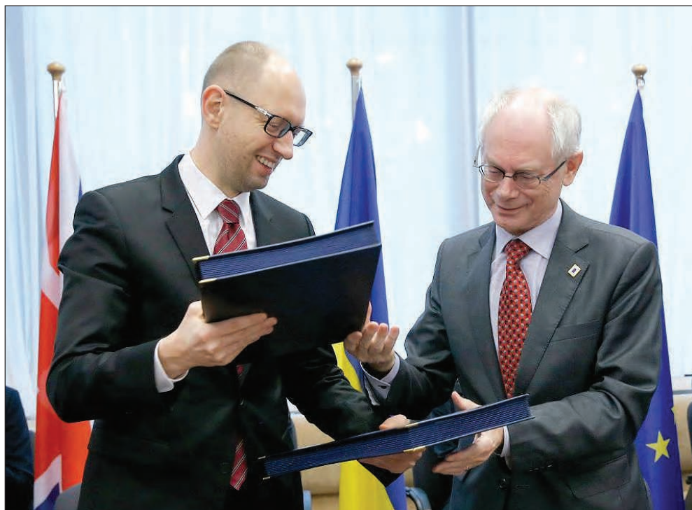
Прем'єр-міністр України Арсеній Яценюк (зліва) і Голова Європейської Ради Герман ван Ромпей.