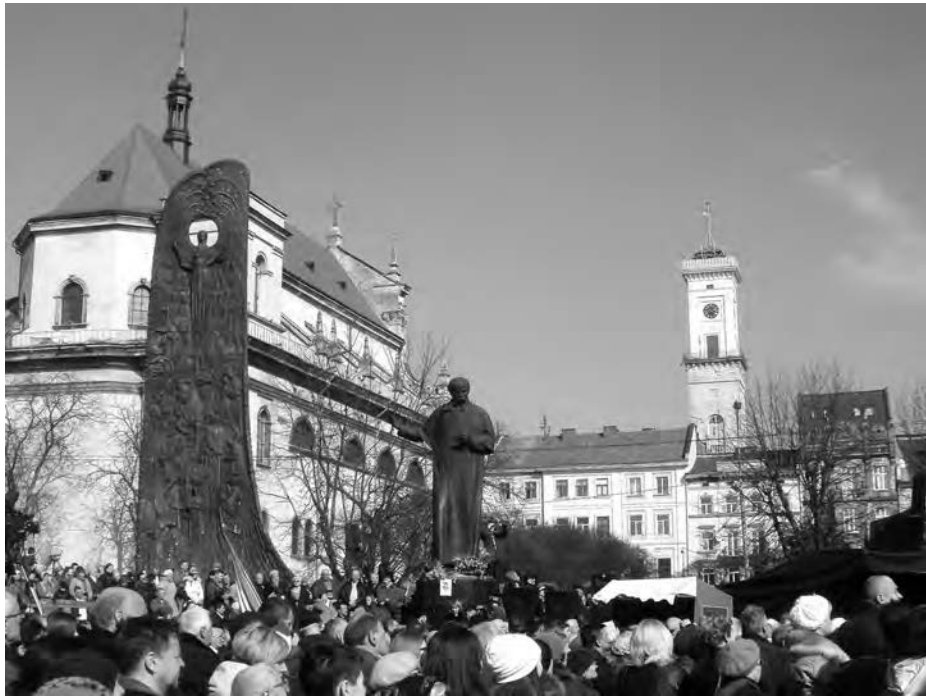
Свято біля пам'ятника Тарасові Шевченкові у Львові.

У Національному академічному театрі опери та балету ім. Соломії Крушельницької відбулася урочиста академія з нагоди відзначення 200-річчя від дня народження Т. Шевченка.