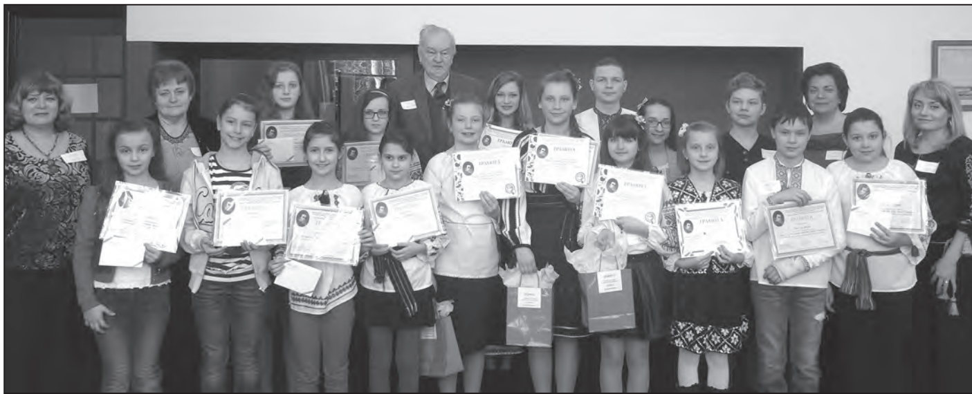
Учасники та члени журі конкурсу „Світе тихий, краю милий, моя Україно“.

Усіх учасників конкурсу було нагороджено дипломами та нагородами, що їх надало Релігійне Товариство українців-католиків „Свята Софія“, а головний спонзор конкурсу, Українська Федеральна Кредитова Кооператива „Самопоміч“ уфундувала цінні призи лавреатам та переможцям.