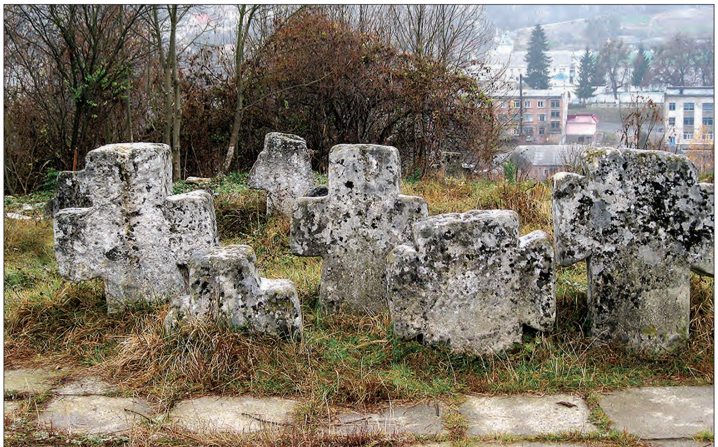
Козацькі могили на П'ятницькому цвинтарі.

Кам'яні хрести, надмогильні плити-бандури, хрест-плита на могилах полеглих героїв-козаків є не лише