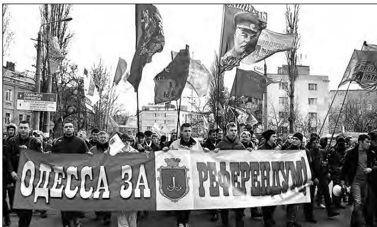
На вічу одеських сепаратистів.

Представниками об'єднання „Стоп, Майдан“ проводять акції під гаслом: „Одеса – російське місто“. Під час сутичок з майданівцями вже було поранено кілька осіб, постраждали і журналісти. Для боротьби з „націоналістичними радикалами з західної України“ сепаратисти