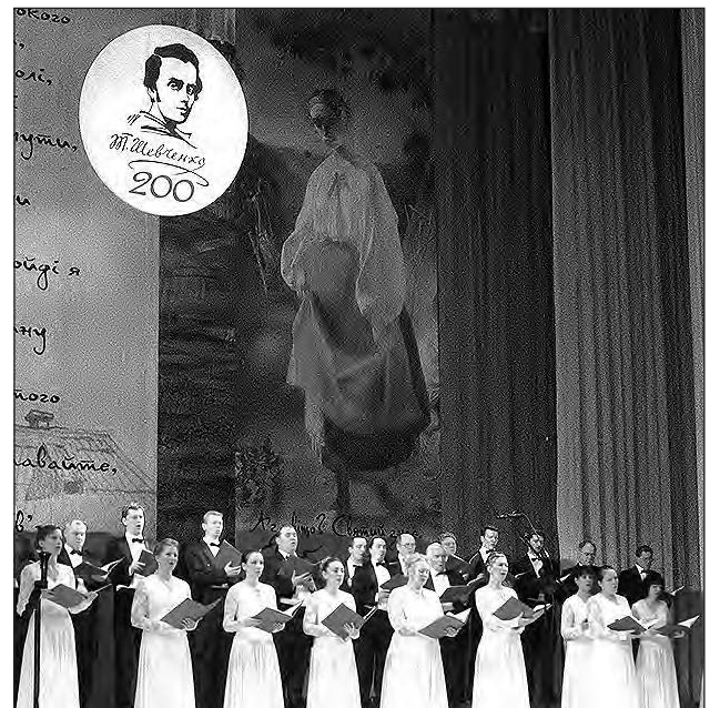
Під час концерту в Дніпропетровському театрі опери і балету.

Віче у центрі міста організували проросійські сили („Русській мір“ та інші) на підтримку агресії Росії проти України. Вони готові були накинутися на будь-кого, хто мав якусь українську ознаку – прапорець чи стрічку.