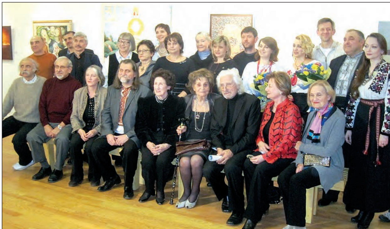
Учасники виставки 9 березня до 200-ліття від дня народження Тараса Шевченка.

9 березня в галерії КУМФ відбулася виставка, присвячена 200-літтю від дня народження Тараса Шевченка. Чи це буде остання виставка в галерії КУМФ?