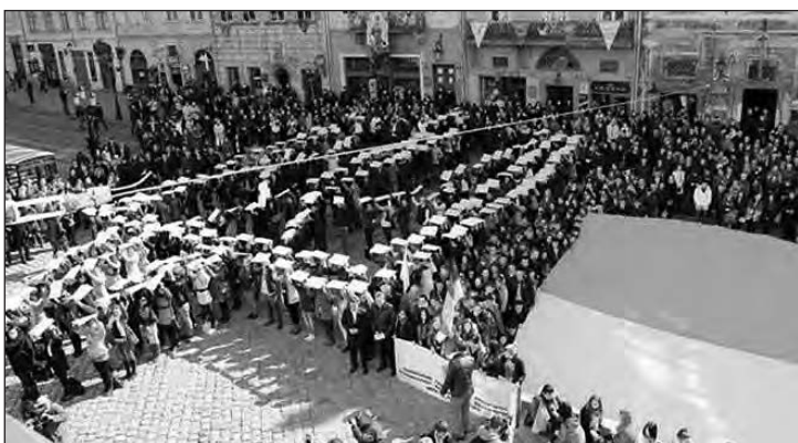
Тризуб і прапор на головній площі Львова.

Студенти принесли також найбільший у Львові прапор завдовжки 20 метрів та розгорнули його на площі.