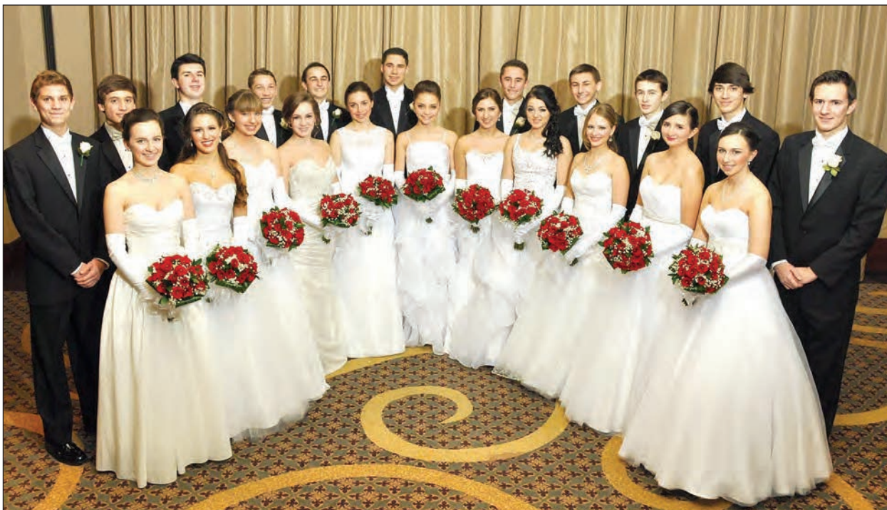
Дебютантки з ескортами під час балю у Філядельфії.

Управа Відділу рішила передати 2,000 дол. з доходів балю для родин загиблих героїв Євромайдану.