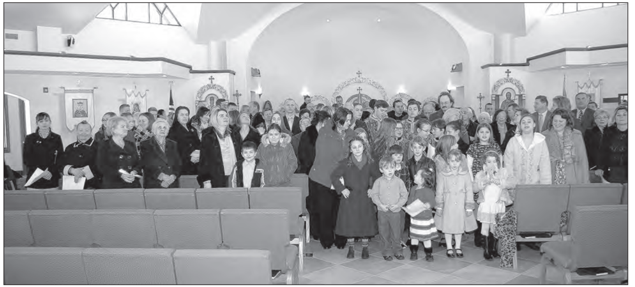
Парафіяни Української католицької церкви св. Івана Хрестителя у Випані, Нью-Джерсі, зібралися щоби відспівати „Заповіт“ під час всесвітнього читання „Кобзаря“.

Окрім „Заповіту“, співали пісень, читали поезію та прозу Тараса Шевченка, обговорювали події в Україні. До акції долучилися в Україні у Севастополі, Донецьку, Кривому Розі, Тернополі, містах та селах Галичини. Організатори вважають, що в акції взяли участь понад 4,000 осіб.