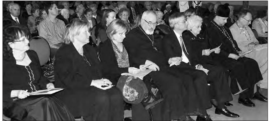
Під час концерту в Домі української молоді.