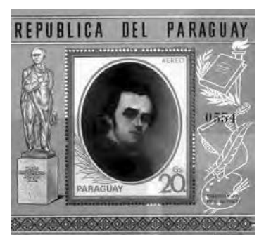
Тарас Шевченко на марках випущених в різних країнах.