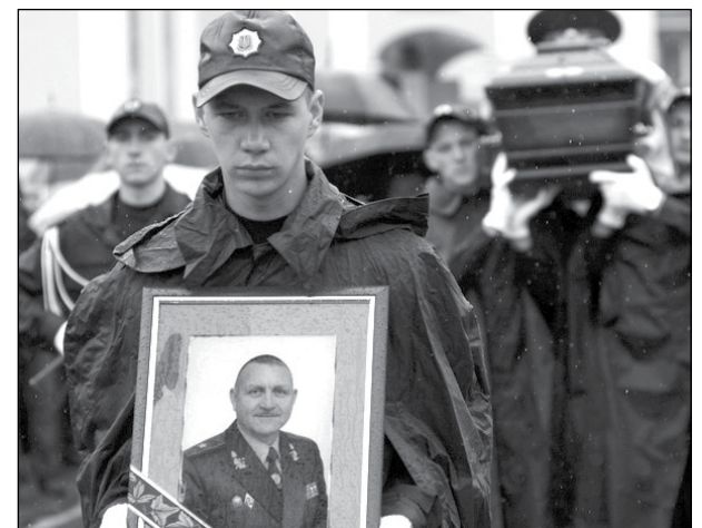
Похорон генерала Сергія Кульчицького у Львові.

Так, загинув він далеко від родинного гнізда своїх предків – на Донбасі. Але мимоволі напрошується паралель. Як його далекий предок оборонив Відень від турецьких військ, так і генерал С. Кульчицький обороняв під Слов'янськом Україну, зрештою, і Європу, від новітньої „східної орди“. І під Віднем у 1683 році, як і зараз під Слов'янськом, відбувається не просто битва. Це, за великим рахунком, війна цивілізації. Цивілізації європейської і цивілізації азійської. На жаль, у цій війні генерал С. Кульчицький загинув. Але пам'ять про нього буде збережена.