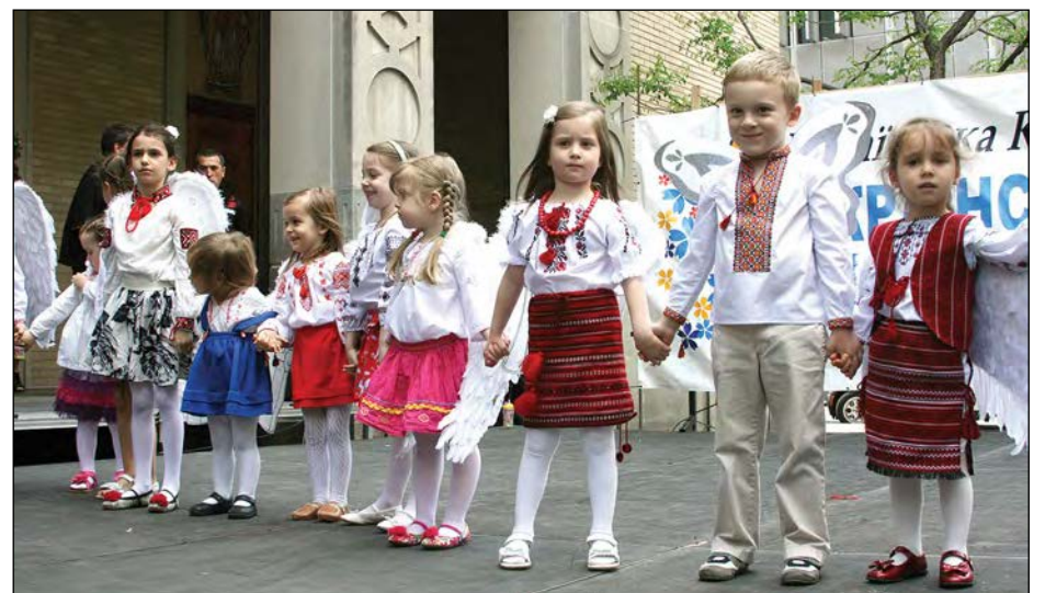
Гурт „Ангелики“ з Школи св. Трійці.