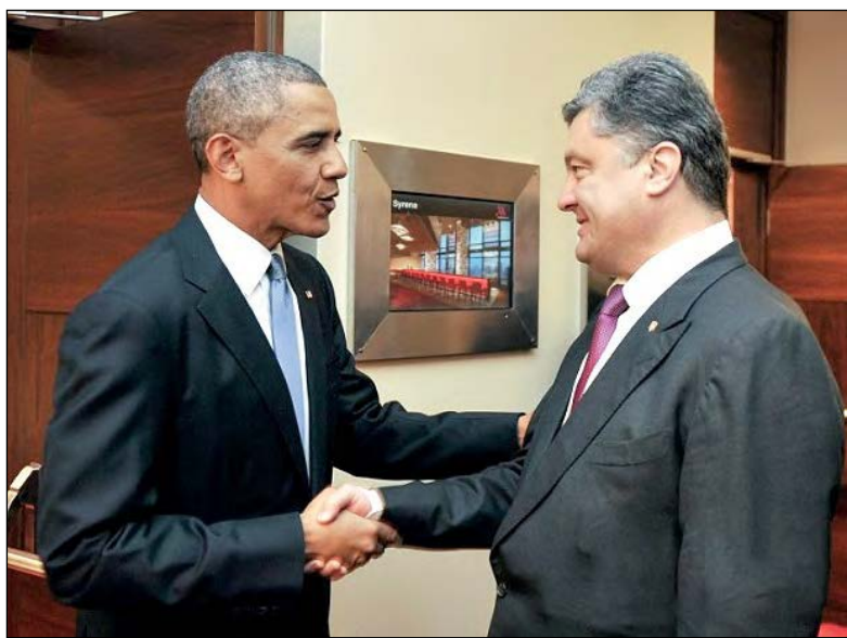
Президенти Барак Обама і Петро Порошенко зустрілися у Варшаві.

Президент США назвав обрання П. Порошенка Прези-