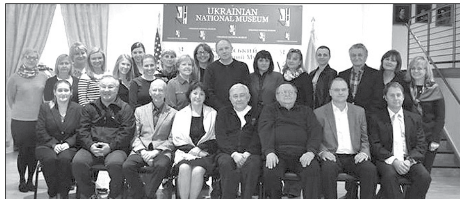
Новий склад дирекції та управи Українського Національного Музею в Чикаго.