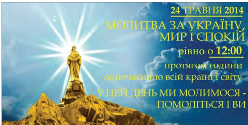
Плякат з статуєю Матері Божої на вершині гори Хом'як.

Українці молилися у храмах Брюсселя, Лондона, Куритиби, Парижа, Варшави, Любліна, Зеленої Гори, Нью-Йорку та інших міст світу.