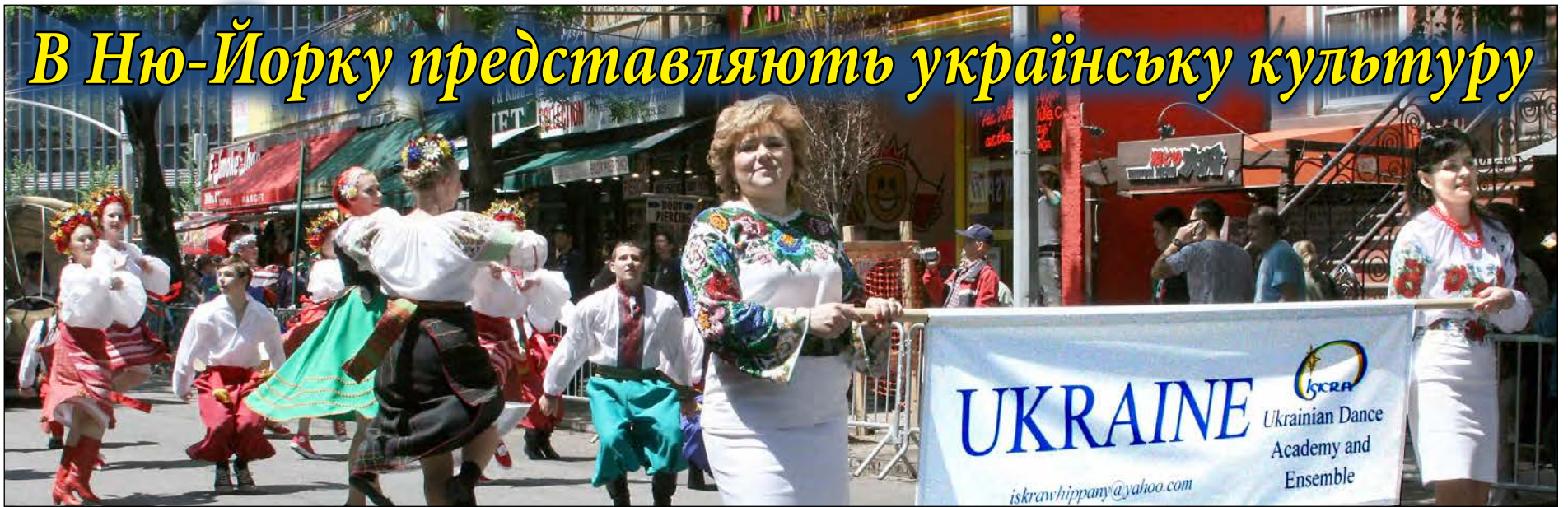
Першою на параді танцю в Нью-Йорку, котра відбулася в день Українського фестивалю, йшла Школа українського танцю „Іскра“.