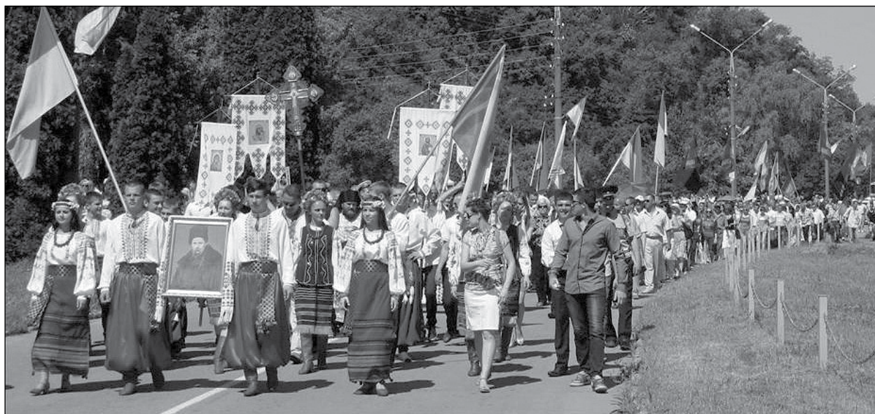
Урочиста хода до Тараса Шевченка.