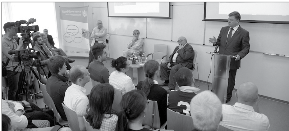
Петро Порошенко промовляє у Львівській бізнес-школі.

Проректор УКУ Мирослав Маринович, звертаючись до П. Порошенка, зазначив: „Після 25 травня в Україні дуже голосно заскриплять гальма, буде багато сил, осередків, які будуть намагатися стримати хід, якого ми очікуємо. Тоді постане питання: як робити так, щоб Україна не розкололася? Мені хотілося б, щоб Україна разом з вами почала рухатися вперед з опорою на людей“.