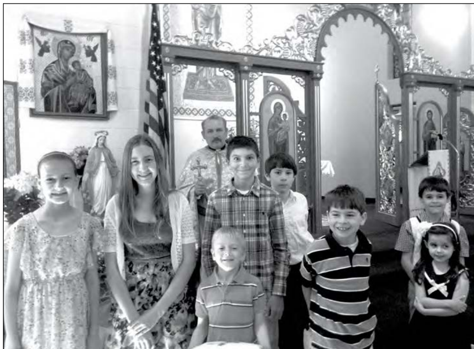
ГІЛСАЙД, Нью-Джерзі. – 11 травня громада Української католицької церкви Непорочного Зачаття провела вінчання та процесію на честь Пречистої Диви Марії. Отець Василь Владика благословив дітей від трьох до 18 років, які брали участь у вшануванні Божої Матері та за участь у релігійному навчанні. (Джо Шатинський)