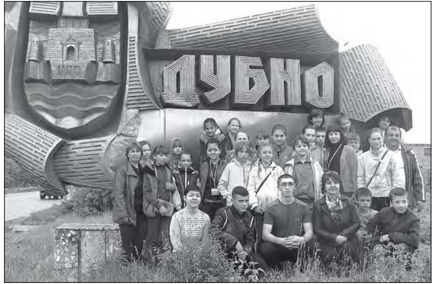
Гості з Дніпропетровщини поріднилися з Дубном.

Відвідини тривали 11-14 травня. На прибутих, котрі розмістилися в мешканців села Івання, чекала насичена програма – знайомство з містом Дубно, краєзнавчі екскурсії, відвідування Козацького редуту, проведення квесту „Козацькі забави“. А на прохання гостей – ще й екскурсія