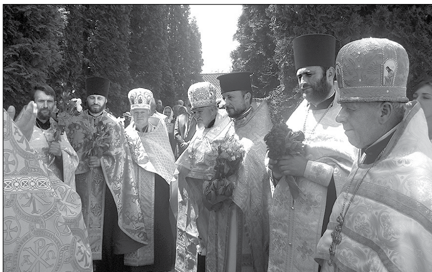
Священники Волині вітають гостей Пересопниці зі святом.

Учасники свята ознайомилися з експозицією музею „Пересопницького Євангелія”, з виставкою книг з серії „Бібліотечка Літературного музею Уласа Самчука в Рівному”, більшість яких видано в Україні вперше.