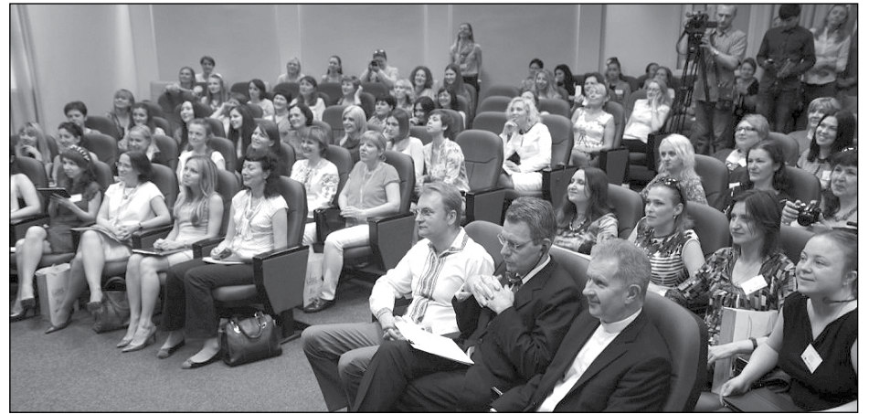
На Форумі жіночого підприємництва.

ЛьВІВ. – Понад 100 жінок з усієї України взяли участь у третьому Форумі жіночого підприємництва „Українки в бізнесі: власна справа – розвиток та успіх“, який відбувся 22-23 травня у бізнес-школі Українського Католицького Університету (УКУ). Для учасниць форуму було проведено 12 практичних сесій з найкращими експертами з фінансів, права, маркетингу, комунікації, а також серію зустрічей з успішними жінками-підприємцями.