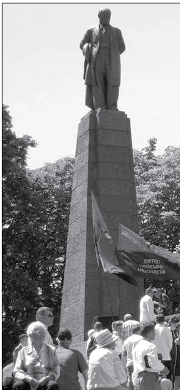
На могилі Тараса Шевченка в Каневі.

Вершиною вшанування на Чернечій горі став виступ зведеного хору, який об'єднав найкращі хори України. Диригував Герой України, академік Анатолій Авдієвський. Потім свято перейшло до Дніпра, до сцени, з якої співала Народна артистка України Ніна Матвієнко, інші українські виконавці.