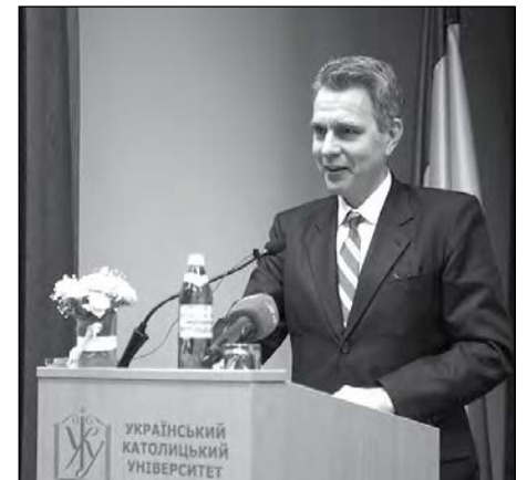
Промовляє Посол США в Україні Джефрі Паєт.

Організувала форум Львівська бізнес-школа УКУ у партнерстві з Українським жіночим фондом, агентством „Ведіс“, соціальною мережею „Українки в бізнесі“ та куратором програми „Invest for the Future“ в Україні М. Котвицькою. Подія пройшла за підтримки Посольства США в Україні.