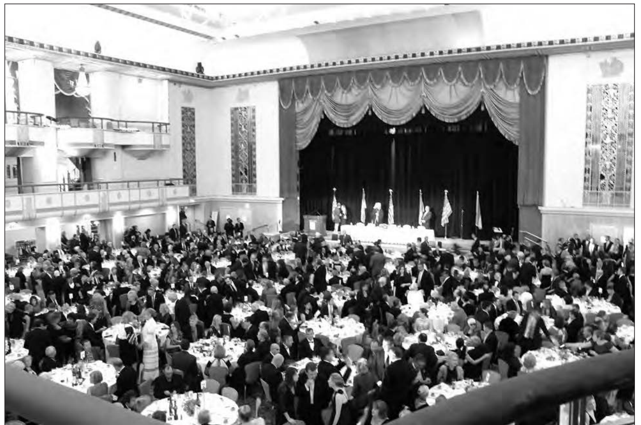
Під час бенкету на честь Прем'єр-міністра України Арсенія Яценюка.