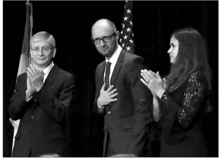
На бенкеті зліва: Євген Чолій, Арсеній Яценюк, Тамара Олексій.

У промові А. Яценюк висловив вдячність за підтримку України українською громадою США і наголосив, що український уряд цінує підтримку Адміністрації США, персонально Президента США Барака Обами і Конгресу Сполучених Штатів. „Україна постала перед великими викликами, але з іншого боку – і можливостями, – сказав він. – Ми