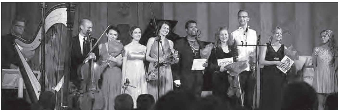
Учасники концерту у Стокгольмі.