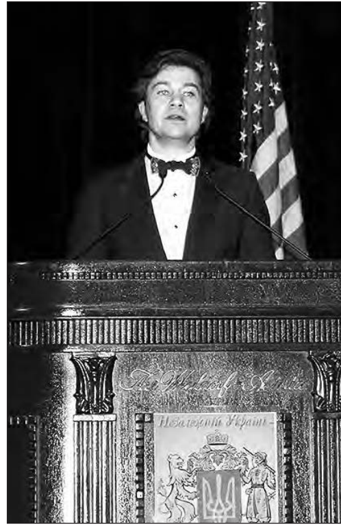
Виступає Міністер культури Євген Нищук.