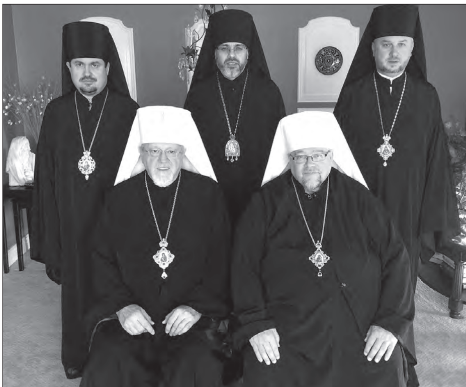
Зліва (сидять): Митрополит Антоній і Митрополит Юрій, (стоять) Єпископ Іларіон, Єпископ Даниїл і Єпископ Андрій.

Єрархи звернулися з пастирським посланням до духовенства та вірних Української Православної Церкви у всьому світі з закликом молитися за припинення військового конфлікту в Україні та агресії Російської Федерації проти української нації. Хоча війну на сході України Москва називають