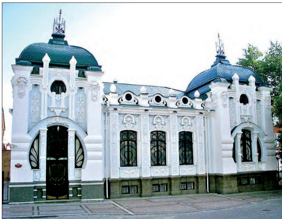
Кіровоградський обласний краєзнавчий музей в будинку Олександра Барського.

Ще одна зала присвячена царсько-імперському періоду історії краю. На жаль, тут немає про появу українофільських гуртків у місті, зародження „Просвіти“, формування професійних товариств.