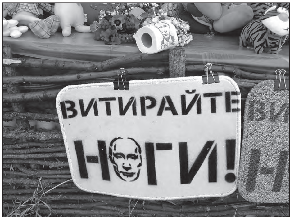
Товари, що викликали посмішку на ярмарку в Сорочинцях.

Ярмаркуючи два дні у Сорочинцях, збираючи зразки мовних й пісенних багатств, я познайомився з цікавими людьми, записав не один зошит пісенних текстів, легенд і народних переказів.