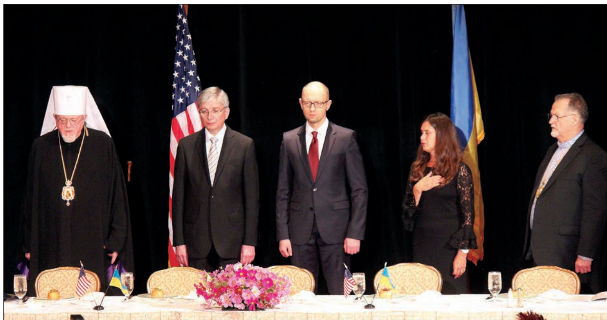
Під час відкриття бенкету зліва: Митрополит Антоній, Євген Чолій, Арсеній Яценюк, Тамара Олексій, Митрополит Стефан Сорока.

НЬЮ-ЙОРК. – 24-25 вересня в рамках робочої візити до США Прем'єр-міністр України Арсеній Яценюк разом з делегацією України взяв участь у праці 69-ої сесії Генеральної Асамблеї ООН.