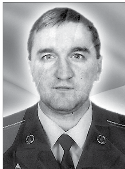
Герой України полковник Ігор Гордійчук.

І. Гордійчук продовжував корегувати вогонь телефоном, був неодноразово контужений, позицій не покинув. 18 серпня була запланована ротація захисників Савур-могили, операцією керував полковник Петро Потехін, який повів на Савур-могили вісім вояків 25-ої повітряно-десантної бригади та 17 добровольців-розвідників 42-го батальйону територіальної оборони. До них приєдналася група артилерійських корегувальників, дві бронемашини.