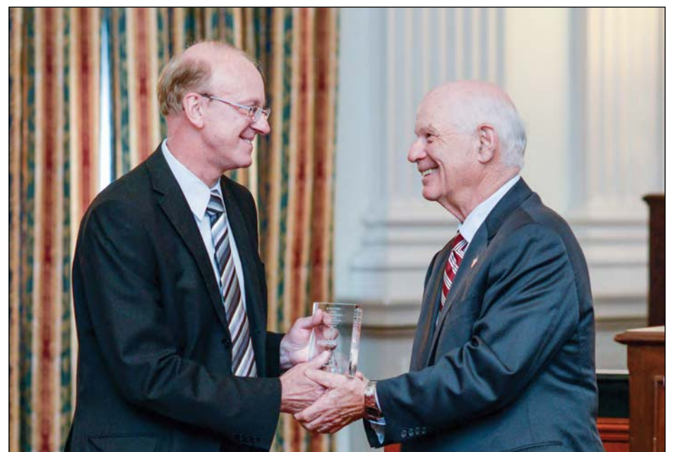
Орест Дейчаківський і Сенатор Бен Кардін.