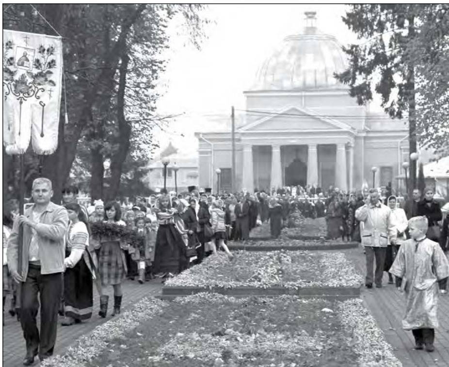
Хресна хода від Свято-Покровської церкви до колони Божої Матері в центрі Млинова.