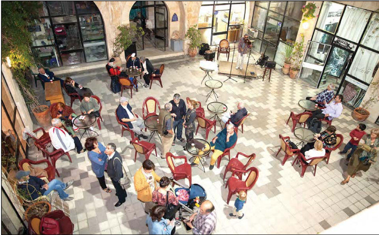
Вернісаж у єрусалимській галерії.