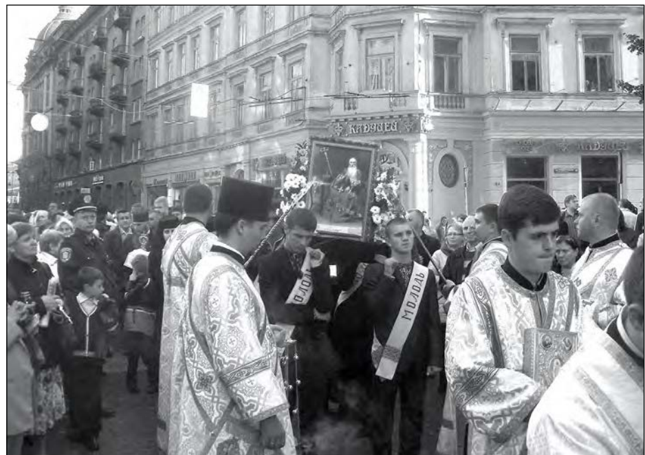
Молитовна хода у Львові.

Закінчилася хода, котра тривала три години, на площі біля собору св. Юра.