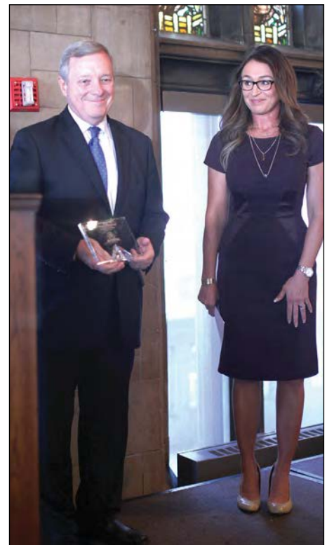
Сенатор Річард Дурбін і Наталі Мартінез, журналістка з „NBC News”.

За активну підтримку України нагороди були вручені трьом співголовам Комітету з питань України Конгресу США – Марсі Каптур, Сандерові Левінові та Джимові Герлакові. Від Гельсінкської Комісії США нагороду отримав голова