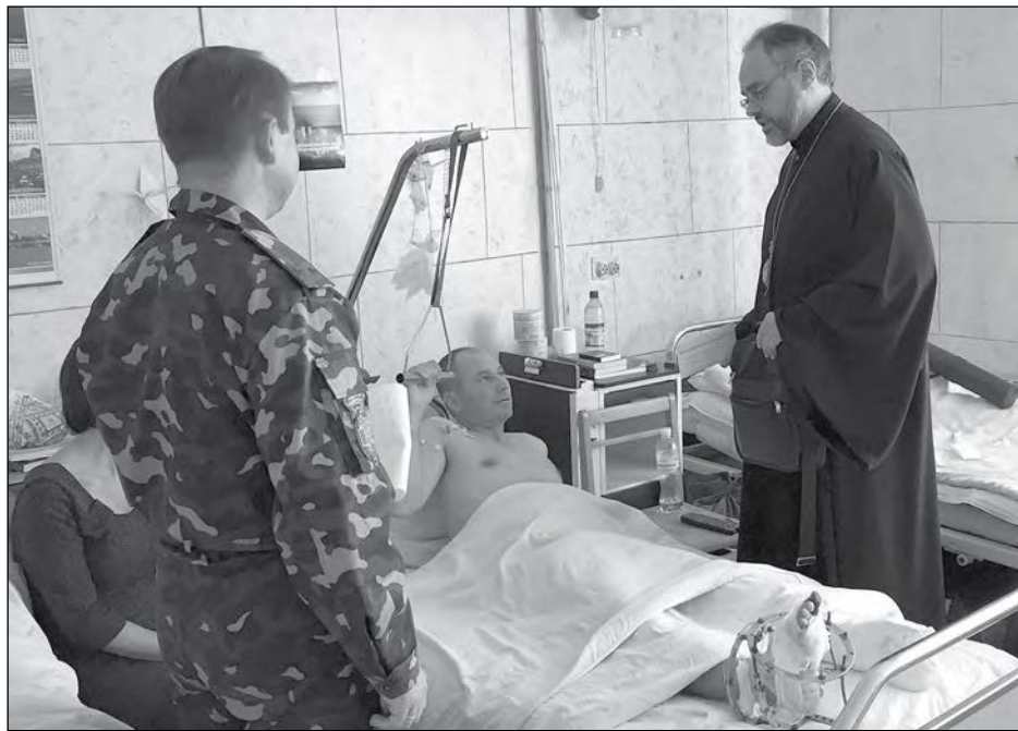
Владика Даниїл передає фінансову допомогу від УПЦ США пораненим воякам.

САВТ - БАВНД - БРУК, Нью-Джерзі. – Виконуючи доручення вірних Української Православної Церкви США, які відгукнулися на звернення Собору єпископів, Консисторія передала додаткові 20 тис. дол. до Військово-медичного клінічного центру Західного регіону у Львові.