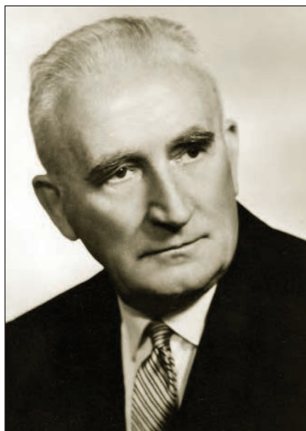
Андрій Мельник (1890-1964).

Полковникові А. Мельникові, за словами доповідача, довелося бути активним учасником найдраматичніших