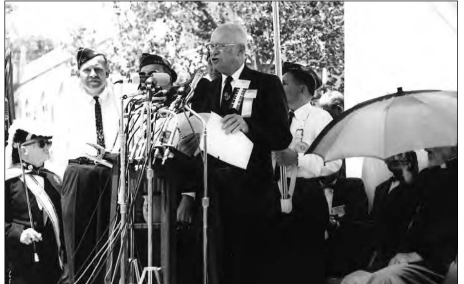
У день відкриття пам'ятника Тарасові Шевченкові у Вашингтоні промовляє Президент Двайт Айзенгавер.