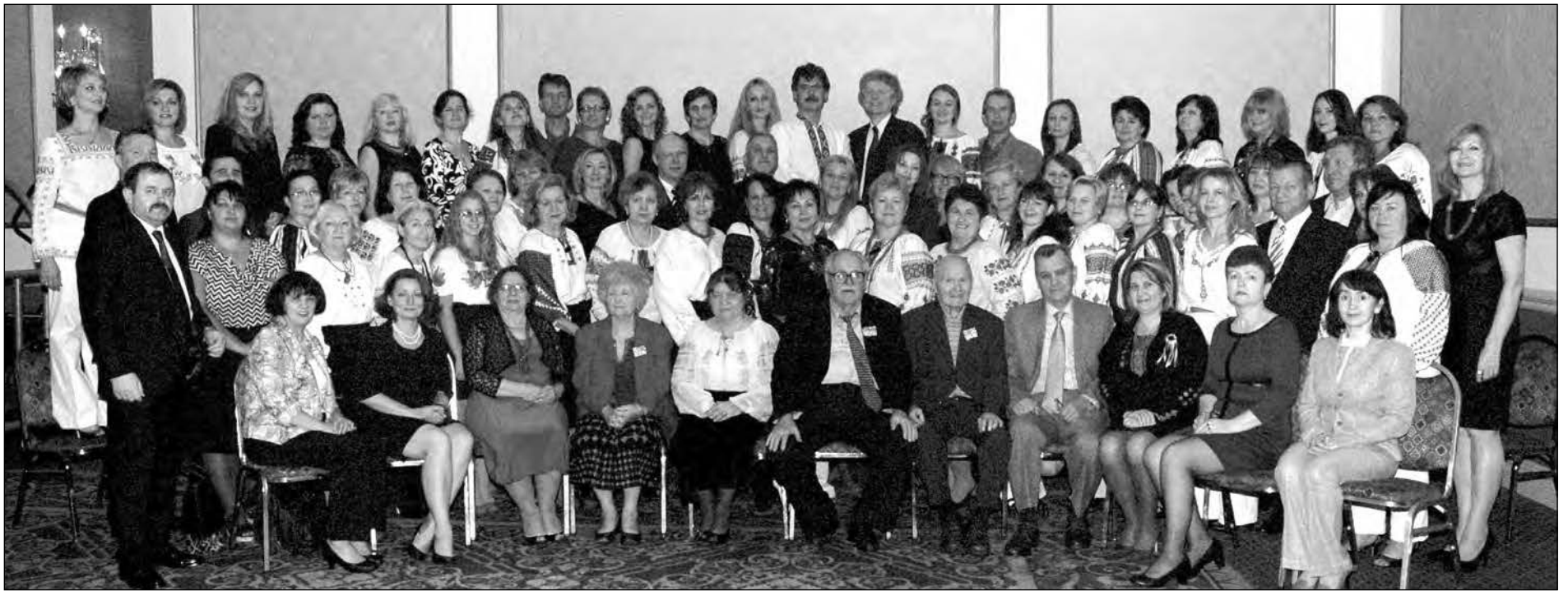
Учасники Всеукраїнської вчительської конференції шкіл українознавства.