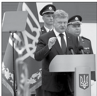
Президент Петро Порошенко звернувся до учасників бойових дій.