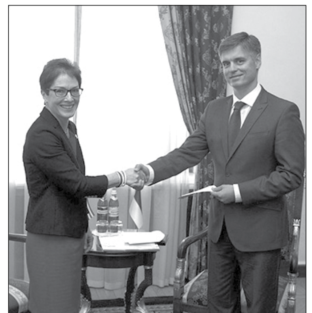
Посол США в Україні Марі Йованович вручає копії вірчих грамот заступникові міністра закордонних справ Вадимові Пристайкові.