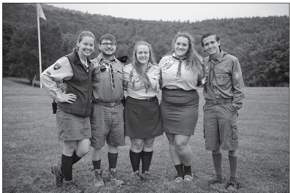
Наші коменданти.

Табір старшого юнацтва мав своє таборове закриття, а решта таборовиків ще кількох неквапливих годин мали для спілкування зі сво-