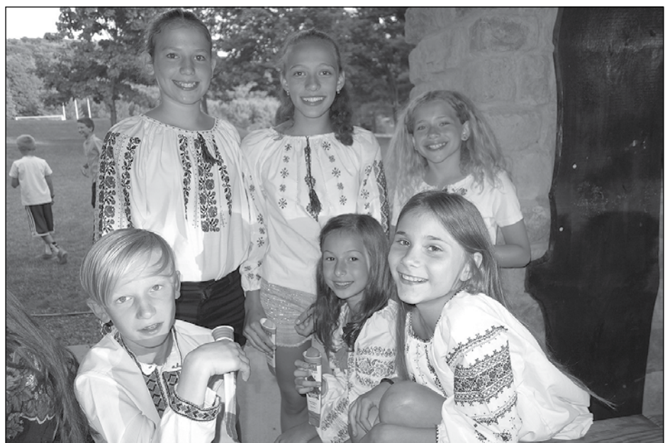
Новацтво під час свята Івана Купала.