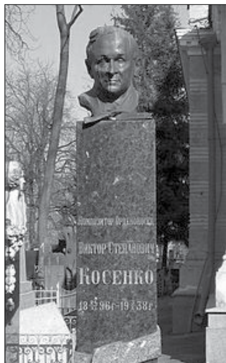
Надгробок Віктора Косенка в Києві.

Останні роки свого життя В. Косенко жив у Києві, де помер 3 жовтня 1938 року і його поховали на Байковому кладовищі (надгробний пам'ятник з граніту виконав скульптор Леонід Шервуд). В пошану В. Косенка, з нагоди його 100-річчя видано поштову марку. З 2001 року Національна спілка композиторів України та Міністерство культури і туризму заснували нагороду ім. В. Косенка, яка щорічно вручається композиторам за видатні досягнення в галузі музичної творчості для дітей та юнацтва. Також засновано музей в Києві.