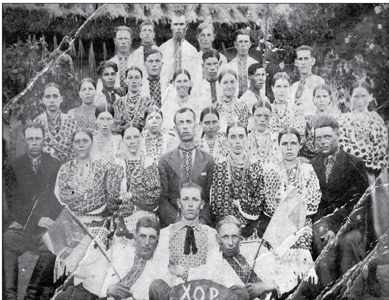
Хор при „Рідній школі“ в селі Вільці Вербицькі.

Село Вілька Вербицька, де жили мої батьки і дідусі, налічувало майже 100 господарств і 450 мешканців. Вілька була присілком села Вербиці, що належало до Рава-Руського повіту. Село – це частка нашої батьківщини, в якій зосереджений дуже глибокий і багатогранний зміст. У кож-