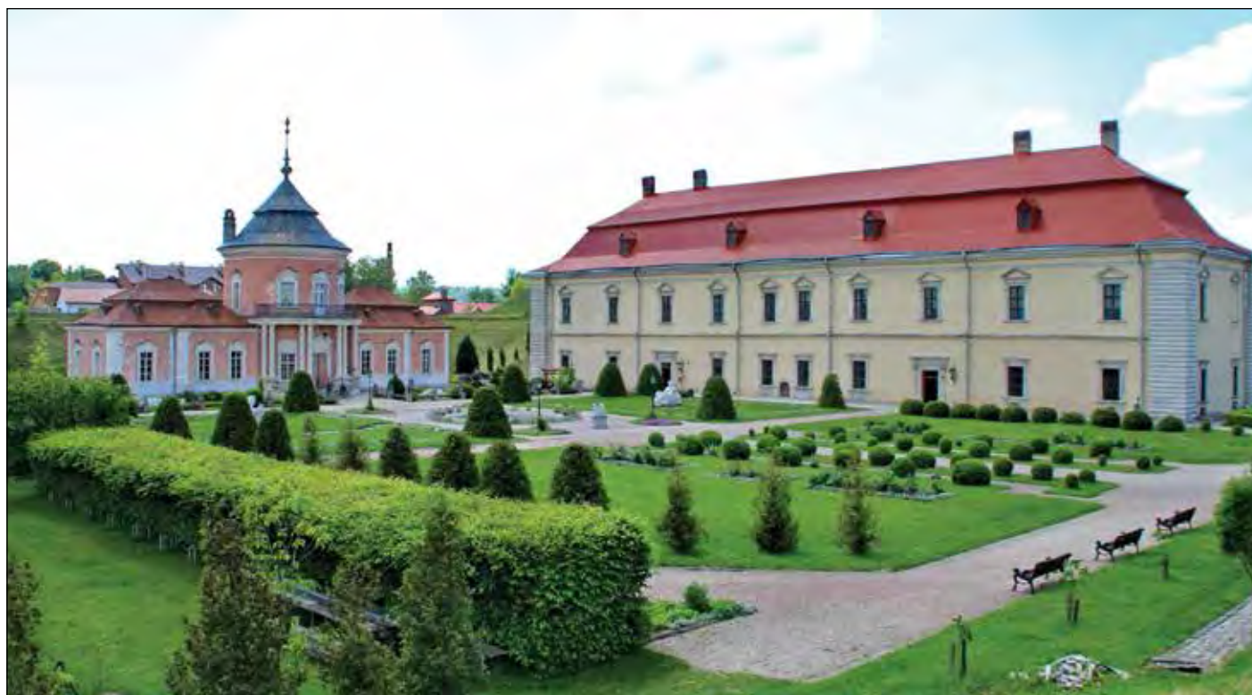
Внутрішній двір Золочівського замку.