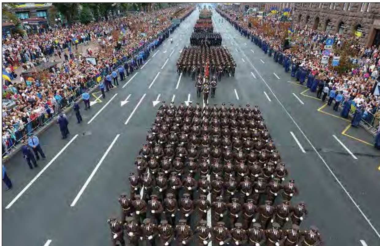
Хрещатику пройшли маршем курсанти академії.