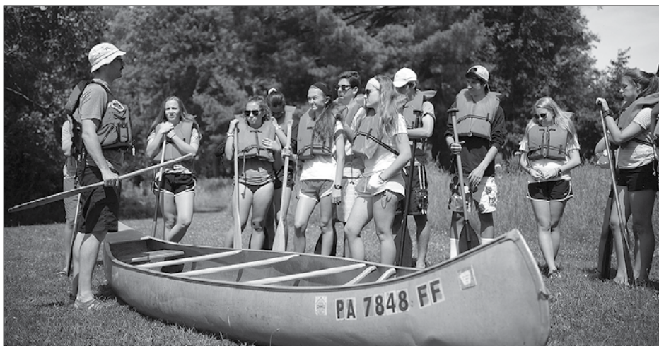
Старше юнацтво готується до прогульки на каяках на Lake George