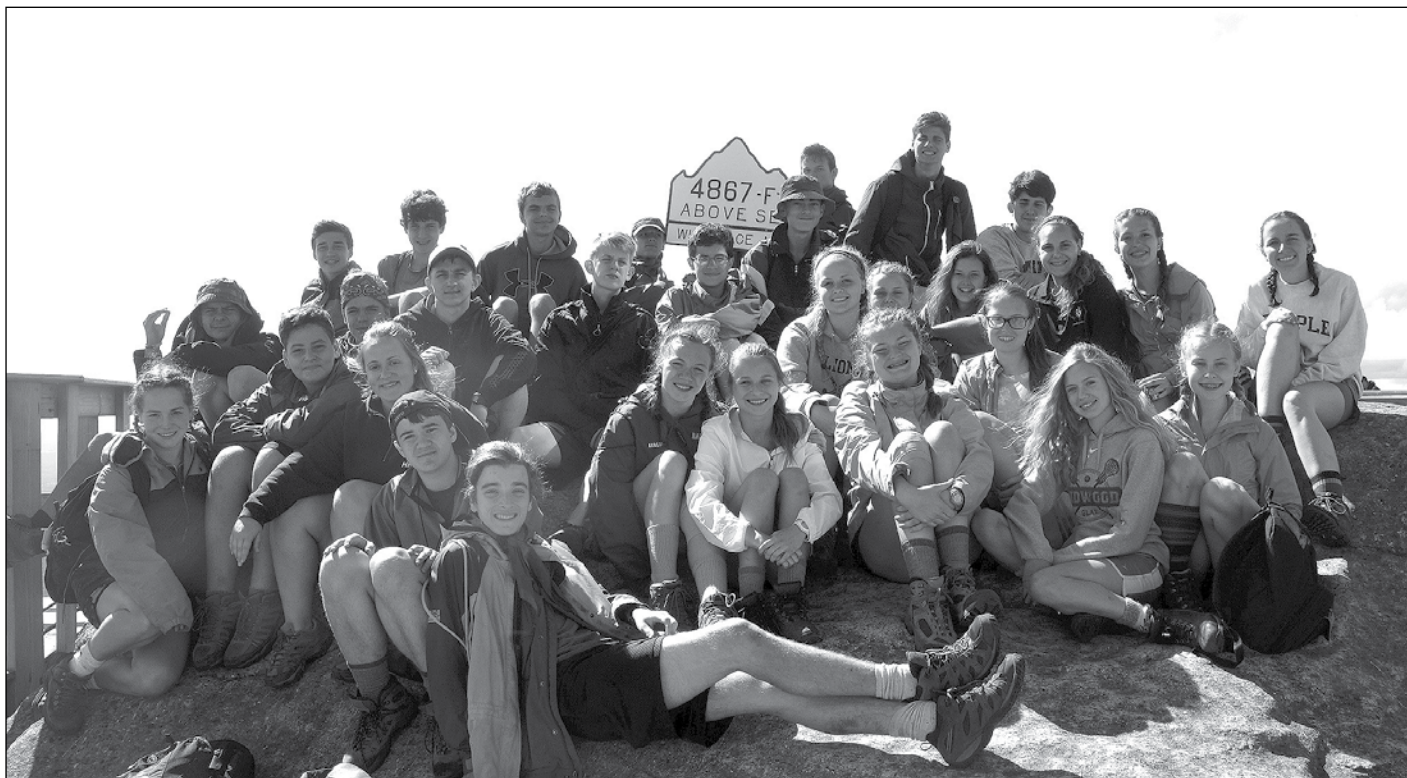
Юнацтво на прогулянці до Whiteface Mountain.

їми родинами. В кінці дня всі учасники, попрощавшись з рідними і близькими, повернулися до своїх таборів і з нетерпінням очікували на „найкращий тиждень“.