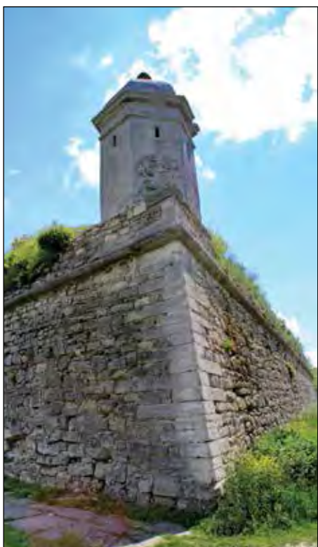
Одна з веж замку.