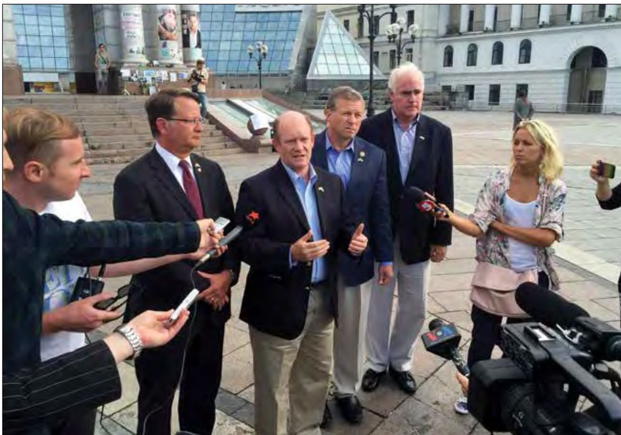
Під час візити до Києва (зліва): Сенатори Гері Пітерс і Крістофер Кунс та Конгресмени Чарлі Дент та Пет Мієн.

БЕОГРАД. — Міністерство закордонних справ Сербії сильно запротестувало 1 серпня проти нової статуї в Хорватії самостійникові, котрий 1971 року вбив югославського посла до Швеції. Пам'ятник націоналіста Міра Баресика є в хорватському приморському містечку Драге. На його відкритті були присутні члени хорватського уряду та визначні політики. М. Баресик застрелив Посла Владіміра Роловика в югославській амбасаді в Стокгольмі й був засуджений у Швеції до довічного ув'язнення. Але 1972 року група хорватів захопила літак скандинавської авіолінії і примусили уряд звільнити М. Баресика. Він втік до Парагваю, але був зловлений і виданий Швеції у 1980 році. Його звільнено з тюрми 1991 року і він повернувся до Хорватії, де він загинув у бою з сербськими нападниками. Він вважається терористом у Сербії, але для хорватів він є героєм за свою відданість для хорватської незалежності. („RFE/RL”)