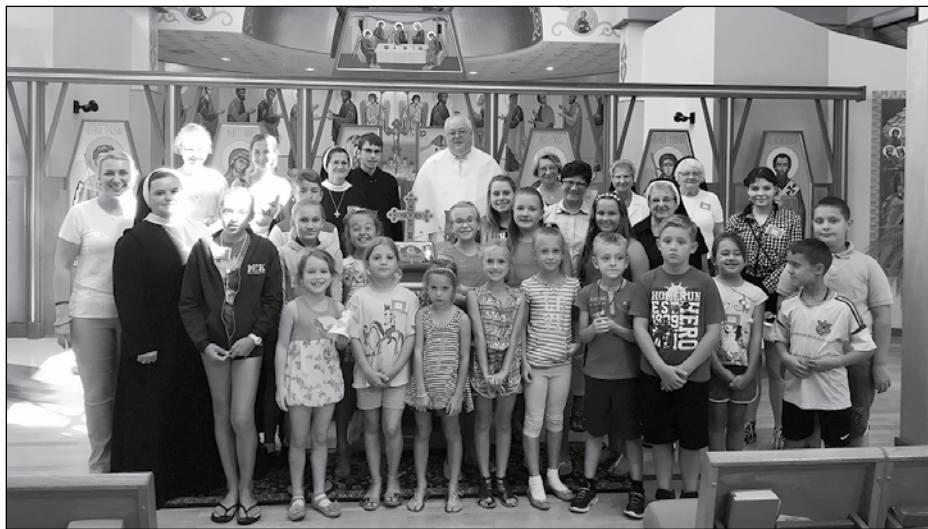
Учасники табору „Вишиванка для Ісуса“.

Програму табору було створено з метою поєднання духовної та