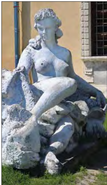
Скульптура „Біла пані” на території замку.

На території є діюча капличка, яку освятив 21 червня 2004 року Патріярх Любомир Гузар. Служби у ній відбуваються двічі у рік: на Благівіщення (храмове свято) і в роковини репресій – у першу неділю липня.