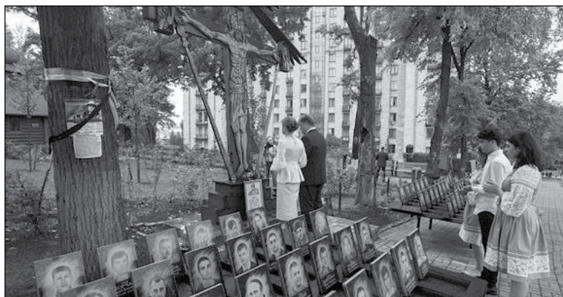
Президент з дружиною Мариною Порошенко вшанували пам'ять „Небесної сотні“.