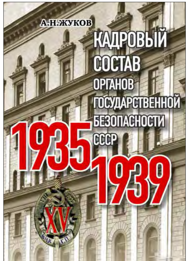
Обкладинка компакт-диска „Кадровий склад органів державної безпеки СРСР. 1935-1939“.

Диск можна отримати безкоштовно у „Меморіалі“ за адресою: Москва, вул. Каретний ряд, 5/10, Russia 101000.