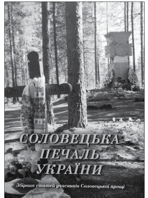
Збірник „Соловецька печаль України“.