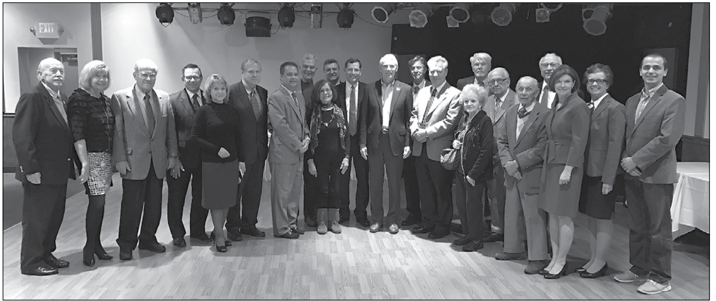
Сенатори США Роб Портман і Джон Баррасо під час зустрічі з представниками різних національностей громад Огайо.

Два сенатори визнають, що Росія витрачає понад 1 млрд. дол. на пропагандистську і дезінформаційну кампанію в США. Сенатор Р. Порт-