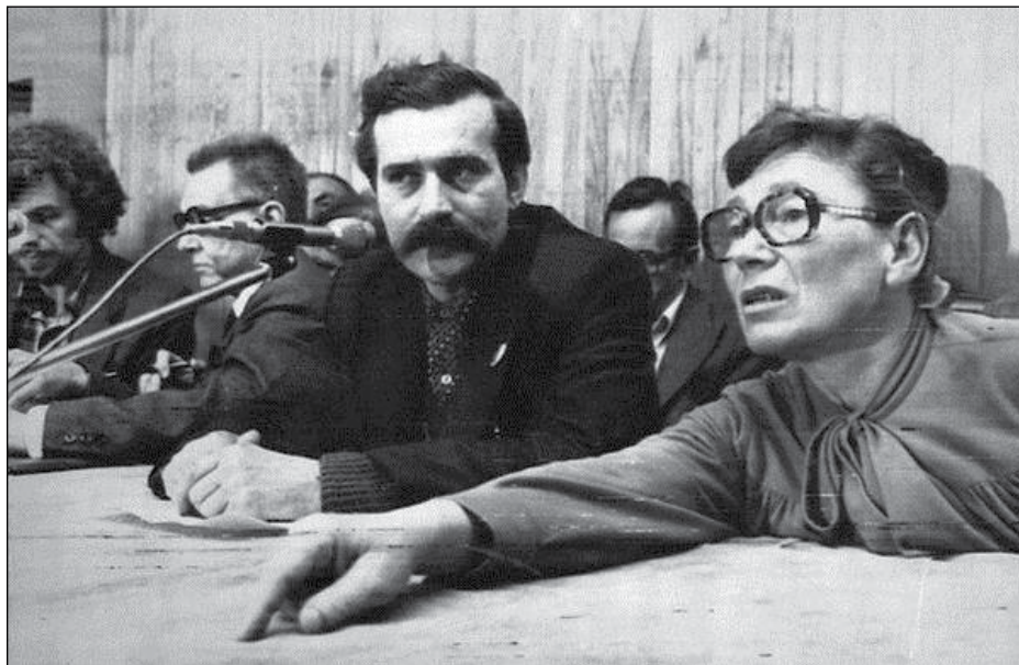
Анна Валентинович і Лех Валенса на переговорах з урядом Польщі.

тичного режиму вона все частіше виступала з гострою критикою політики правлячих партій, що походили із руху „Солідарність“, відмовилася від звання почесної громадянки Гданська, від почес-