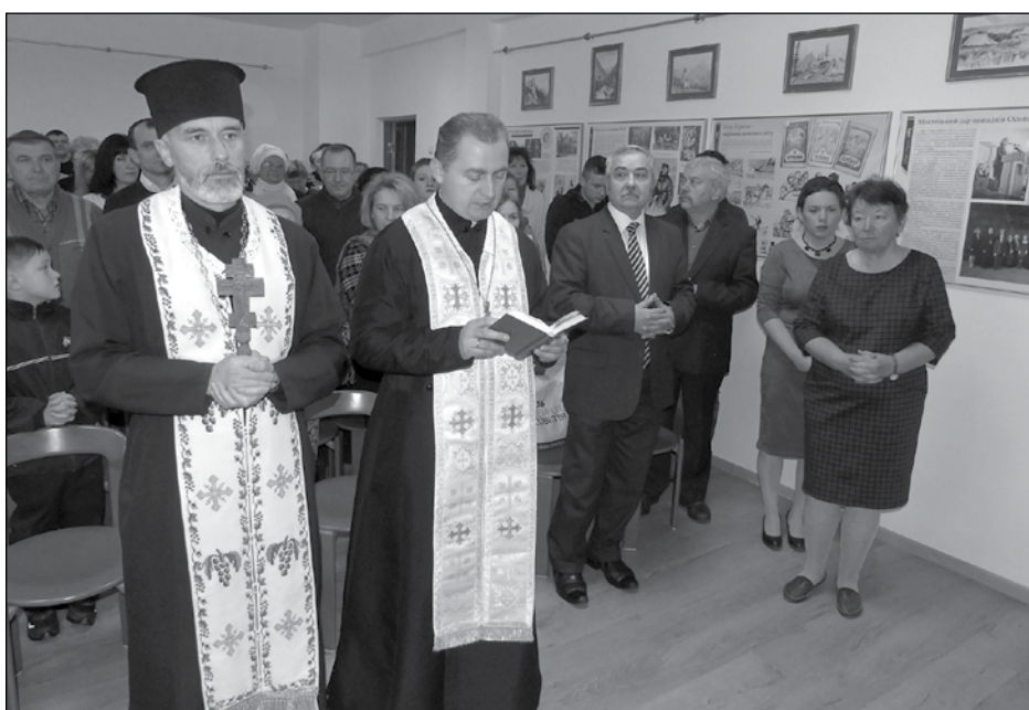
Освячення приміщення музею.