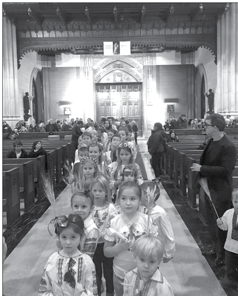
Учні взяли участь у ході в Катедрі св. Патрика.

Після навчання у школі учні взяли участь у щорічному ході в Катедрі св. Патрика перед початком соборного Молебня. Учні запалили свічки та принесли колоски пшениці, як символ пам'яті про мільйони втрачених людських життів. Присутність двох свідків Голодомору на Молебні, які пережили ті чорні голодні роки, є тим живим доказом про нашу історію, яка довго замовчувалася.