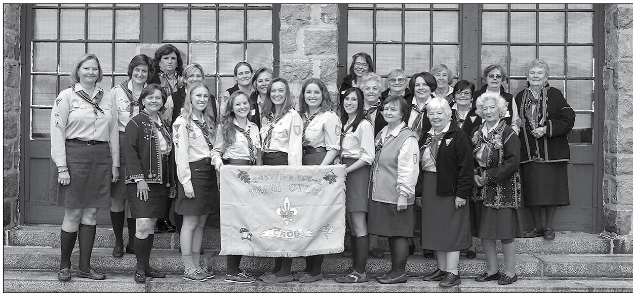
Пластунки на Великій Раді Плем'я „Перші Стежі”.

Велика Рада була насичена також приготуванням до святкування 70-ліття „Перших Стеж” та 30-ліття „Табору Пташат”, які заініціював курінь.