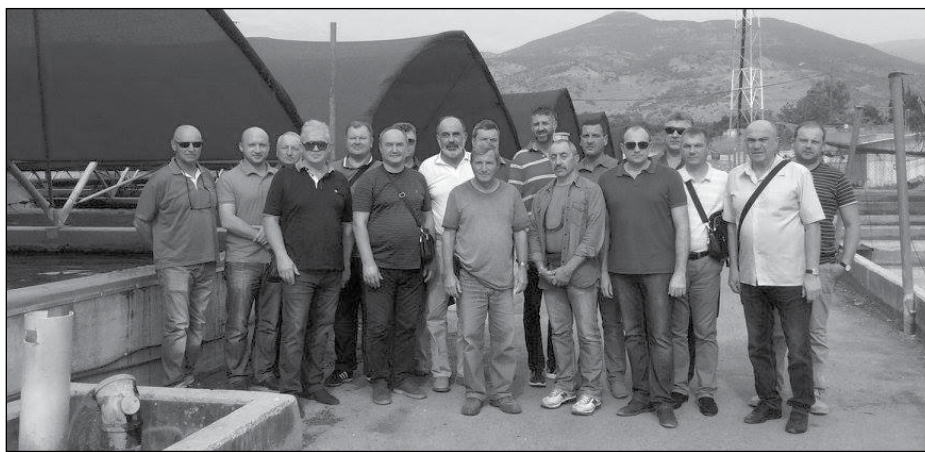
Учасники семінару в колективному господарстві „Дан“.

У семінарі також взяли участь представники Інституту експорту Ізраїля і керівники торгово-економічної місії Посольства України в Ізраїлі. Аграрії відвідали колективне господарство „Дан“, в якому ознайомилися з розведенням форелі і осетрів. 10 років тому тут почали вирощувати осетрів і добувати з них ікру. Запліднену ікру осетрів