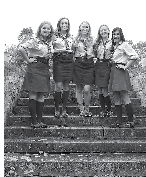
Старші пластунки на посілості Сестер Службниць в Словтсбургу, Нью-Йорк.

Під час Великої Ради присутні мали змогу купити у Сестер українські вишивки, фотографуватися в чудових околицях, співати і бавитись до пізньої ночі.