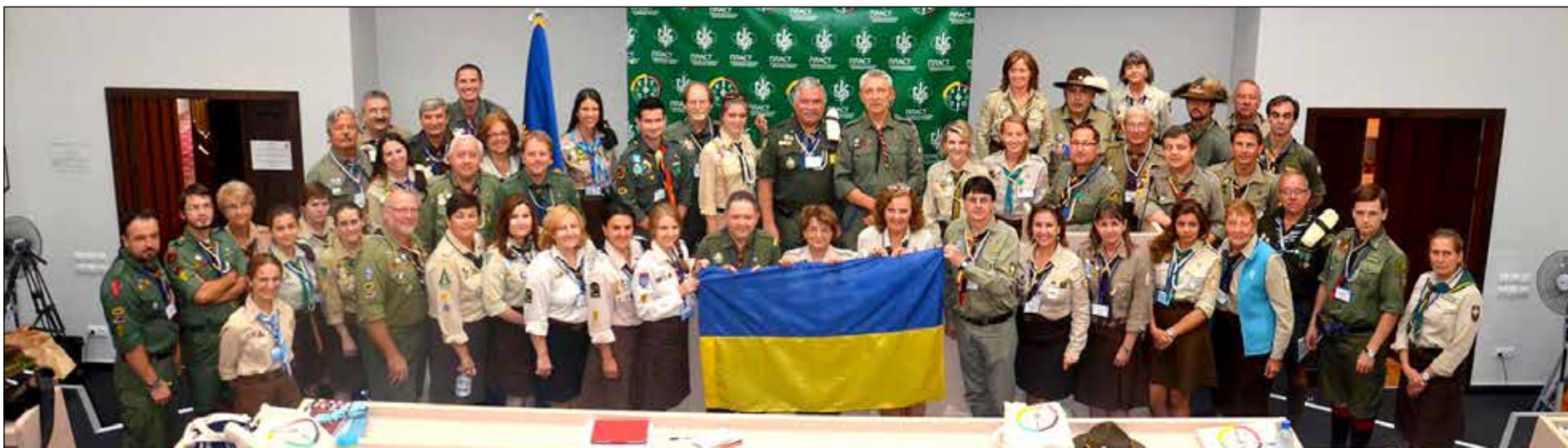
Делегати на зборах Конференції Українських Пластових Організацій в Києві.