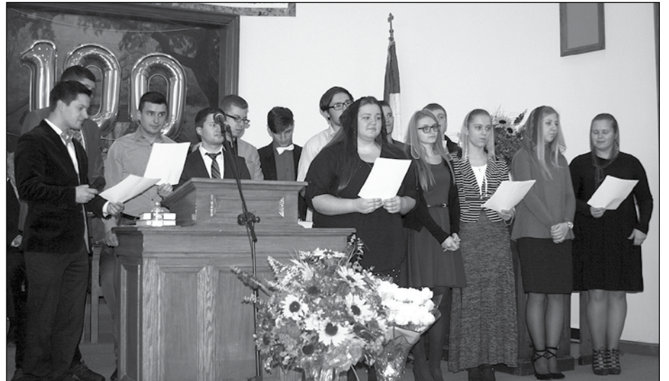
На святі співали гості з Української євангельської церкви.

тистської церкви. У 1916 році нову церкву не могли назвати інакше, бо приїздили сюди на заробітки українці, яких тоді звали русинами (Нинішній Український Народ-