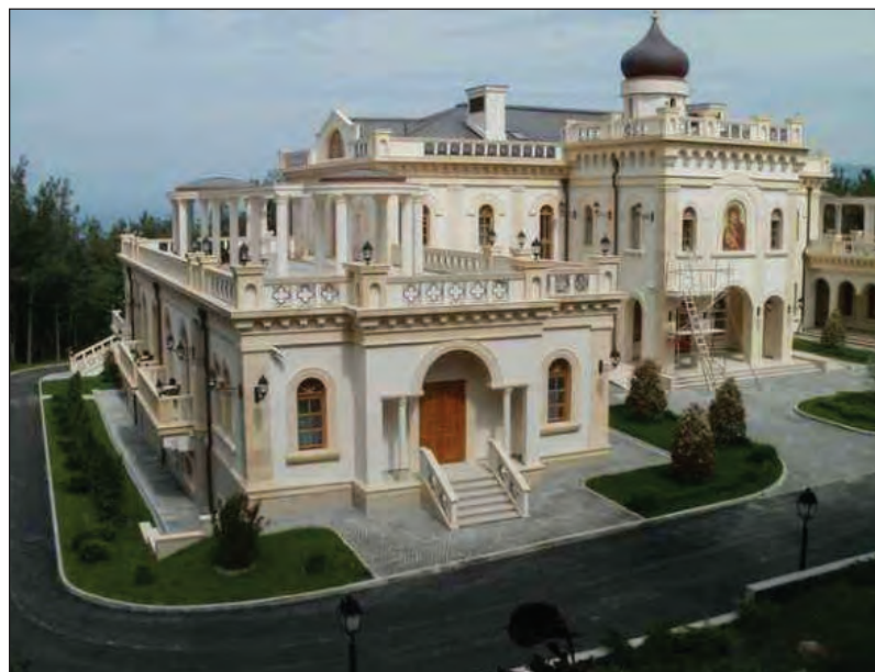
Патріярший палац у чорноморському Геленджіку.

20 листопада Патріярхові Московському Кирилові виповнилося 70 років. З цього приводу гучні торжества провели у Москві і Росії. Знову вихваляли К. Гундяєва за його „заслуги“, ніби забуваючи, що збагачення за рахунок віруючих, розпалювання ворожнечі до національних Церков, підтримка авторитарної влади суперечать правді Ісуса Христа та Його Церкви.