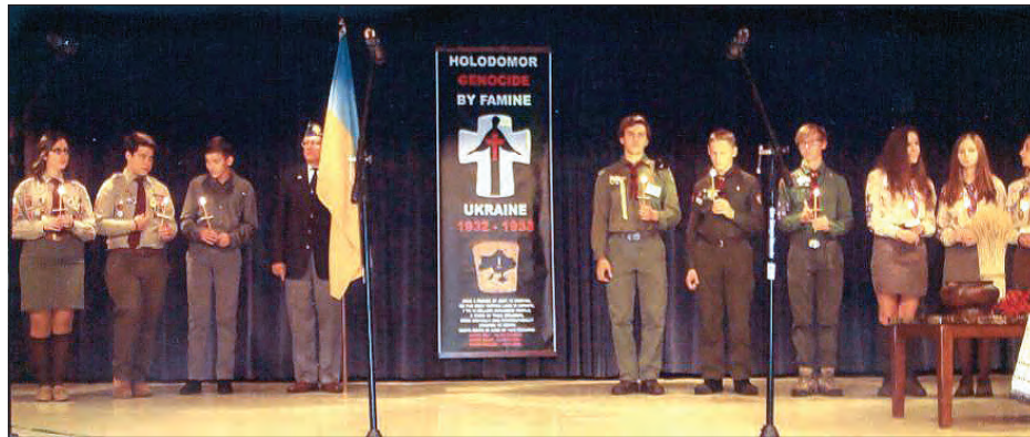
Молодь винесла на сцену запалені свічки пам'яті.

У поминальній проповіді о. Богдан Барицький з катедри св. Йосафата в Пармі наголосив, що молитовно вшановуючи пам'ять жертв Голодомору, ми повинні усвідомлю-