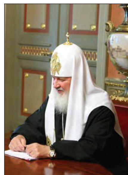
Патріярх Кирило з сумновідомим годинником.