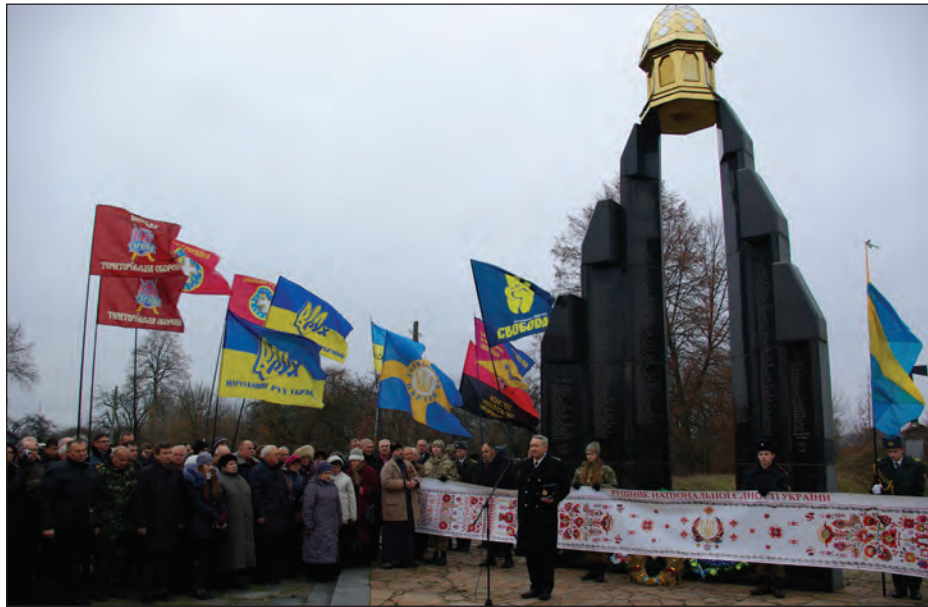
Виступає Голова Спілки Офіцерів України генерал-лейтенант Олександр Скіпальський.

У 1941 році, за німецької окупації, українські націоналістичні діячі організували велелюдне відзначення 20-ої річниці базарської трагедії. Керував ним