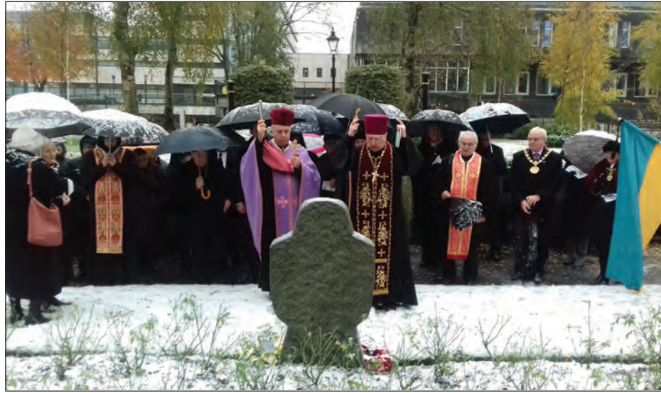
Панахида біля пам'ятника жертвам Голодомору 1932-1933 років в Україні.

Рочдейл була першим містом Великобританії, що поріднилося з