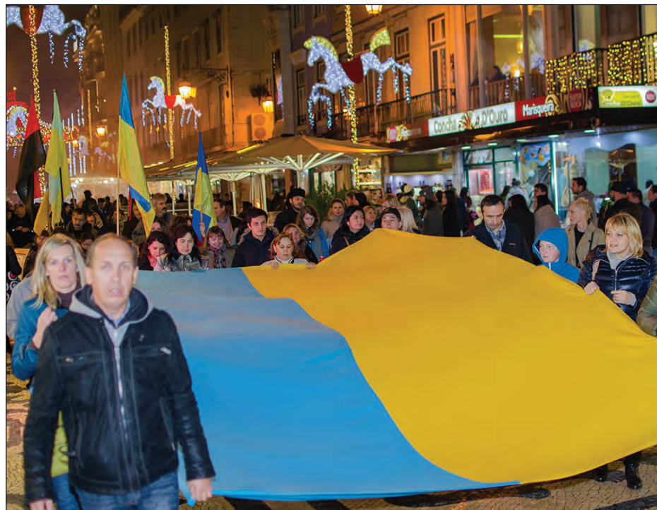
Акція українців „Мирна хода“ у Лісбоні.