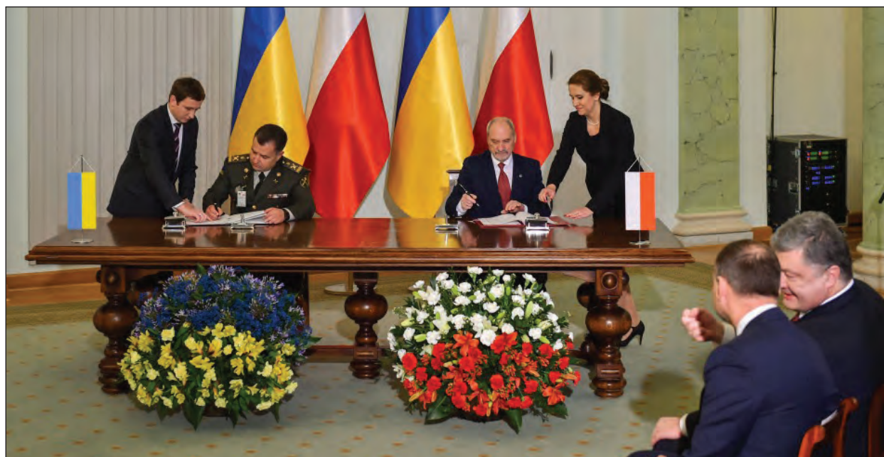
Міністер оборони України Степан Полторак (зліва) та Міністер національної оборони Польщі Антоній Мацєрєвич підписують Генеральну угоду про співробітництво у сфері оборони.

ВАРШАВА. – Президент України Петро Порошенко 2 грудня здійснив офіційну візиту до Польщі, де мав зустрічі з Президентом Польщі Анджеєм Дудою, Маршалком Сейму Марком Кухцінським, Головою Ради Міністрів Бе-