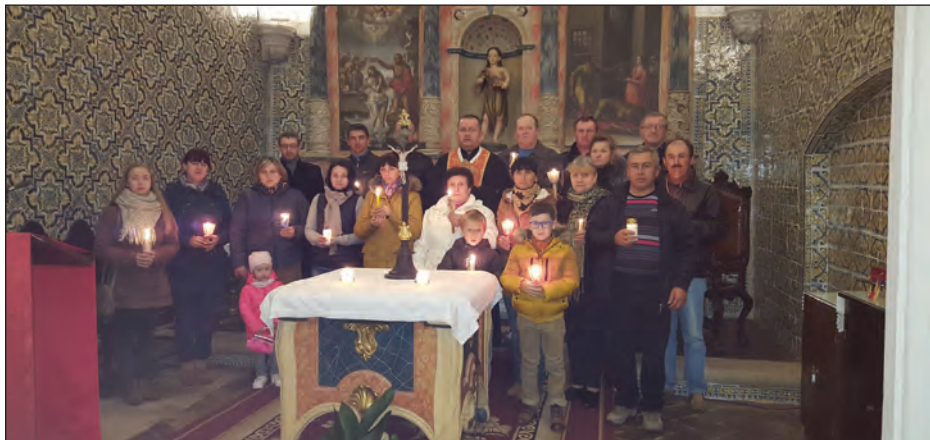
Українці запалили свічки у місті Евора.

Масові акції відбулися також в інших містах країни.