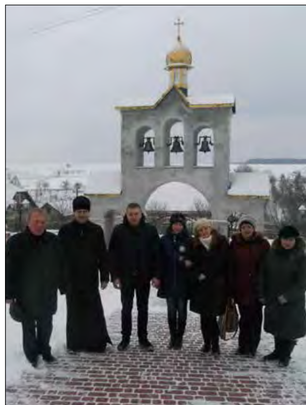
Представники товариства у Літятині біля церковної дзвіниці.

А ще жителі села Нараїв мріють про нові спортивні споруди і без допомоги товариства