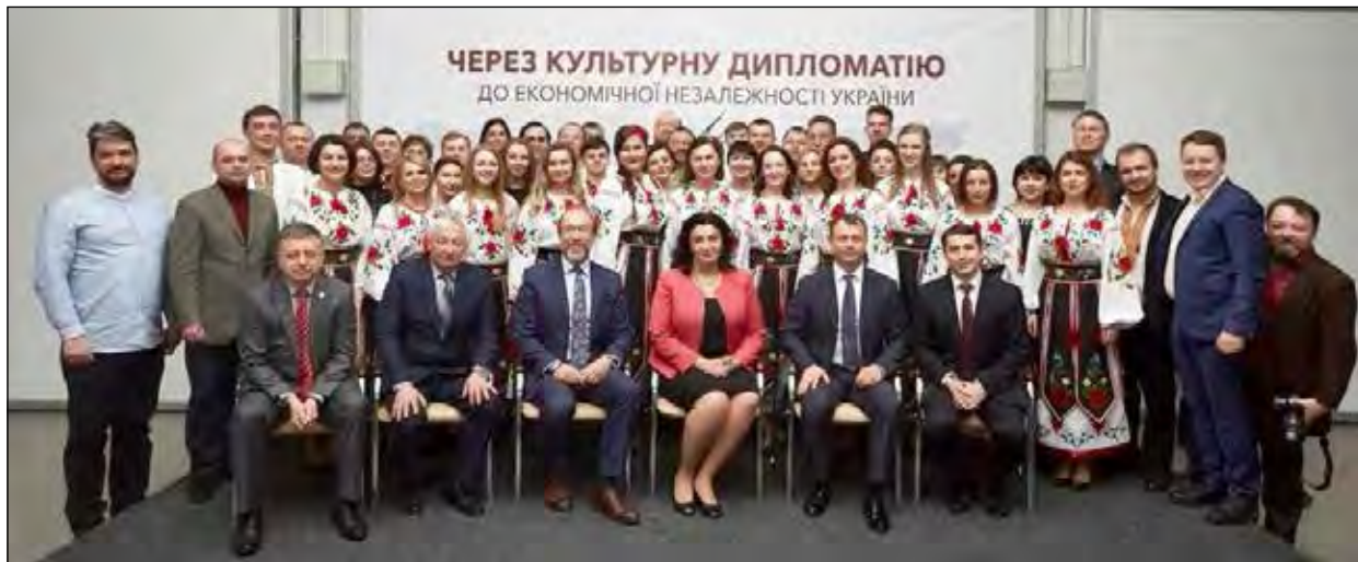
Учасники прес-конференції у Торгово-промисловій палаті України.