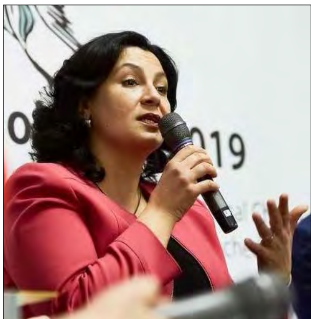
Віце-прем'єр-міністр з питань європейської та євроатлантичної інтеграції України Іванни Климпуш-Цинцадзе.

КИЇВ. – 28 лютого у Торгово-промисловій палаті України відбулася прес-конференція за участю Віце-прем'єр-міністра з питань європейської та євроатлантичної інтеграції України Іванни Климпуш-Цинцадзе, присвячена здійсненню масштабного проекту „Через культурну дипломатію до економічної незалежності України“.