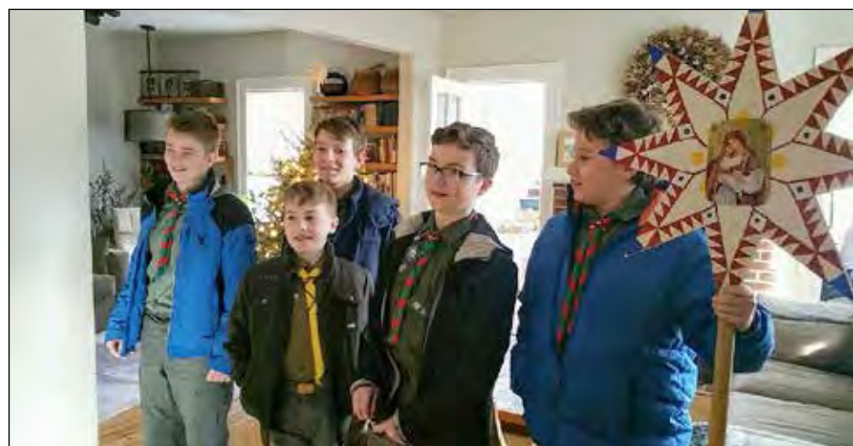
Юнацтво проводить Коляду.