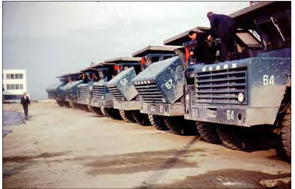
Водії самоскидів готуються до змагань.

Увечері водії нудьгували і я запропонував разом поїхати до недалекого Львова. Мушу визнати, що історія Львова їх не зацікавила, про історію українських визвольних змагань тоді не вели мови, а от львівське пиво сподобалося і ми провели чимало часу за кухлями пива.