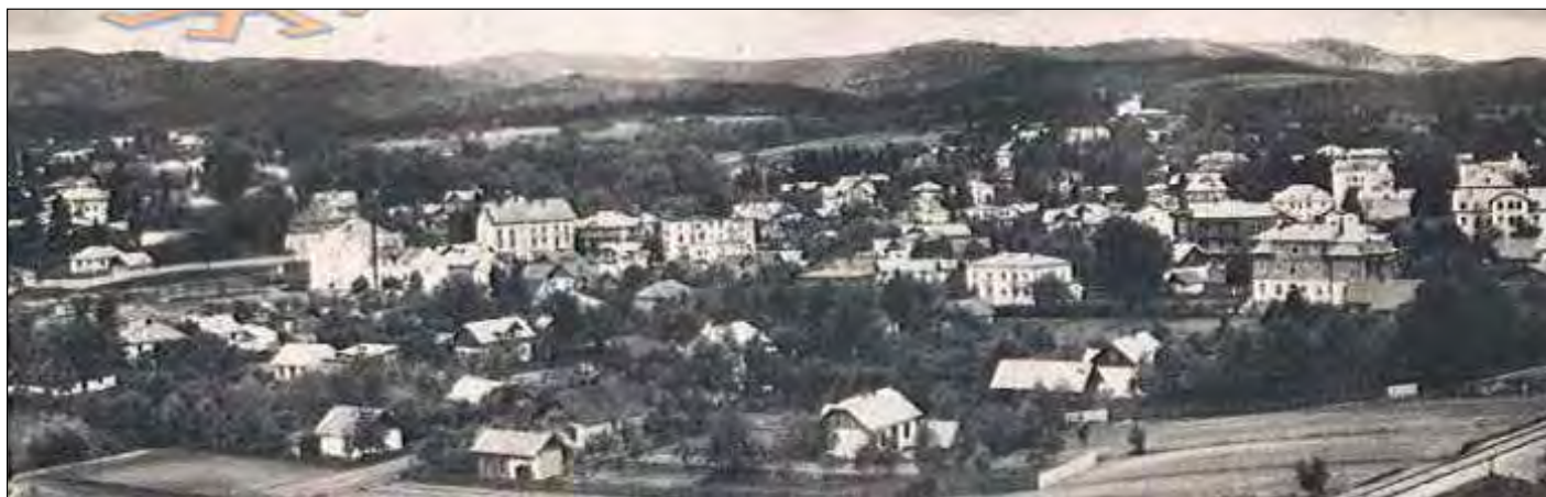
Панорама Трускавця в роки мого дитинства.