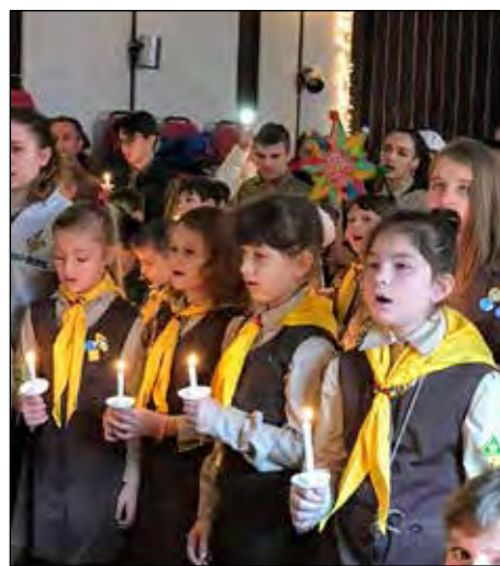
Діти запалили символічні свічки.

Юнацтво продовжувало Коляду 13 і 20 січня в Брукліні, Квінсі і Стейтен Айленді. Понад 100