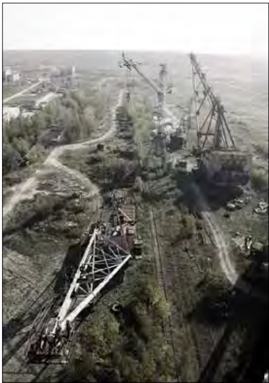
Руїни Новояворівського комбінату „Сірка“.

У 1950-их роках було відкрито Передкарпатський сірконосний басейн, найбагатший в Східній Європі, один з найбагатших у світі. У межах України (він залягає також на території Польщі й Румунії) басейн простягається до 300 кілометрів завдовжки і 40-50 кілометрів завширшки. Поклади сірки залягають на глибині до 500 метрів. Сірку в СРСР добували також у Туркменістані та в Росії на березі Волги, тож звідти мали приїхати водії.