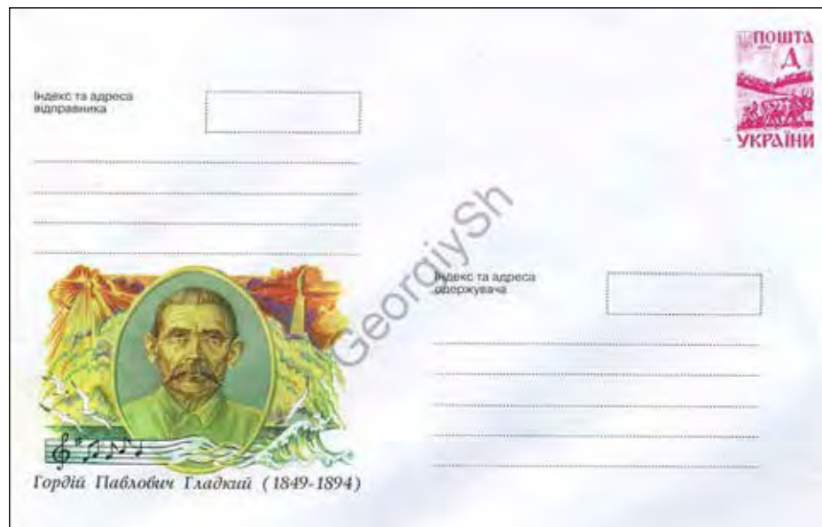
„Укрпошта“ випустила конверт на честь Гордія Гладкого.

Про те, що Г. Гладкий створив музику до „Заповіту“, згадує Д. Драний у своїй праці, яка вийшла друком до революції малим тиражем під назвою „Про походження музики „Заповіту“, а „Заповіт“ з мелодією Г. Гладкого вперше появився друком 1905 року. Ще раніше в 1886 році в Києві були видрукувані три музичні твори Г. Гладкого до слів Т. Шев-