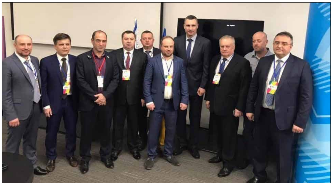
Учасники українсько-ізраїльської зустрічі.

„Із того, що я побачив на презентаціях і почув під час дискусій, хочу відзначити, що Київ сьогодні втілює найпередовіші технології „розумного міста“, – сказав В. Кличко. – Багато проектів уже діють в нашому місті. Це відкритий бюджет, контролю за роботою комунальної техніки, безконтактна оплата проїзду в метро. Проект „Безпечна столиця“ ми почали втілювати чотири роки тому, спираючись на досвід Ізраїля, після того, як