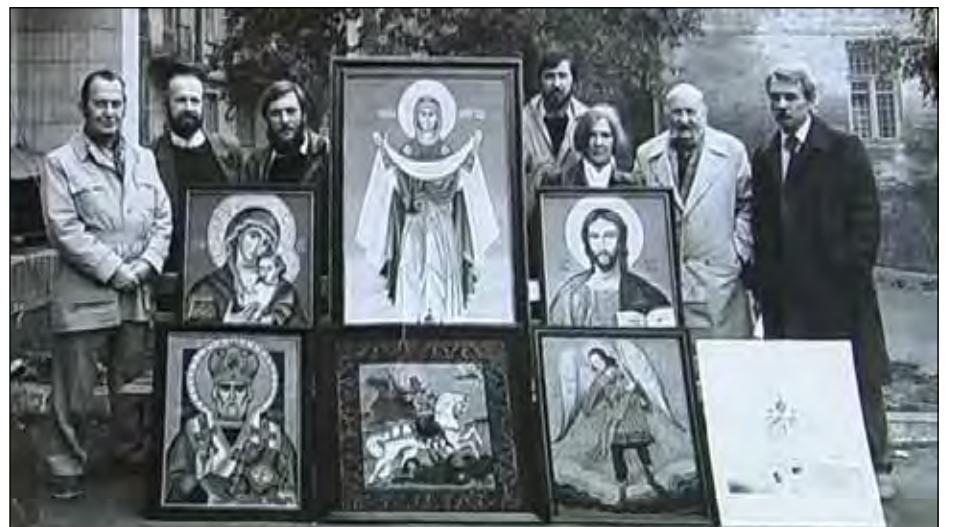
25 років тому черкаські мистці представили ікони, написані для Української автокефальної церкви у Черкасах.

В. Олександрко радіє отриманню Томосу: „Те, що відбулося – велика радість! Нарешті відбулася Українська Церква, де правитимуть рідною мовою, мислити будуть по-українськи. А це головне, дуже необхідне і для держави і православного світу“.