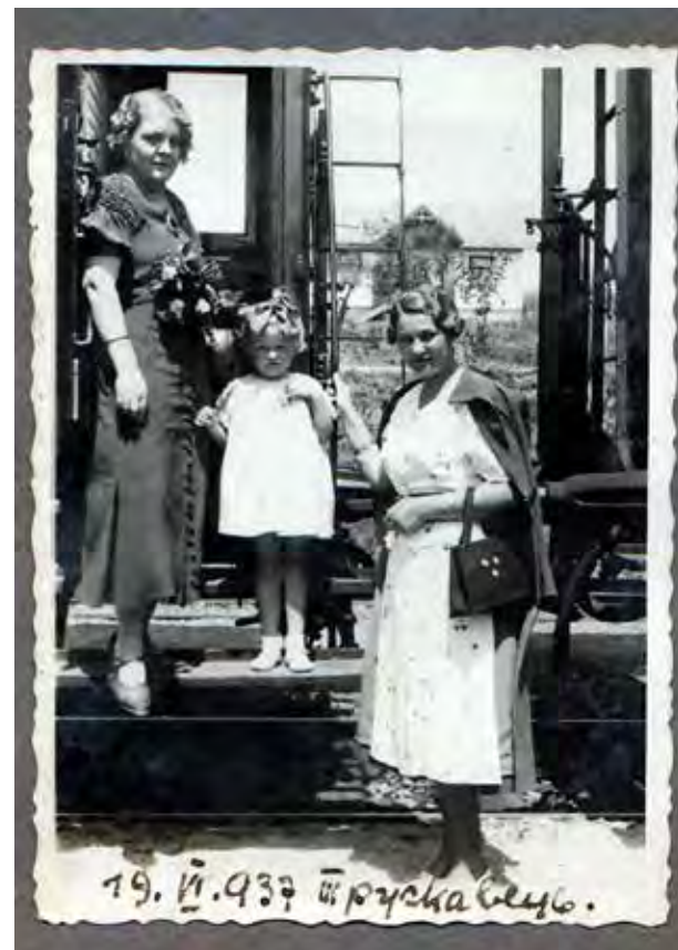
Вирушаємо потягом зі Львова до Трускавця.