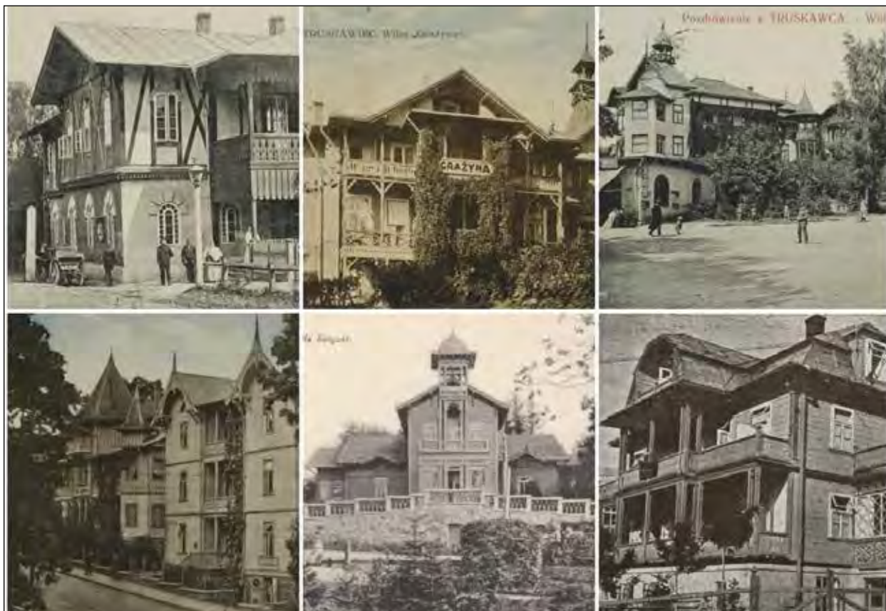
Трускавець на давніх листівках.

Минули роки. Трускавець тепер далеко, за землями й морями. Я маю вже онуків і їм розповідаю про казкове місто мого дитинства, переглядаючи старі фотографії у сімейному альбомі.