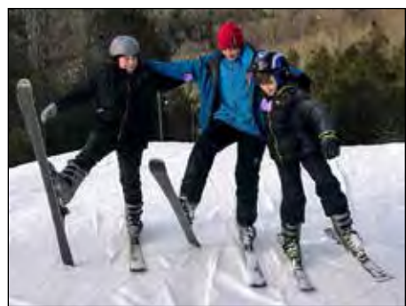
Пластуни на зимовій прогулянці.