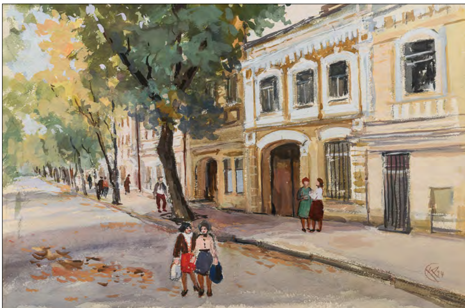
Катерина Кричевська-Росандіч. Софійська вулиця. Київ. Папір, акварель.

Особиста доля та мистецтво К. Кричевської-Росандіч представлені в проєкті через призму ідеї „Дороги“. Еміграція з України далекого 1943 року та пошук свого місця у світі загартували мисткиню, перетворили її на громадянку світу, навчили про-