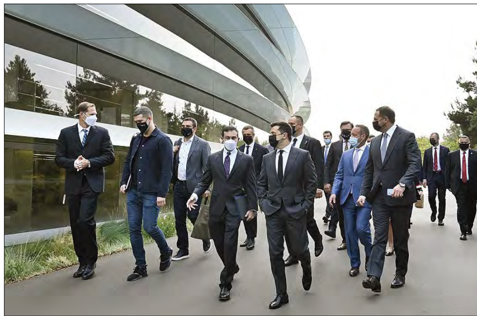
Президент України з Генеральним директором компанії Apple Тімом Куком у штаб-квартирі компанії в Купертіно.

У Вашингтоні Президент України Володимир Зеленський 1 вересня провів зустріч з членами Українського кокусу в Конгресі США. Він подякував американській делегації, яка була представлена на високому рівні, за участь у святкуванні 30-річчя відновлення незалежності України та першому саміті Кримської