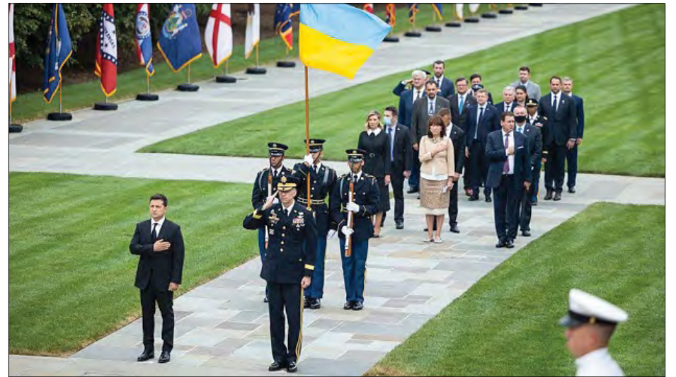
Президент Зеленський відвідав Арлінгтонське національне кладовище.

В. Зеленський зауважив, що на Арлінгтонському цвинтарі поховано багато воїнів з українськими прізвищами, тож він дав доручення Послові України у США Оксані Маркаровій організувати пошукову роботу із залученням волонтерів, зокрема