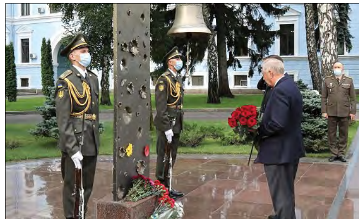
Делегація Конгресу США вшанували пам'ять захисників України.

На Церемоніальному майданчику делегація Конгресу США та заступник Міністра оборони