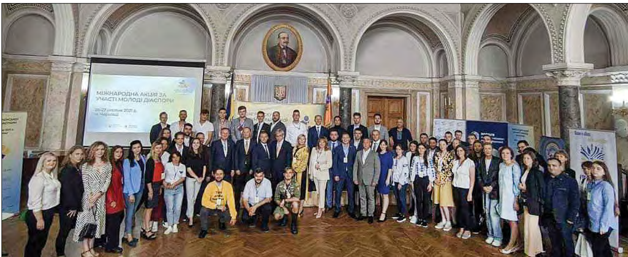
Учасники зібрань у Чернівецькому національному університеті ім. Юрія Федьковича.