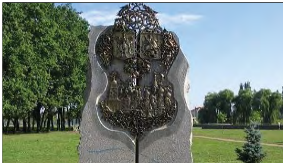
Пам'ятний знак на честь дружби Києва та Москви.