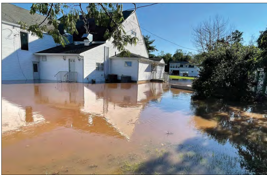
Духовний осередок Митрополії затоплений ураганом.

Ураган „Іда“ не оминув штат Нью-Джерсі, залишивши за собою повені та руйнування.