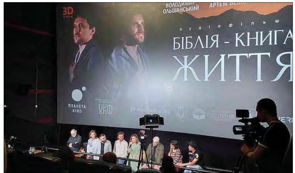
Презентація аудіофільму „Біблія – книга життя“.

ЛьВІВ. – 23 серпня відбулася презентація першого в Україні мистецького аудіофільму „Біблія – книга життя“ із 3D звуком. Серед партнерів проєкту – Український католицький університет. Це перша в Україні спроба створити подібний аудіофільм із 3D звуком (можливістю повністю зануритися у звуки простору аудіофільму) на тексти Святого Письма українською мовою.