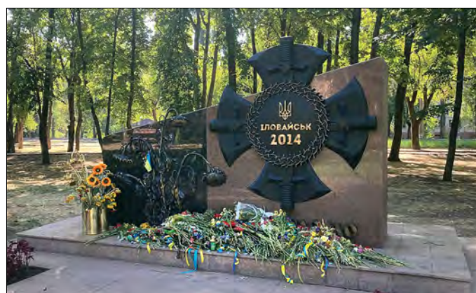
Пам'ятник у Кривому Розі полеглим під Іловайськом.

КИЇВ. – 29 серпня 2014 року під час забезпечення в районі Іловайська „зеленого коридору“ для українських військовослужбовців, які склали зброю, по них, а також по автомобілю з символом Червоного Хреста, було здійснено інтенсивні обстріли. Це призвело до загибелі 366 українських військових, 429 отримали поранення різного ступеню тяжкості, 300 потрапили у полон, 24 зникли безвісти.