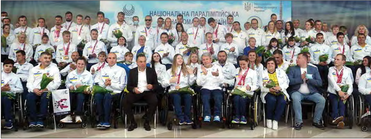
Українські спортсмени повернулися з Паралімпіади.

ТОКІО. – 5 вересня відбулася церемонія закриття XVI літніх Паралімпійських ігор. В урочистій події взяли участь представники 162-ох збірних та близько 850 гостей.