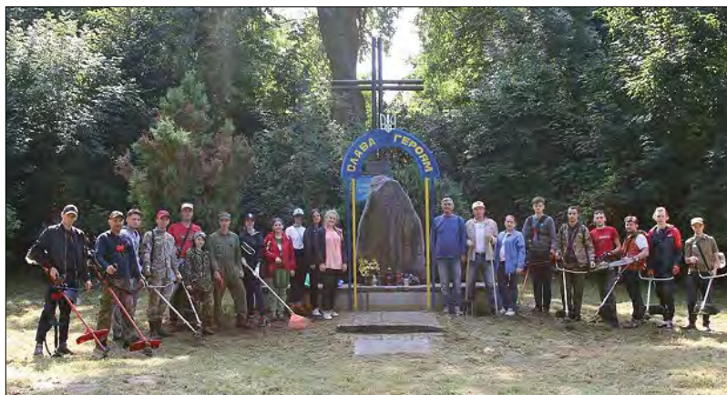
Активісти Івано-Франківська на впорядкуванні українських кладовищ у Польщі.

волонтери висадили два дуби на місці зруйнованих могил вояків УПА. Вони також взяли участь у меморіальних акціях та поминальних Богослужіннях. („Патріотичний Івано-Франківськ 1.0“)