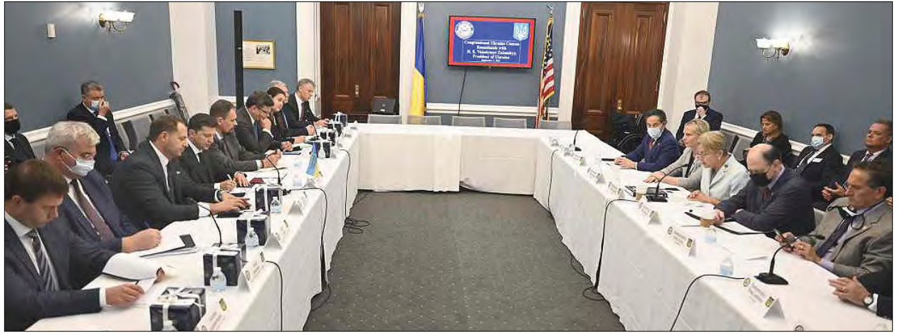
Зустріч з членами Українського кокусу в Конгресі США.

ЖЕНЕВА. – Експерт Всесвітньої організації охорони здоров'я (ВООЗ) Марія Ван Керхове заявила 7 вересня, що наразі що світ вийшов на плато з захворюваності на COVID-19, яке, однак, знаходиться на досить високому рівні. „Ситуація викликає стурбованість. Особливо з урахуванням того, що пандемія триває вже 20 місяців і у нас є інструменти для боротьби з пандемією”, – відзначила експерт ВООЗ. Марія Ван Керхове також зауважила, що в світі щодня фіксують близько 4,5 млн нових випадків зараження COVID-19 та майже 72-78 тисяч летальних випадків. Водночас у ВООЗ додали, що ситуація з пандемією в різних регіонах світу помітно відрізняється. (Укрінформ)