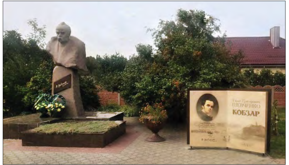
Інсталяція „Кобзар” у Знам'янці.