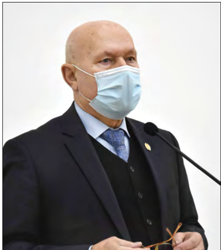
Ректор Національного університету Ігор Пасічник під час конференції трудового колективу.

Острозька академія успішно пройшла акредитації бакалаврського та магістерського рівня вищої освіти та третього освітньо-наукового рівня, зовнішню оцінку корупційних