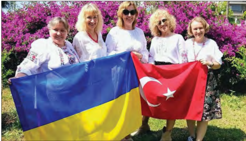
Представниці української громади міста Мерсін.

Українська громада в турецькому місті Мерсін отримала офіційну реєстрацію, тож тепер у Туреччині налічується 10 офіційних українських спілок. Посольство України в Туреччині закликала українців долучатися до роботи громад у своїх містах.