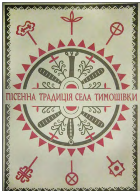
Збірка „Пісенна традиція Тимошівки“