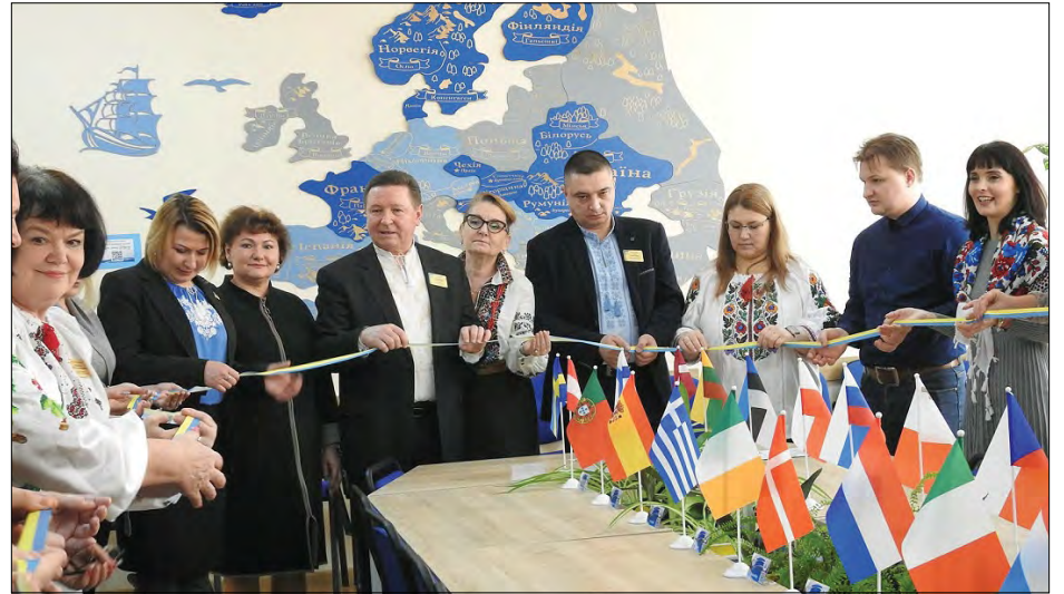
Під час відкриття Українсько-європейського центру в Миколаєві

У Миколаєві в рамках обласного проекту „Поважаю Європейські цінності – будую сучасну Україну“ відкрився центр „Українсько-Європейський осередок. Тренінг-НАЛЛ“, приурочений до Дня Соборності України.