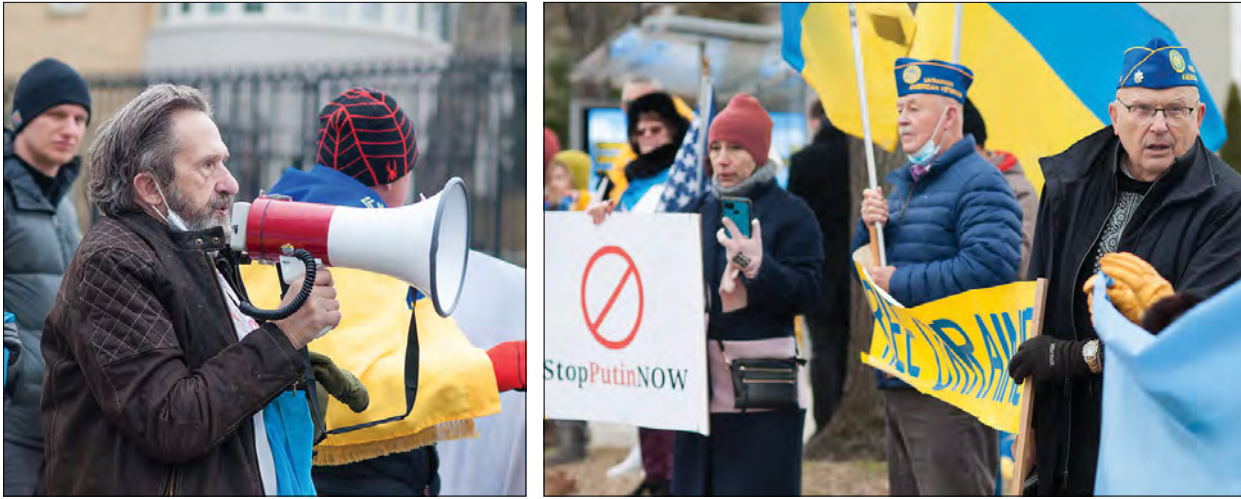
Під час акції „Зупиніть Путіна зараз!“ під Посольством Росії у США

ВАШІНГТОН. – Близько пів сотні українських активістів, громадських діячів та небайдужих громадян вийшли 25 січня до посольства Росії у США на акцію протесту під гаслом: „Зупиніть Путіна зараз! Скажіть „ні!“ російській війні в Україні“.