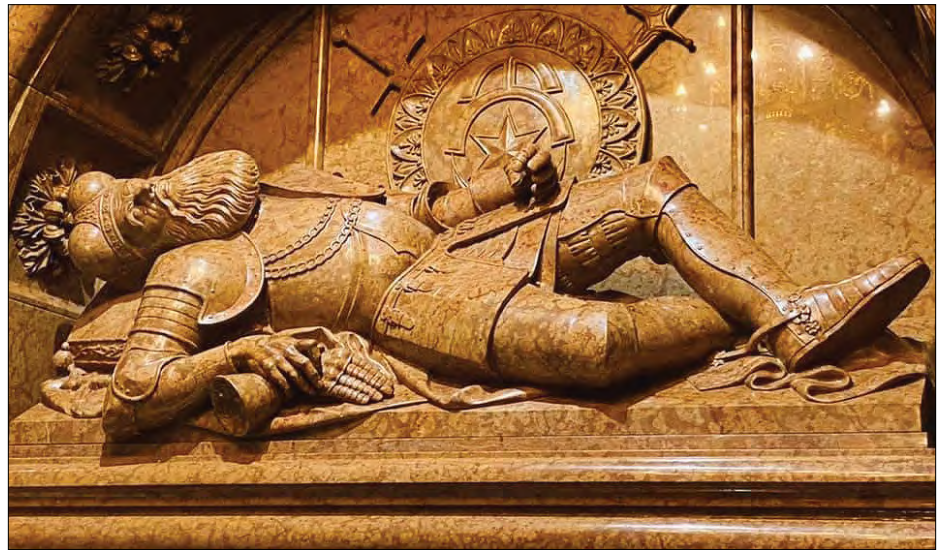
Відновлений надгробний пам'ятник Великому князю Острозькому.