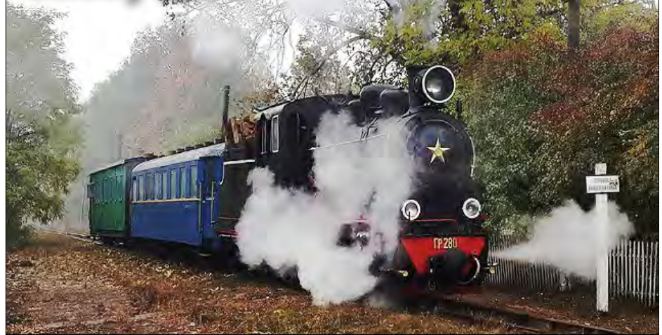
„Гайворонський експрес“ в дорозі.