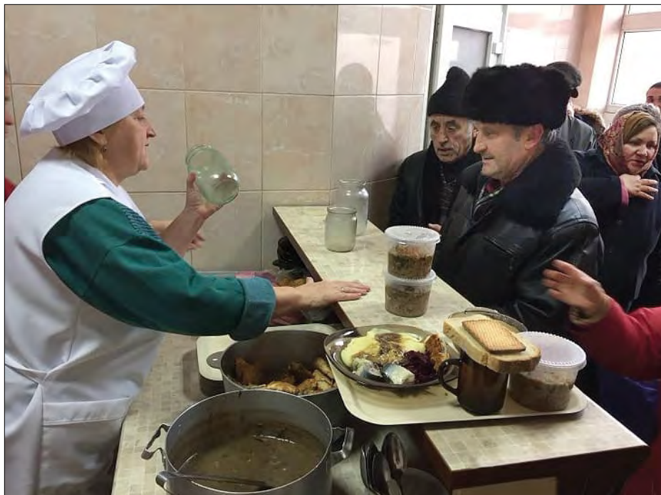
У Радехові годують голодних людей.

Благодійна організація Благодійний фонд „Маглена“ ім. Володимира Великого розпочинає впроваджувати програму „Благодійна їдальня“. Її мета – безоплатне надання послуг із забезпечення повноцінним харчуванням осіб, які опинилися в складних життєвих обставинах. Споживачами благодійної програми є діти з кризових сімей, діти-сироти, самотні особи, люди з особливими потребами, самотні та багатодітні батьки, безхатьки, люди, які не в змозі вижити на мізерні доходи та інші. Їдальня розміщатиметься у Радехові Львівської області.