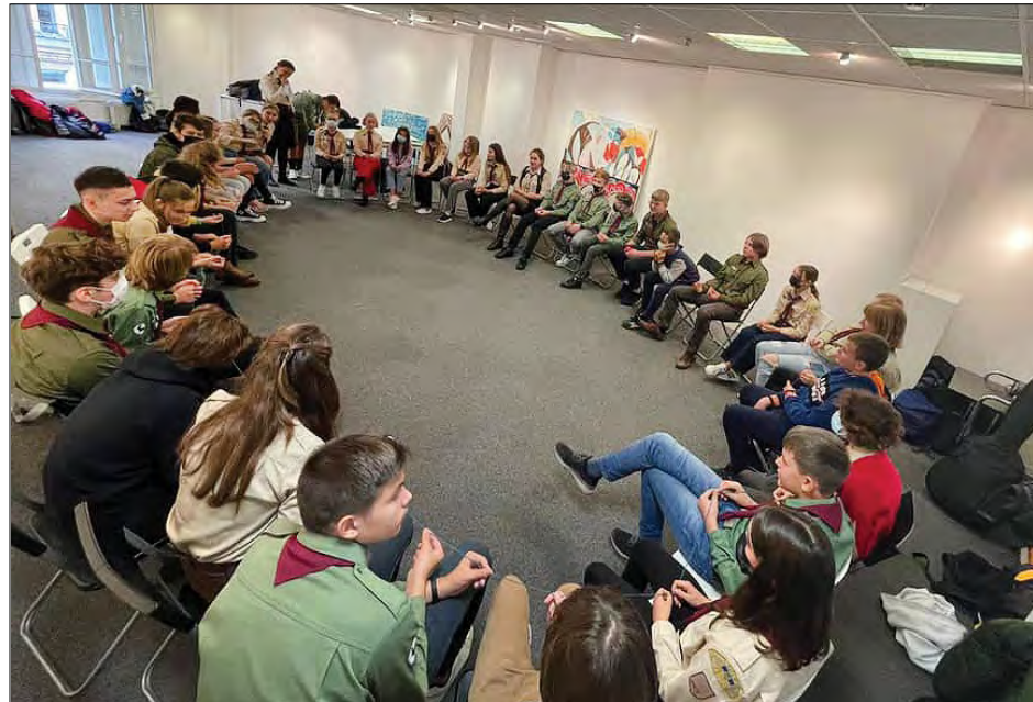
Під час установчих курінних сходин УПЮ імені Анни Ярославни

Координаційний Центр Пластових груп у Європі затвердив Підготовчий мішаний курінь уладу пластунів юнаків та пластунок юначок (УПЮ) імені Анни Ярославни у Франції, установчі курінні сходи якого відбулися 7 листопада 2021 року в Парижі.