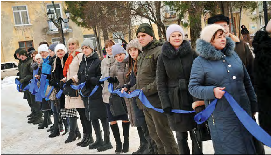
Акція „Ланцюг Єднання“ у Сєвєродонецьку

Живий „Ланцюг Єднання“ з нагоди Дня Соборності створили у Сєвєродонецьку в парку та на майданчику біля Луганського обласного академічного українського музично-драматичного театру.