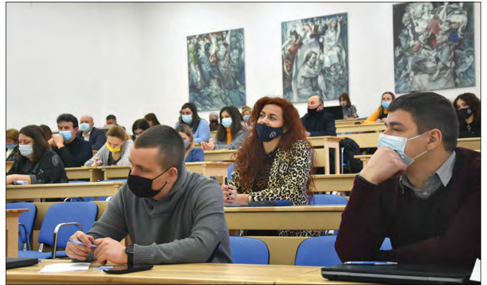
Представники професорсько-викладацького складу Острозької академії.

Окремо І. Пасічник зосередив увагу на тому, що в 2021 році здійснено низку заходів до 445-річчя університету, серед яких Міжнародний форум „445 років вищої освіти України“ за участю Міністра освіти і науки України Сергія Шкарлета, оновлено ключову експозицію Музею історії Острозької академії.