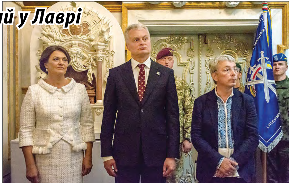
Президент Литовської Республіки Гітанас Науседа з дружиною Діаною та Міністр культури України Олександр Ткаченко.

Портрет К. Острозького, зброя та лицарський обладунок часів Битви під Оршею, представлені на виставці „Князі Острозькі: європейський вимір української історії“ в Києво-Печерському заповіднику.