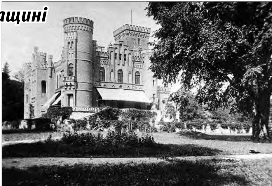
Палац у Леськовому на початку ХХ ст.