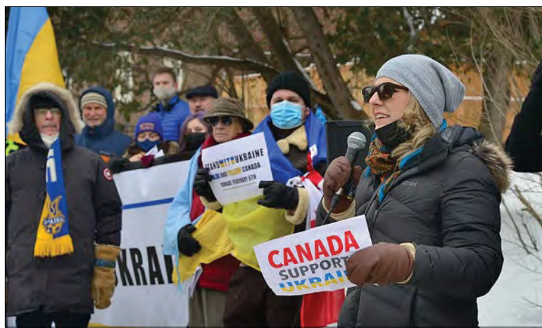
Акція в Оттаві на підтримку України та проти агресії Росії.