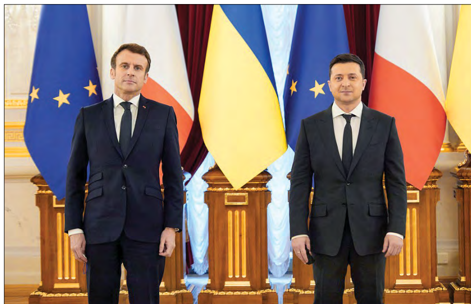
Президент України Володимир Зеленський та Президент Французької Республіки Емануель Макрон в Києві.

КИЇВ. – 8 лютого відбулася зустріч Президента України Володимира Зеленського та Президента Французької Республіки Емануеля Макрона, який прибув до України з робочою візитою. Україна та Франція мають спільне бачення актуальних загроз та безпекових викликів, що постали перед Україною, Європою та світом в цілому. Тому партнерство наших держав у сфері безпеки сьогодні має особливе значення. Про це заявив Президент В. Зеленський за результатами перемовин з Президентом Е. Макроном.