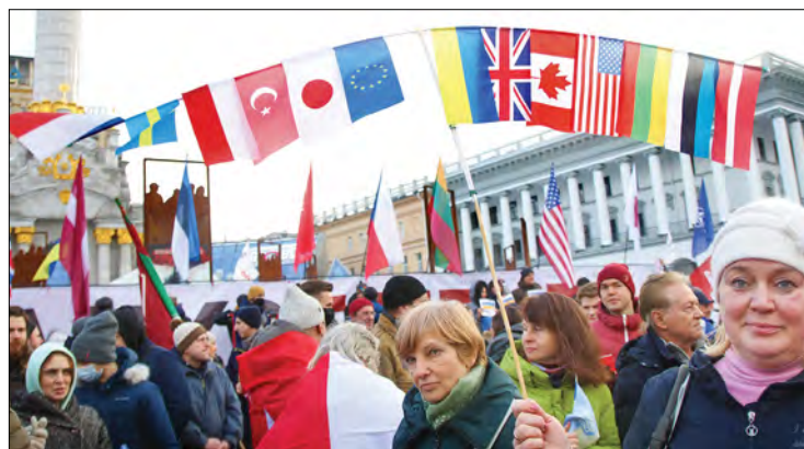
Учасники акції на подяку справжнім друзям України.