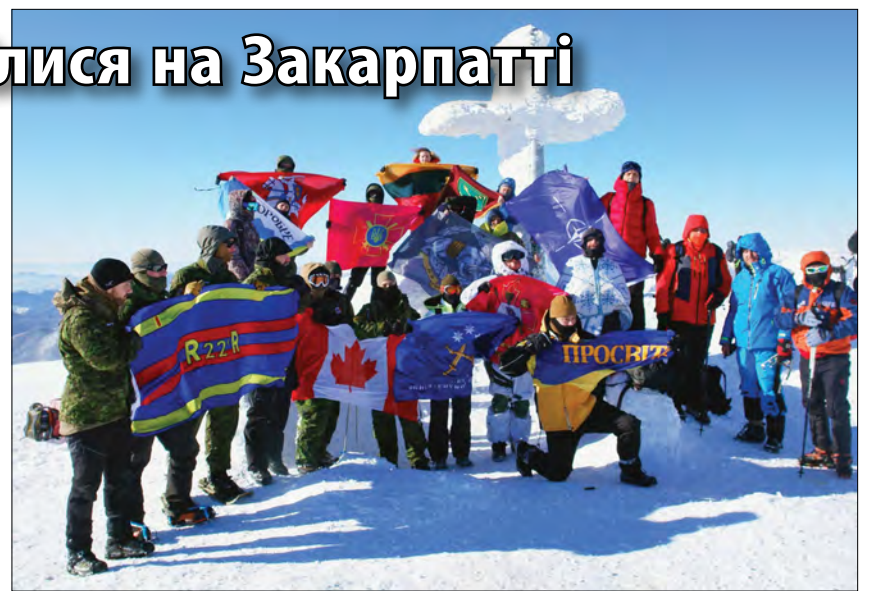
Єдність військовиків України і НАТО в поході на Говерлу.

На Закарпатті, в селищі Ясіня, впродовж кількох днів майорили державні прапори України та країн НАТО. Тут відбувся вже III традиційний зимовий міжнародний союзницький кубок співдружності „Україна – стратегічний партнер НАТО заради миру і безпеки у світі“, що відбувається за підтримки Офісу Президента України та Міністерства оборони України. У проекті взяли участь представники різних родів військ та оперативних командувань, бойові учасники і ветерани російсько-української війни, а також представники НАТО та Європейського Союзу, волонтери, керівники гро-