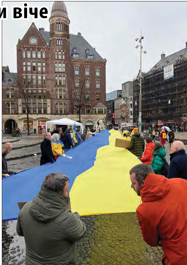
В Амстердамі розгорнули 30-метровий прапор України.

Новопризначений Посол України в Нідерландах Максим Кононенко висловив слова підтримки учасникам акції та подякував за прояв патріотизму та солідарності. Учасники акції рушили до будівлі посольства Росії. Розгорнувши українські, нідерландські, білоруські та грузинські прапори, всі разом закликали Росію припинити агресію проти України й заспівали гімн України.