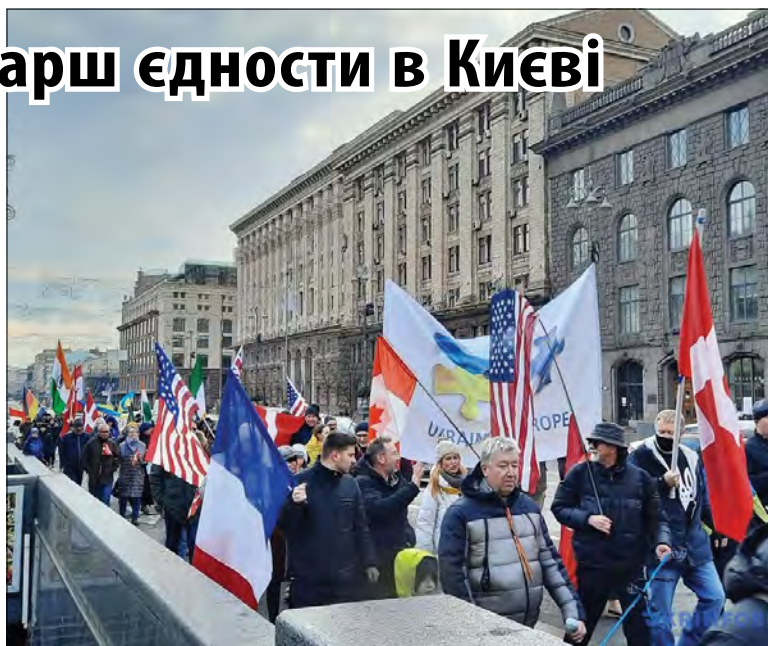
Укрінформ Міжнародний марш єдності у Києві. (Фото: Укрінформ)

КИЇВ. – У центрі столиці іноземці провели 6 лютого акцію на підтримку України проти російської агресії (Internatinoal Unity March for Ukraine). Участь у заході взяли близько 200 осіб. Учасники вийшли на марш, аби висловити підтримку Україні на тлі загрози вторгнення Росії. Марш розпочався з парку біля пам'ятника Тарасові Шевченку, звідти учасники рухалися до Майдану Незалежності. Під час ходи учасники маршу тримали прапори своїх країн, зокрема Канади, Великої Британії, США, Німеччини, інших держав, а також України. На Майдані організатори заспівали Гімн України.