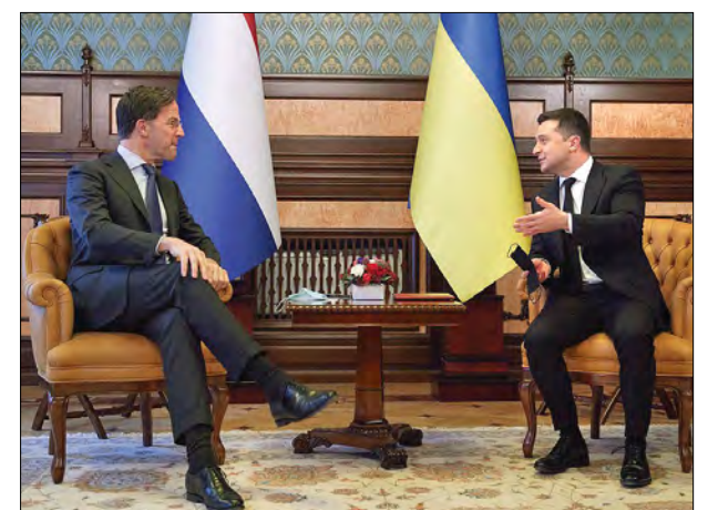
Президент України Володимир Зеленський (праворуч) під час зустрічі з Прем'єр-міністром Королівства Нідерланди Марком Рютте.

Президент В. Зеленський висловив вдячність за підтримку нідерландської сторони в реабілітації українських військовослужбовців, які постраждали під час збройного конфлікту, що триває. Прем'єр-міністр М. Рютте оголосив, що Нідерланди розширяють цю підтримку, щоб надати реабілі-