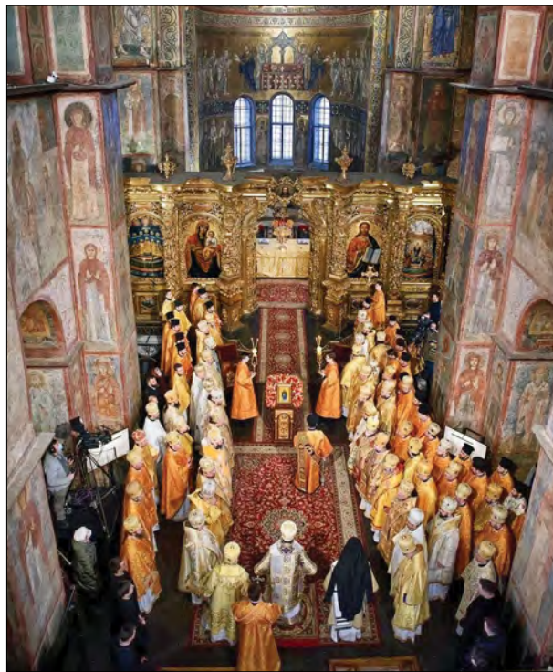
Відзначення 3-ої річниці Інтронізації Митрополита Київського та всієї України Епіфанія.

У привітанні Владика Даниїл зазначив, що давня Київська митрополія зародила УПЦ США 104 роки тому, коли Митрополит Іоан Теодорович прибув до США та Канади, щоб забезпечити духовну опіку для людей українського походження у Північній Америці. Владика Даниїл навів паралелі важливих історичних подій, адже УПЦ США несли багату духовну спадщину в західному суспільстві, тоді як Церква України страждала під радянським гнітом. Лише Божою благодаттю, духовною опікою та баченням Вселенського Константинопольського патріархату сьогодні вся українська православна спільнота розділяє радість євхаристійного