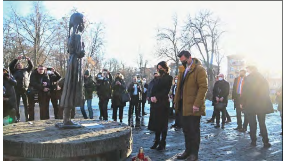
Анналена Бербок під час відвідань Національного музею Голодомору-геноциду.

КИЇВ. – 7 лютого Міністер закордонних справ Німеччини Анналена Бербок прибула з візитом в Україну.