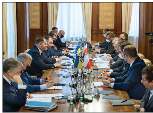
Під час зустрічі делегацій України та Польщі.

31 січня з ініціатииви Президента України Володимира Зеленського та Президента Польщі Анджея Дуди відбулася зустріч міністрів інфраструктури України Олександра Кубракова та