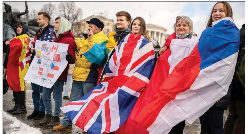
Учасники акції на подяку справжнім друзям України.

Активісти подякували Великобританії – за понад 2,000 протитанкових ракетних комплексів (ПТРК), переданих безкоштовно, продаж двох протимінних кораблів і будову ще кількох невеликих кораблів для Військово-морських сил України; США – за близько 400 протитанкових комплексів „Javelin“ та ракети до них, стрілецьку зброю, загалом понад 170 тонн летального озброєння; Туреччині, яка продала десятки бойових дронів „Bayraktar“ і паралельно будує корвет; Чехії – за 152-міліметрові снаряди, передані безкоштовно, раніше продані бойові