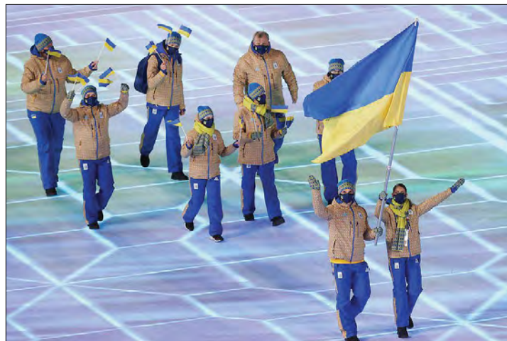
Олімпійська збірна команда України на відкритті XXIV зимових Олімпійських ігор.