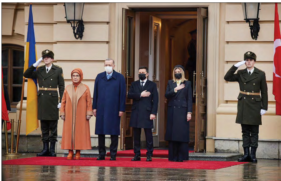
Президент України Володимир Зеленський і Президент Турецької Республіки Реджеп Таїп Ердоган з дружинами.

КИЇВ. – 3 лютого Президент України Володимир Зеленський мав зустріч з Президентом Турецької Республіки Реджепом Таїпом Ердоганом, який прибув до України з офіційною візитою. Вони спілкувалися у форматі віч-на-віч. Після цього під головуванням В. Зеленського та Р. Ердогана відбудеться X засідання Стратегічної ради високого рівня між Україною та Турецькою Республікою.