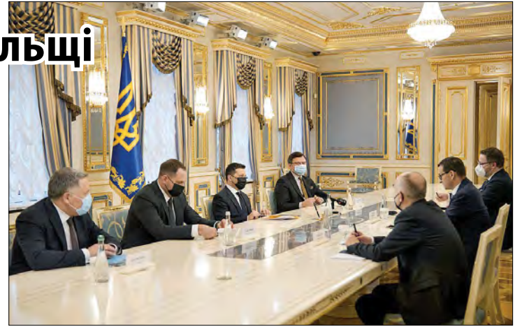
Під час зустрічі з Головою Ради міністрів Республіки Польща Матеушем Моравецьким.

В. Зеленський і М. Моравецький констатували спільність підходів України та Польщі до безпекових загроз, які становить проєкт „Північний