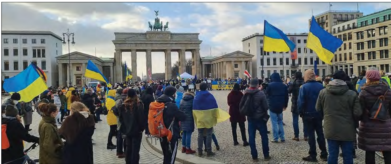
Учасники акції в Берліні.

У Берліні українці та друзі України вийшли на спільну акцію, аби вкотре продемонструвати світу, що вони виступають проти війни. Учасники акції протесту закликали федеральний уряд