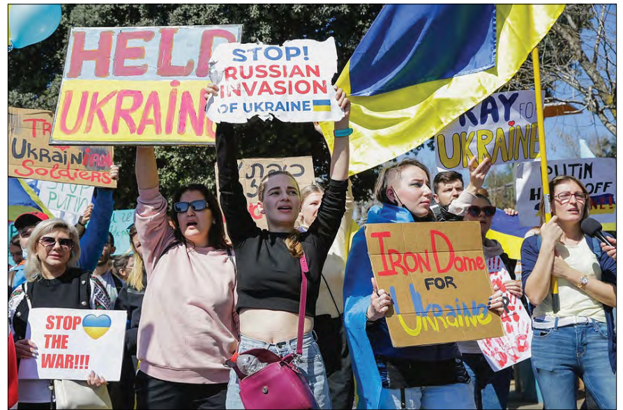
Акція в Ізраїлі на підтримку України.

27 лютого вийшли на одну з центральних вулиць міста майже 20 тис. людей. Для Ізраїлю – це дуже багато. Були українці, вихідці з України та ізраїльтяни, які несли гасла проти Путіна, співали Гімн України. Така ж акція відбулася 28 лютого в Єрусалимі з вимогою допомогти Україні зброєю. До України виїхало воювати 20 ізраїльтян різного походження. У них є досвід служби в спецпідрозділах Армії оборони Ізраїлю. Уже прибули на український кордон кілька десятків медиків, які допомагатимуть українським медикам доглядати за пораненими. Також прибув гуманітарний вантаж: ліки, ковдри, намети, одяг, медичне обладнання, пристрої для очищення води. Офіційний Ізраїль також став на бік України. Хоча це не просте рішення для єврейської держави: терористичні організації з Сирії, Лівану постійно воюють проти Ізраїлю.