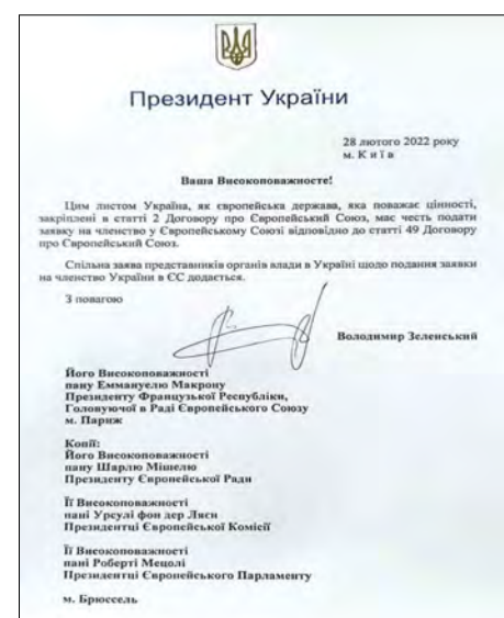
Заява на членство України в ЄС