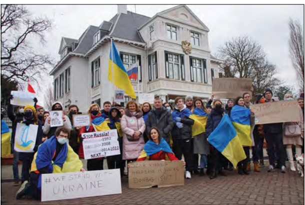
Учасники акції в Нідерландах.

У нідерландській столиці на мирну акцію проти агресії Росії та за мир в Україні зібралися українці, нідерландці, білоруси, грузини та росіяни. Її учасники з прапорами та плякатами прийшли під будівлю Палацу миру – офіційну резиденцію Міжнародного суду ООН і Постійної палати третейського суду. Від Палацу миру учасники акції рушили до Посольства України в Нідерландах та заспівали Гімн України. Новопризначений Посол України в Нідерландах Максим Кононенко висловив слова підтримки учасникам акції та подякував за прояв патріотизму та солідарності.