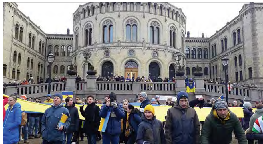
Учасники акції в столиці Норвегії.

Міністер закордонних справ Ізраїлю Яір Лапід сказав: „Ізраїль уважно вивчає значення санкцій щодо Росії. Ми створили міжвідомчу групу, яка вивчатиме наслідки та вплив санкцій для ізраїльської економіки та політики. Водночас, Ізраїль буде частиною глибокої допомоги народу України. У нас є моральний та історичний обов'язок бути частиною зусиль, аби допомогти Україні“.