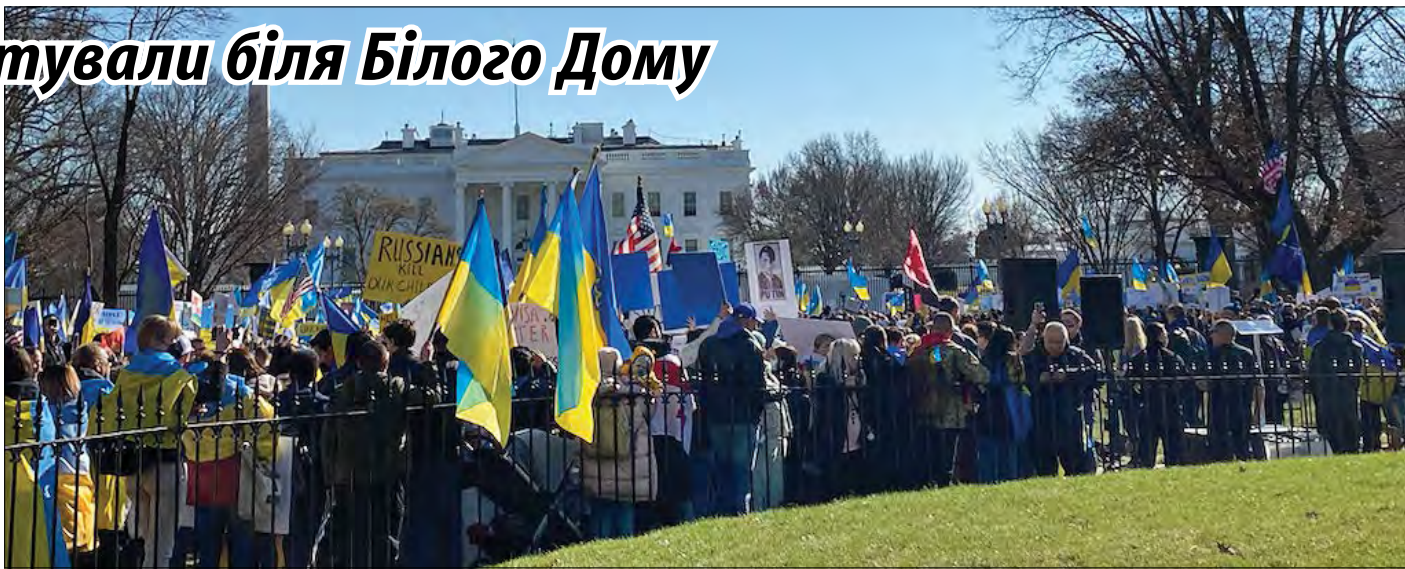
Учасники демонстрації біля Білого Дому.

„Ми обрали місце для акції поруч із Білим домом, бо хочемо надіслати меседж адміністрації Байдена: ми вдячні за те, що вже робиться, що