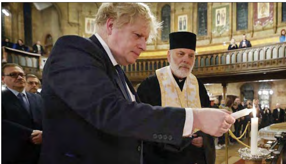
Борис Джонсон у катедрі Пресвятої родини.

ЛОНДОН. – Прем'єр-міністр Великої Британії Борис Джонсон 27 лютого у Лондоні відвідав Українську католицьку катедрю Пресвятої родини, де зустрівся з українською громадою та помолвився за Україну.