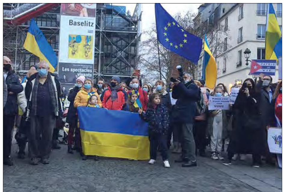
Акція на підтримку України в Парижі.

У Парижі мітинг проти агресивної політики Росії „Ні війни, Україна має лишатися вільною та незалежною державою!“ організувало Об'єднання українців у Франції. Акція відбулася в самому центрі міста, навпроти музею сучасного мистецтва Жоржа Помпиду. До неї долучилося близько 200 людей, зокрема представники й інших національних асоціацій країни – грузинів, румунів, білорусів, литовців і навіть кубинців.