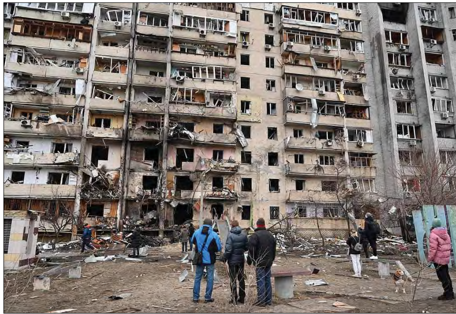
Зруйнований російським окупантом житловий будинок у Києві.

Сухопутні сили зупинили наступ ворога на Чернігівщині – знищено 20