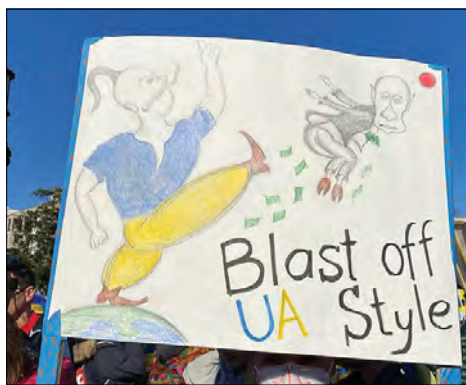
Учасники акції вимагали від Президента США негайних дій на підтримку України.