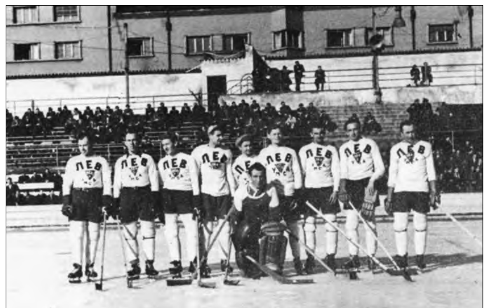
Гокейна команда „Лев“ (Міттенвальд) на стадіоні в Мюнхені перед грою з американською командою „Ред Вінгз“.

З нагоди зимових олімпійських ігор ініціатива „Архіви діаспори“ опублікувала унікальні кадри 1947 року про українську гокейну команду „Лев“ у таборі переміщених осіб у Міттенвальді, Німеччина. Ці кадри є частиною фільму режисера з діаспори Богдана Солука „У таборах втікачів у Німеччині“, 1949 рік. Фільм відзнято у Голівуді, у приватному архіві сина режисера Юрія Солука. Ця кіноплівка провела там понад 70 років.