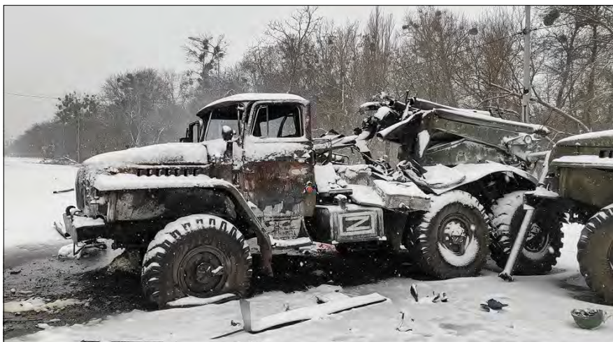
Знищена військова техніка Росії.

Другий ранок масштабної війни. О 4-й год. російські сили продовжили наносити ракетні удари по території України. Вони кажуть, що цивільні об'єкти для них нібито не мішені. Але це чергова їхня брехня. Насправді, вони не розрізняють, в яких районах діяти.