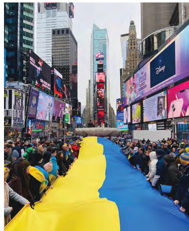
На Таймс Сквер розгорнули довжелезний прапор України.