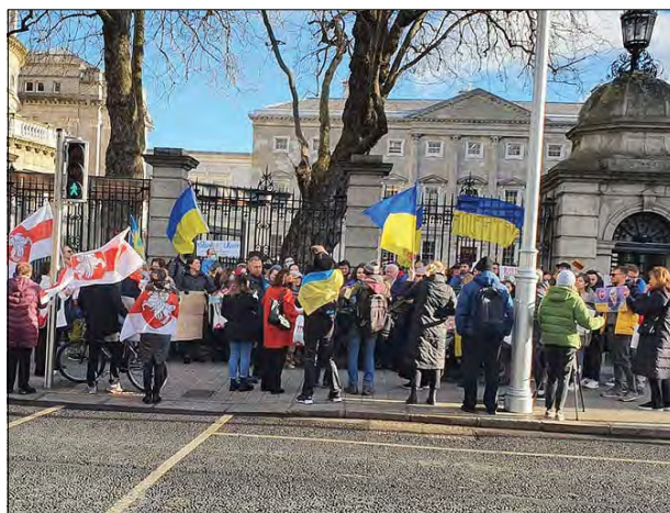
Віче у Дубліні.