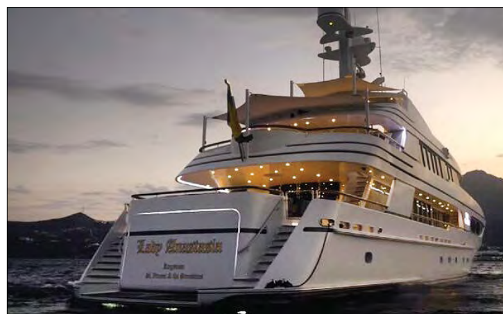
Яхта „Леді Анастасія“.