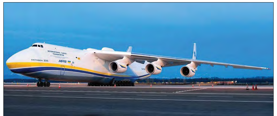
Літак Ан-225 „Мрія“.

Літак існує у єдиному екземплярі та експлуатується Авіалініями Антонов. „Мрія“ – авіаційний гігант, на рахунок якого рекорди з перевезення максимального комерційного вантажу та найдовшого і найважчого в історії авіації моновантажів, вантажопідйомності. На момент вторгнення „Мрія“ перебувала на технічному обслуговуванні, тому не встигла вилетіти з України. Але літак обов'язково відновлять, зая-