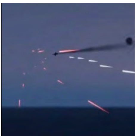
ППО України збиває російський літак.

Мілітарний портал України, ВВС, Укрінформ, УНІАН