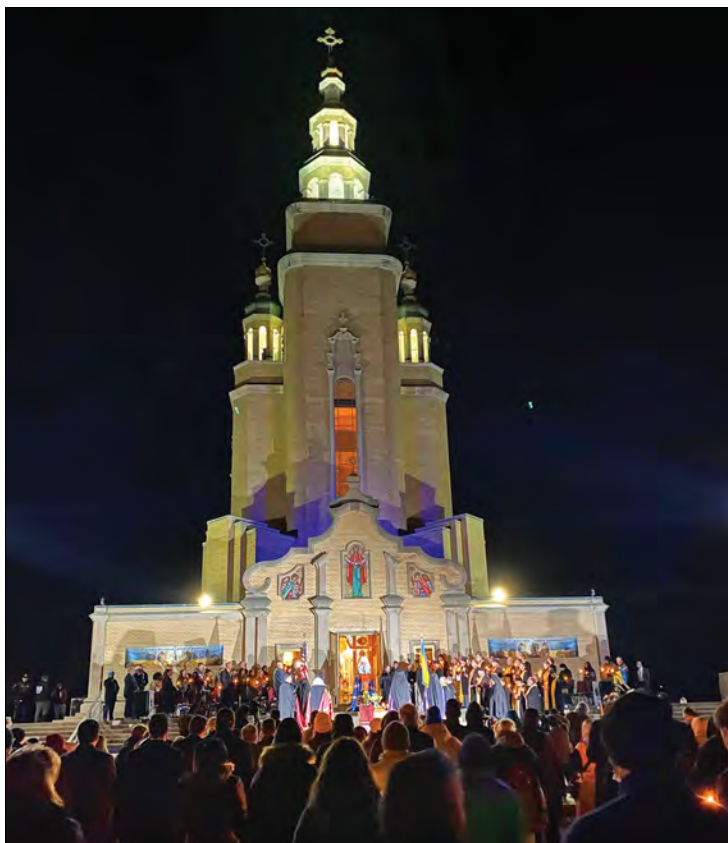
Молебень за Україну перед Церквою-пам'ятником св. Андрія Первозваного.