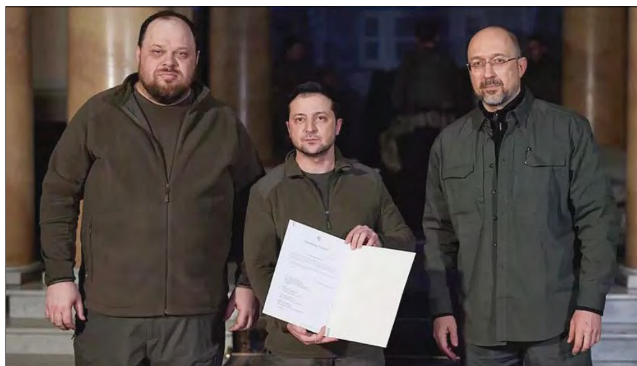
Спільну заяву підписали (зліва): Руслан Стефанчук, Володимир Зеленський і Прем'єр-міністр Денис Шмигаль.

КИЇВ. – 28 лютого Президент Володимир Зеленський підписав заяву на членство України в Європейському Союзі. Також спільну заяву підписали голова Верховної Ради Руслан Стефанчук і Прем'єр-міністр Денис Шмигаль. В офісі президента вважають, що європейська інтеграція України буде значним внеском у стабільність та безпеку Європи.