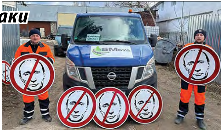
Встановлюють нові дорожні знаки.

Тим часом дорожники Кіровоградщини оновлюють правила дорожнього руху: новий знак „Окупантам рух заборонено“ виготовили в достатній кількості та встановлюють на шляхах