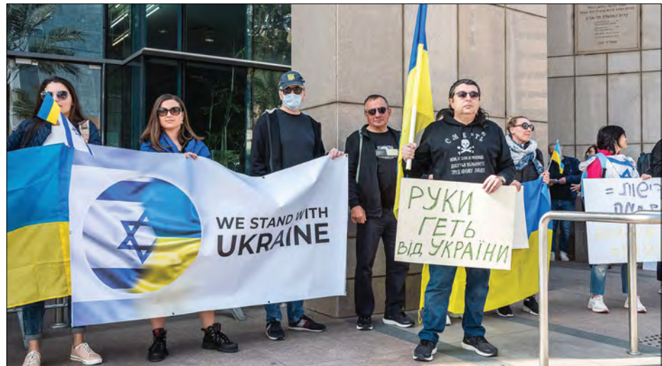
Мітинг в Тель-Авіві.