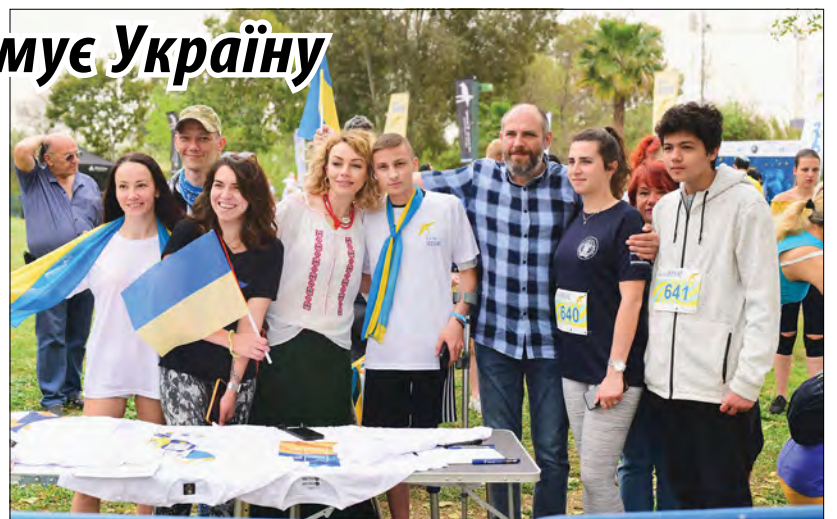
Учасники благодійного марафону.

Благодійний забіг „Run for Ukraine” організували „Israeli Friends of Ukraine”, фонд допомоги „Шанс на життя” спільно з Посольством України в державі Ізраїлі за підтримки постійного партнера канадської організації UJE