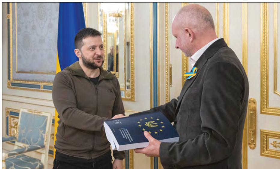
Президент Володимир Зеленський передає Матті Маасікасу заповнену анкету-опитувальник.