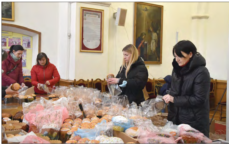
Приготували гостинці для воїнів.