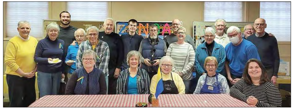
Зустрілися друзі України з Ньютона.