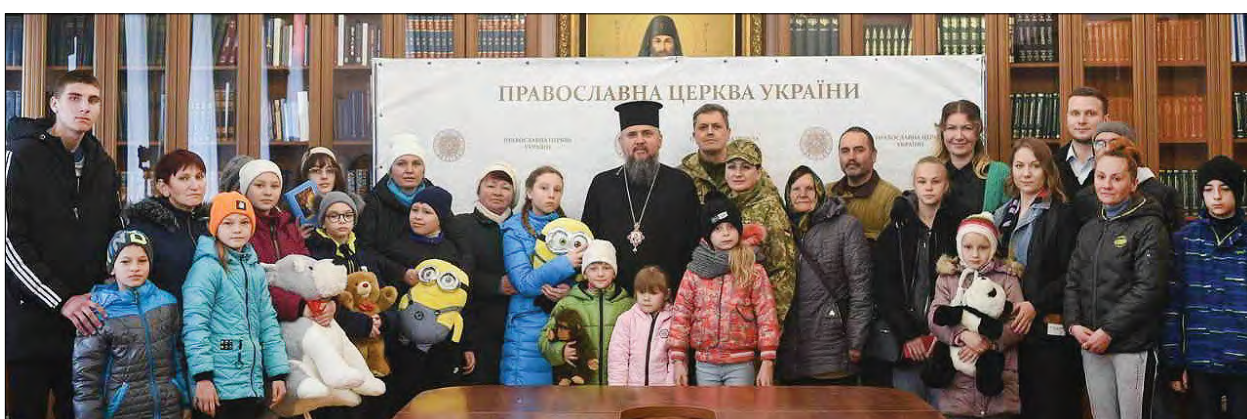
Учасники зустрічі з Митрополитом Епіфанієм.