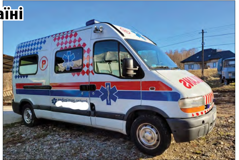
Авто швидкої допомоги для України

Ми співпрацюємо у благодійній діяльності з українськими православними парафіяльними громадами в Німеччині, особливо в Мюнхені,