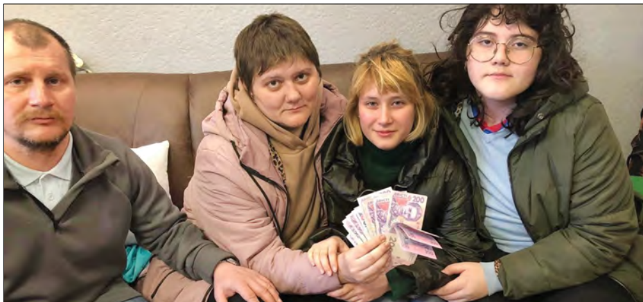
Допомога з Америки