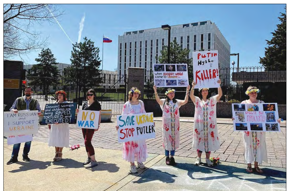
Активісти перед Посольством Росії.

ВАШІНГТОН. – У столиці США голос на підтримку України лунав біля Білого дому, перед Посольством Росії та резиденцією Посла Росії в США. 17 квітня біля російського посольства відбулась акція проти воєнних злочинів окупантів. Її учасниці вийшли в білих сукнях із червоними плямами, що символізують звірства загарбників щодо мирного населення України, передовсім жінок і дітей.