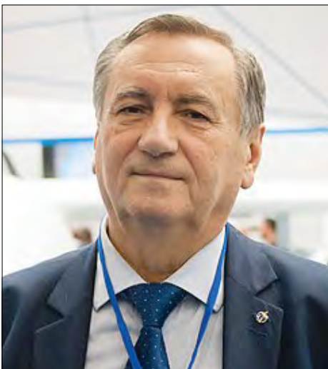
Олег Коростильов.