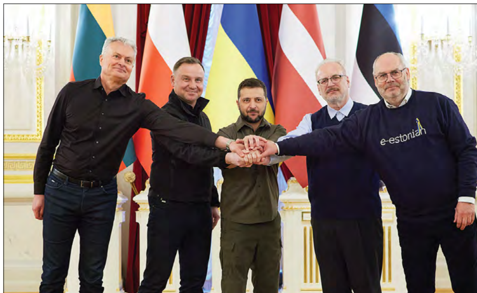
Зустріч президентів України, Естонії, Латвії і Литви.

КИЇВ. – 13 квітня Президент України Володимир Зеленський зустрівся з Президентом Республіки Польща Анджеєм Дудою, Президентом Латвійської Республіки Егілсом Левітсом, Президентом Литовської Республіки Гітанасом Наусею та Президентом Естонської Республіки Аларом Карісом, які перебували в Україні з візитом.