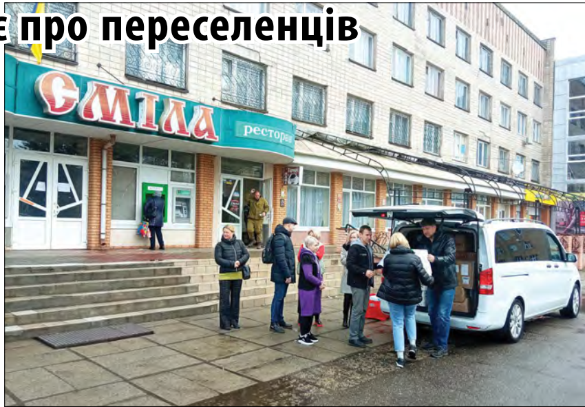
„Співдія“ привезла допомогу в Смілу.

Переселенці, які не мають у місті знайомих або родичів, реєструються в міському управлінні соціального захисту, а тоді їх спрямовують до Центру. Завдяки наполегливій роботі його працівників тут уже накопичено чимало одягу, продуктів харчування, ліків, які жертвують звичайні люди і благодійні організації. До Центру вже звернулося близько 3,000 постраждалих від російської агресії. На допомогу прийшла також черкаська організація