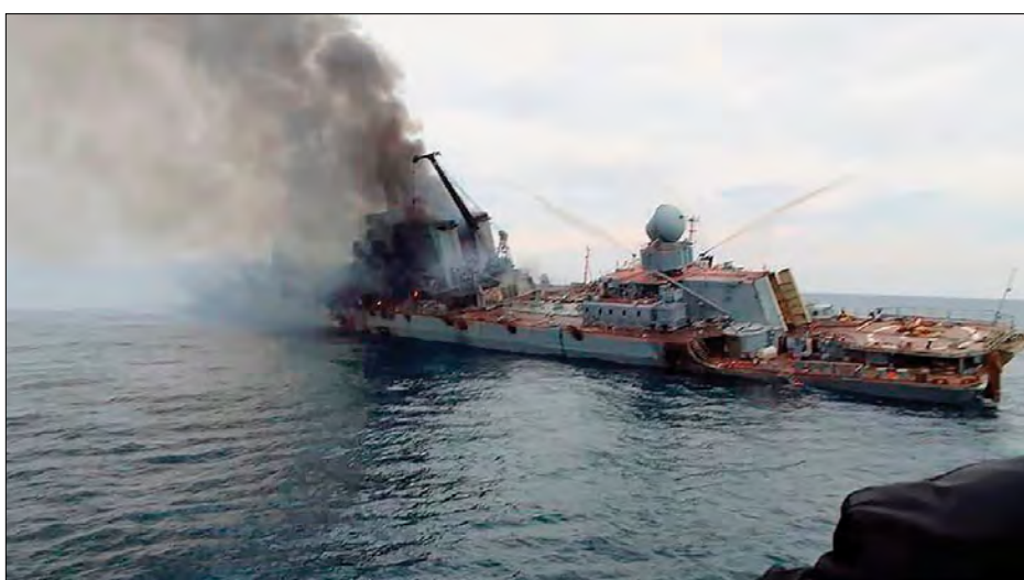
Ракетний крейсер „Москва“ після атаки.

Увечері 13 квітня ракетний крейсер „Москва“, що входить до складу 30-ої дивізії надводних кораблів Чорноморської фльоти Росії і є її флагманом, був уражений двома ракетами „Нептун“ і затонув у ніч на 14 квітня.