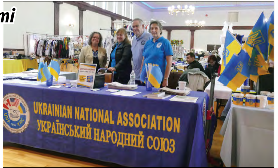
Інформаційний стіл Українського народного союзу.