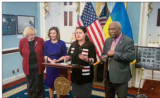
Відкриття фотовиставки в Конгресі США.