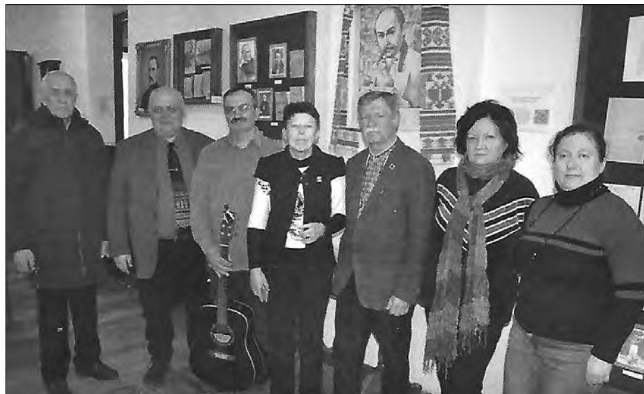
Учасники Дня поезії в Хмельницькому.

У обласних осередках „Просвіти“ по всій Україні, де тільки можливо, активісти невтомно працюють у цей пекельний час московської навали. Вони організовують поміч Збройним силам України та біженцям з гарячих пунктів: збирають та доставляють медикаменти до лікарень, де лікуються військові та біженці, збирають і передають матеріали на радіозв'язок.