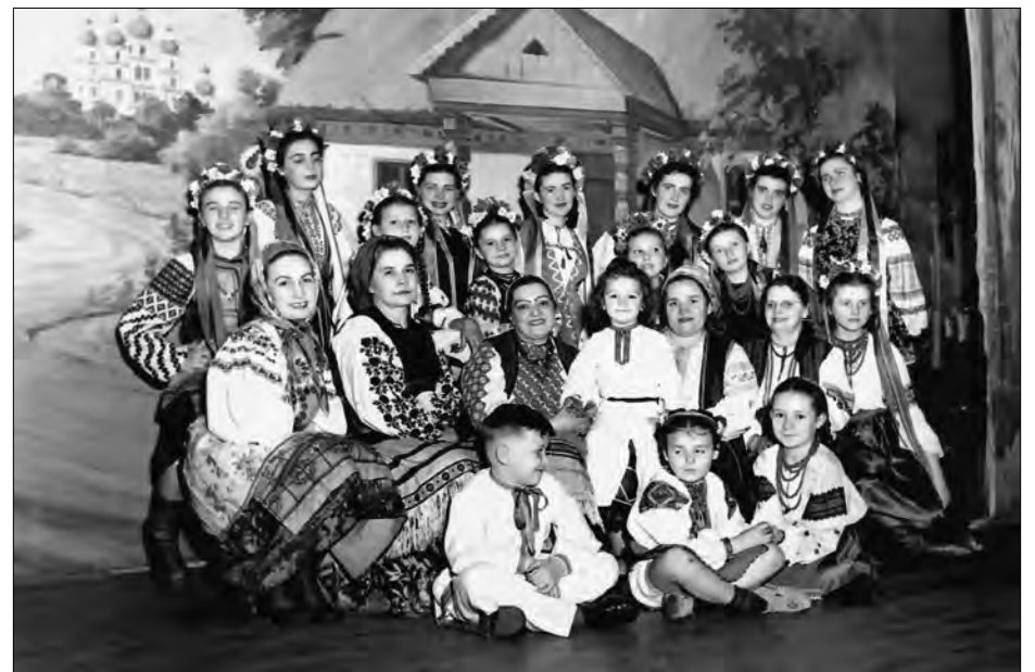
Українська молодь на сцені Українського народного дому. 1951 рік