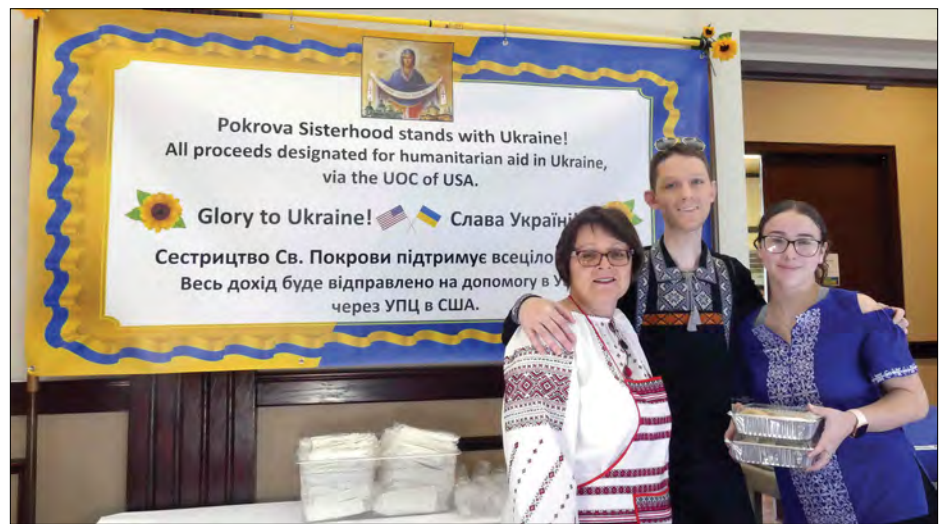
Сестрицтво Покрови Божої Матері серед організаторів ярмарку.