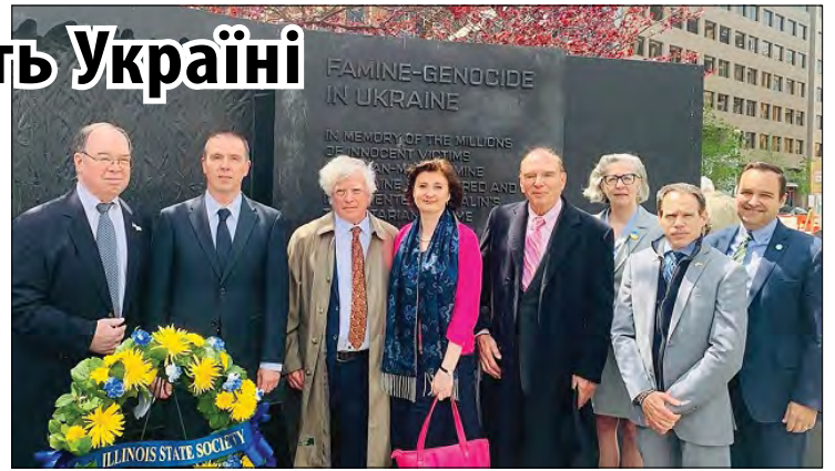
Церемонія біля Меморіалу жертвам Голодомору-геноциду

У церемонії також взяли участь співголова Конгресового українського кокусу – групи дружби з Україною у Палаті представників Конгресу США, конгресмен Майк Квіглі, Посол Ендрю Бремберг, президент і виконавчий директор Фондації жертв комунізму, письменник та журналіст Девід Саттер, директор Української інформаційної служби у США Михайло Савків та архітектор пам'ятника