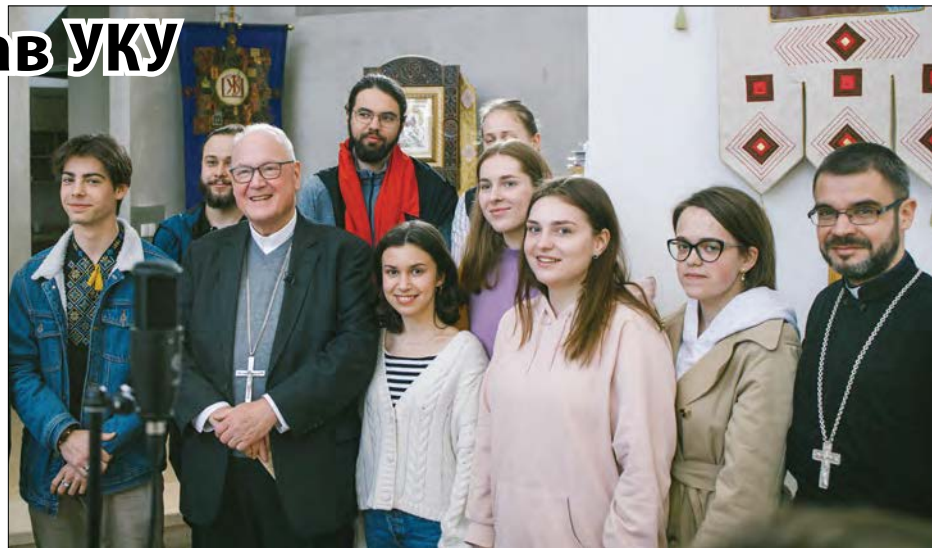
Кардинал Тімоті Долан зі студентським хором „Стрітіння“ та керівником деканату душпастирського життя о. Назаром Мисяковським.

Ділячись враженнями про свою візиту до УКУ, кардинал Т. Долан зазначив: „Я бачу українців, які приймають переселенців. Я бачу українців, які віддають свої кімнати і будинки для тих, котрі втратили власні домівки, як-от тут, в Українському католицькому університеті. Я бачу