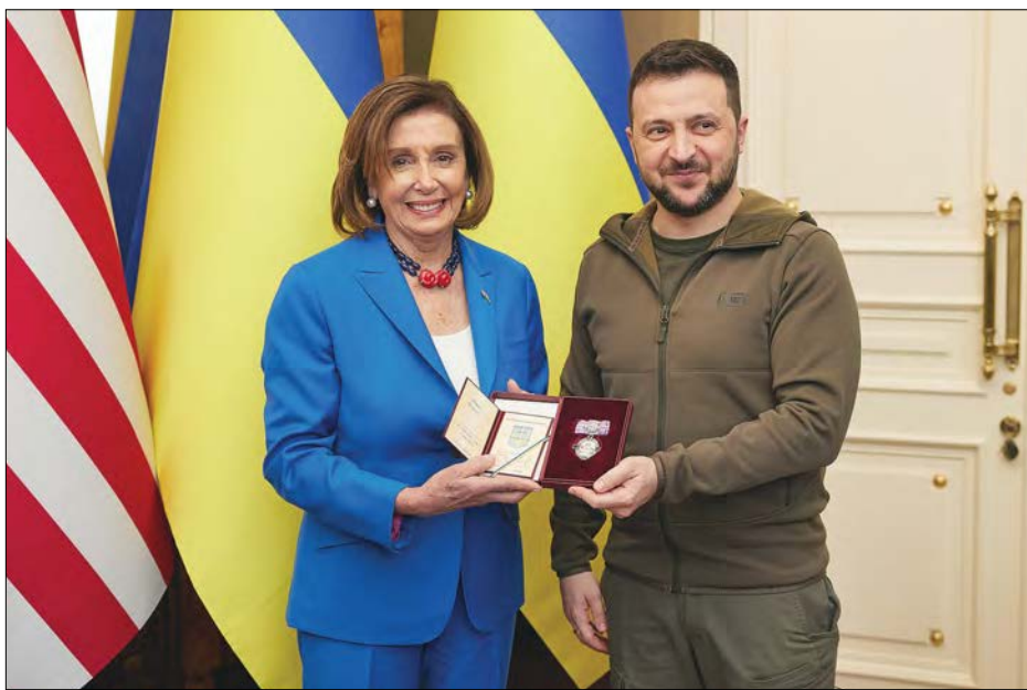
Президент Володимир Зеленський вручив Ненсі Пелосі орден княгині Ольги.

КИЇВ. – 1 травня Президент України Володимир Зеленський провів зустріч зі спікером Палати представників Конгресу США Ненсі Пелосі, яка прибула до України з візитом. Президент подякував Н. Пелосі за візиту: „Я вдячний вам за цей сигнал потужної підтримки з боку Сполучених Штатів Америки, народу, Конгресу. Це свідчить про те, що США сьогодні є лідером потужної підтримки України в часи війни проти агресії Російської Федерації“.