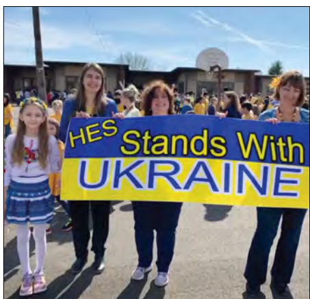
Акція підтримки України в школі Гилсборо.