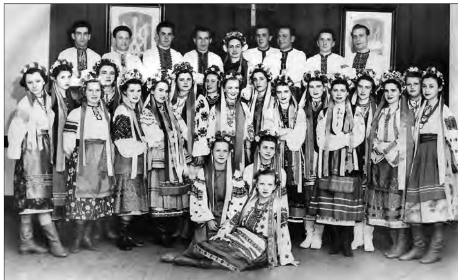
Танцювальна група Українського народного дому. 1953 рік