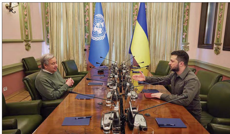
Президент України Володимир Зеленський і Генеральний секретар ООН Антонію Гутерріш.

Президент України та Генеральний секретар ООН також обговорили підтримку українців шляхом готівкових виплат, збільшення обсягів гуманітарної допомоги Україні, а залучення ООН до післявоєнної відбудови України. В. Зеленський і А. Гутерріш