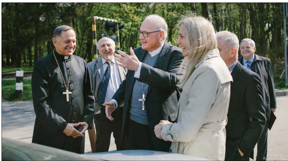
Кардинал Тімоті Долан відвідав Український католицький університет.

українців, які волонтерять і працюють над постачанням води, ліків, їжі. Я бачу людей, які є патріотами. Я бачу українців, які не дозволяють злу сказати останнє слово. Життя переможе темряву. Життя переможе смерть. В Україні немає депресії, тут є надія. Я почувся підбадьореним, будучи тут, в Україні. Куди б я не пішов, українці говорять мені: „Подякуйте американцям: за їхню любов та підтримку“. Я обов'язково передам їм це повідомлення і перека-