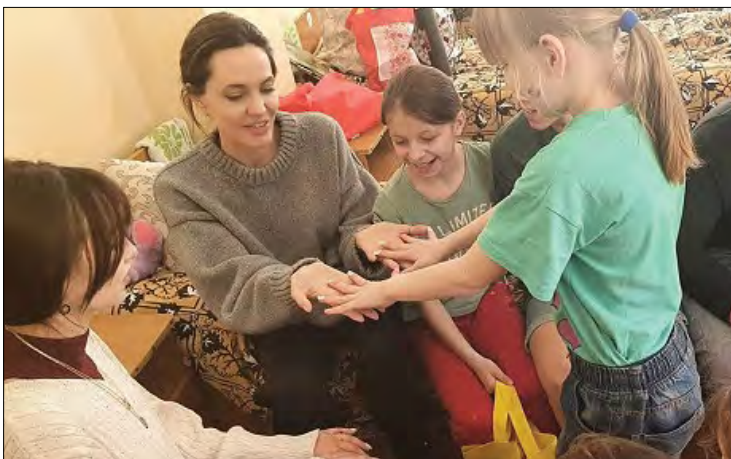
Анджеліна Джолі з подарунками серед евакуйованих дітей у Бориславі.

ЛЬВІВ. – Голлівудська зірка Анджеліна Джолі 1 травня завітала в місто Борислав до дітей з подарунками, спілкувалася з дітьми з Луганщини. 30 квітня А. Джолі відвідала у Львові медичний заклад, де лікуються постраждалі від ракетного удару по Краматорську діти. У Львові вона завітала до вокзальних волонтерів, психологів та лікарів, подякувала їм усім та залізничникам, поспілкувалася з пасажирами евакуаційного поїзда з Покровська. Акторка відвідала дітей-сиріт та дітей позбавлених батьківського піклування, яких евакуювали з „гарячих“ регіонів України у львівські інтернати.