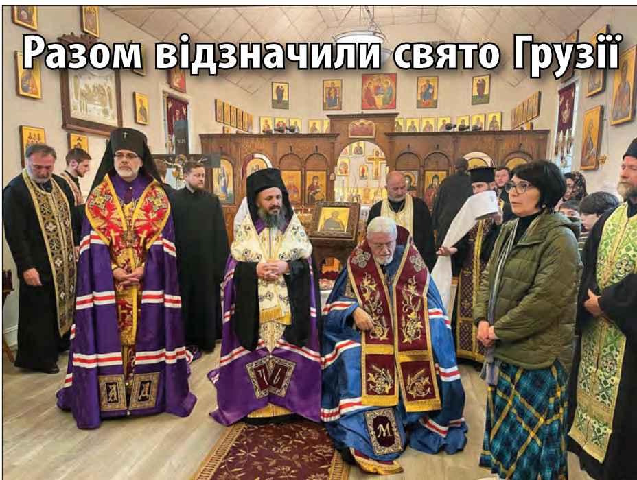
МЕНВІЛ, Нью-Джерзі. – 9 квітня Митрополит Антоній, Архієпископ Даниїл, духовенство і вірні Української православної церкви США разом з Єпископом Північно-американської грузинської апостольської православної церкви Савою Інцкірвели та 20 священниками взяли участь у молитовному відзначенні Дня народної єдності Грузії.