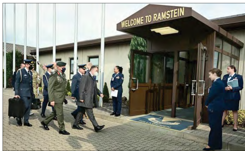
Учасники зустрічі у Рамштайні прибули на авіобазу.

РАМШТАЙН, Німеччина. – 26 квітня зібралися голови та представники оборонних відомств понад 40 країн і обговорили, як координувати дії для надання військової допомоги Україні на безпосередні оборонні потреби та в майбутньому. Зустріч започаткувала роботу контактної групи, до якої увійдуть представники не лише країн-членів НАТО, а й низки інших держав, які приєдналися. Контактна група координуватиме зусилля країн-партнерів на щомісячних зустрічах.