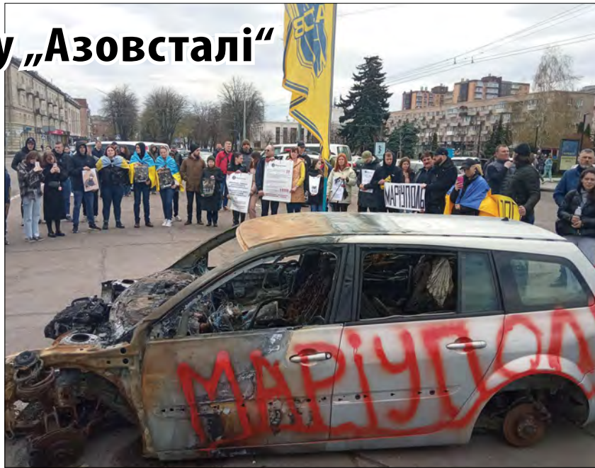
Автівка з-під Маріуполя.