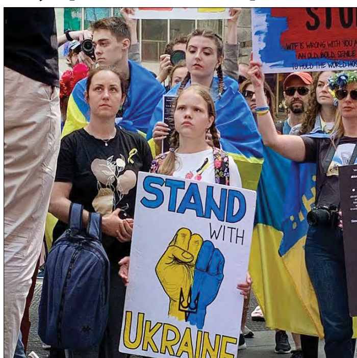
Учасники маніфестації в Нью-Йорку.

НЮ-ЙОРК. – Українці провели на Таймс-сквер маніфестацію проти спроб Росії у війні з Україною спричинити глобальний голод шляхом блокування окупантами експорту українського врожаю зернових, що відіграє ключову роль на світовому продовольчому ринку. Про це повідомило Генеральне консульство України у Нью-Йорку.