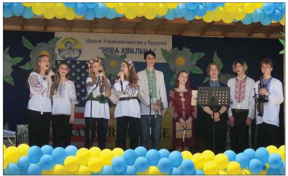
Випускники виконують пісню „Школа“.

Учасники та гості фестивалю мали нагоду оглянути виставку картин художника Андрія Усика, батька двох