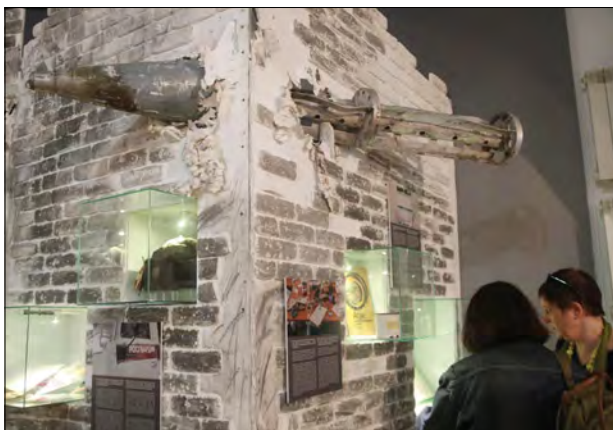
Один з експонатів виставки.

Тут справді є на що подивитися й над чим подумати. Ось, наприклад, атлас автомобільних доріг, виданий в далекому 1975 році ще в СРСР(!) – на нього рашисти поклалися при спробі заїхати в Київ. А ось маленький щоденник ліквідованого росіянина, з якого випливає: рашист знав, що їде не на навчання, а в Україну – вбивати! Далі – покручені снаряди, посічені кулями дорожні знаки. Записи рідним, залишені в покинутих будинках. Пропагандистські газети й символіка. Написи „Тут живуть люди“, відтворені на імпровізованій