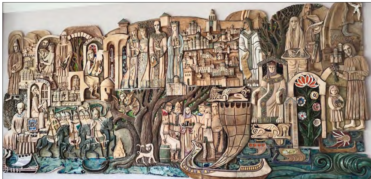
Галина Севрук. „Місто на семи горбах“