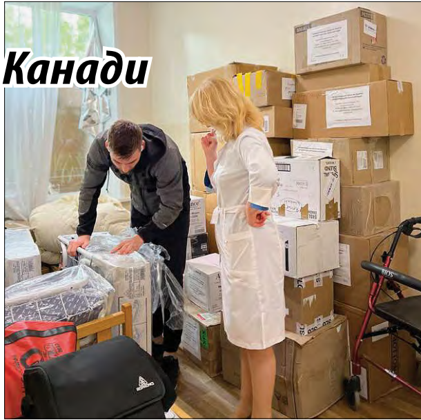
Привезли допомогу з Канади.

У Кропивницькому лікарні передали інвалідні візки, ходунки, лікарняні ліжка, засоби для анестезії, знеболюючі, інсулін, хірургічні інструменти, засоби гігієни.