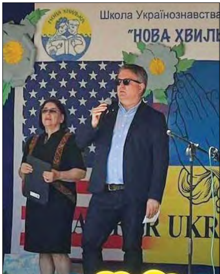
Посол Сергій Кислиця вітає школу, учасників конкурсу та українську громаду Брукліна.

Усі випускники залишаються активними у громаді й продовжують співпрацю у різних проектах школи, а також як виховники в Пласті та СУМ. На закінчення урочистої части-