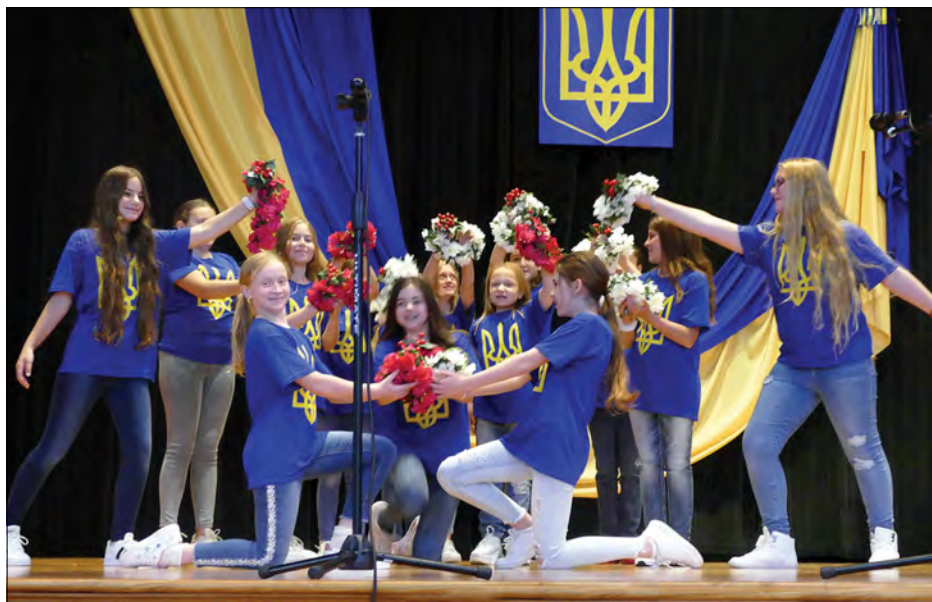
Концертна програма шкільного свята.

На завершення свята всі заспівали Гимн України.