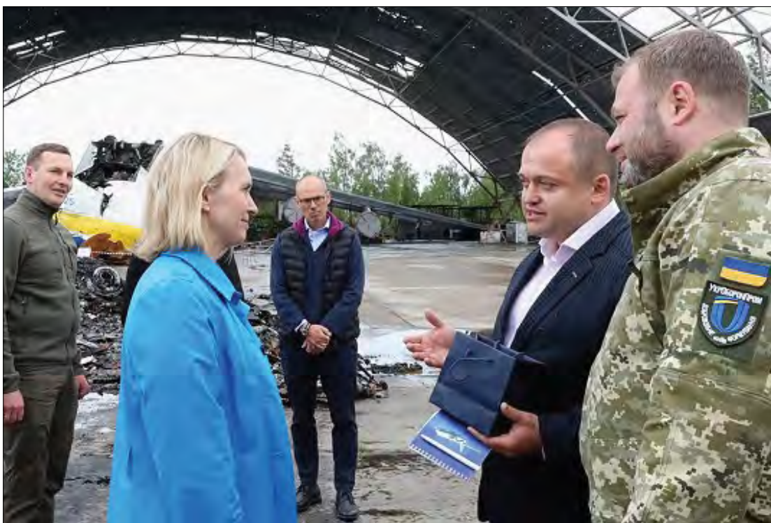
Посол США в Україні Бріджит Брінк у Гостомелі.

КИЇВ. – 31 травня Посол США в Україні Бріджит Брінк відвідала летовище у Гостомелі під час першої поїздки за межі Києва. „Під час моєї першої поїздки за межі Києва я відвідала аеродром Гостомель, де билися українські воїни і перемогли в одній із перших важливих битв у війні. Мої думки – разом з Донбасом, де зараз відбувається вирішальна битва“, – зазначила Б. Брінк.