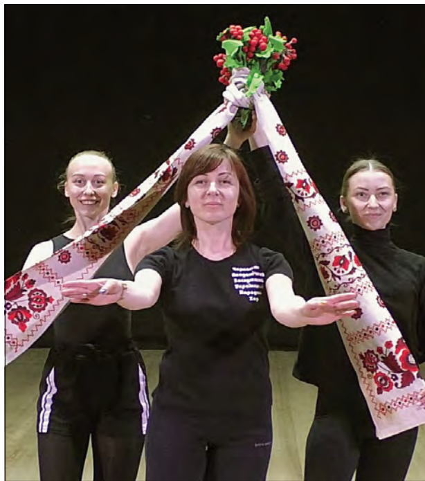
Балетна група Черкаської філармонії перед поїздом на фестиваль до Італії.