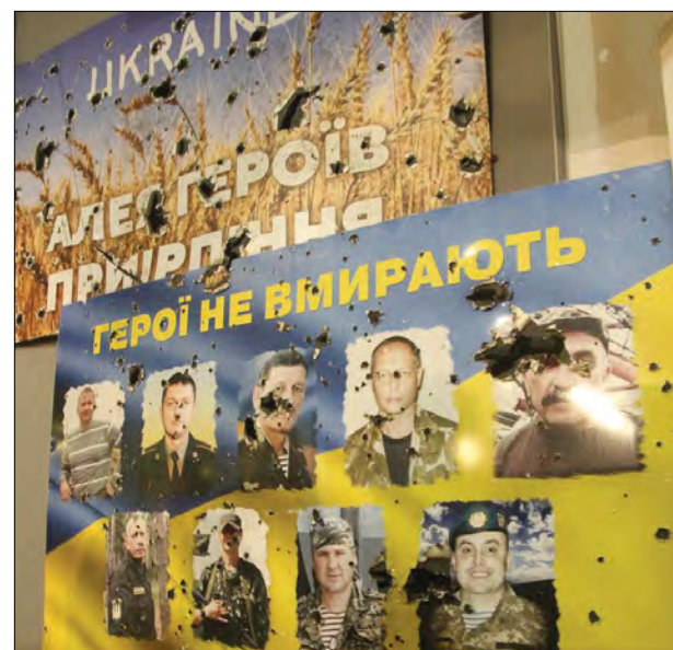
На виставці „Навала. Київський постріл“.

стіні – такі меседжі часто можна бачити на будинках там, де точилися бої. Російські сухпаї, протигаз, рештки форми – все, що слугувало засобами для підкорення Києва, тепер стало експонатами в одному з його провідних музеїв.