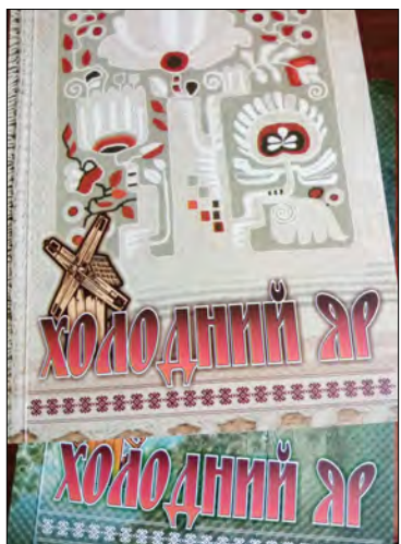
Альманах „Холодний Яр“

Створюється часопис у співпраці з обласною організацією Національної спілки художників України, тому в ньому вміщують репродукції картин черкаських художників. Одне із представлених чисел присвячене пам'яті поета, прозаїка і художника Ігоря Забудського, який торік залишив цей світ. В іншому йдеться про відому черкаську майстриню народного мистецтва, заслужену художницю України, членкиню Комітету з Національної премії України ім. Тараса Шевченка