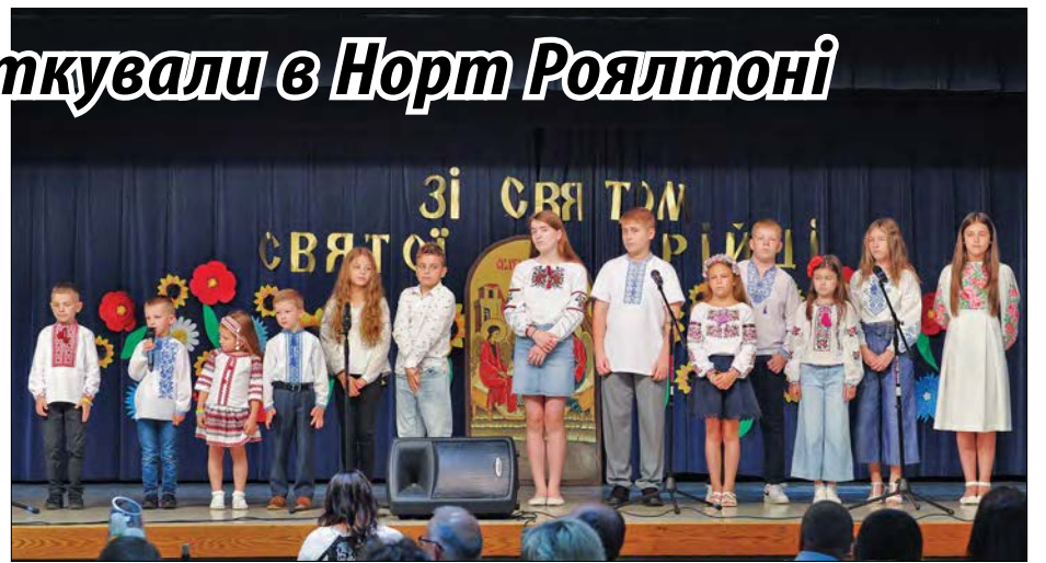
На сцені парафіяльний дитячий хор.