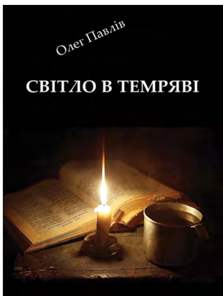
Товариство „Опір Західної України“

Книга вийшла коштом Товариства „Опір Західної України“ (Чеська Республіка) у видавництві „Лілія“ (Україна) за підтримки видавництва „Беларус“ (США) і корекції білоруських віршів Крисціною Курчанковою (США).