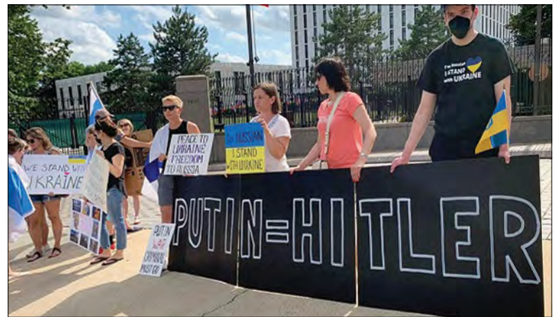
Акція перед Посольством Росії у Вашингтоні (Фото: Ярослав Довгопол, Укрінформ)

Солідарність із росіянами, які підтримують демократію, висловив Державний департамент США, привітавши їх з національним святом. У заяві з цього приводу Держдеп підкреслив, що громадяни Росії, як і люди в усьому світі, заслуговують на можливість жити без репресій та реалізувати