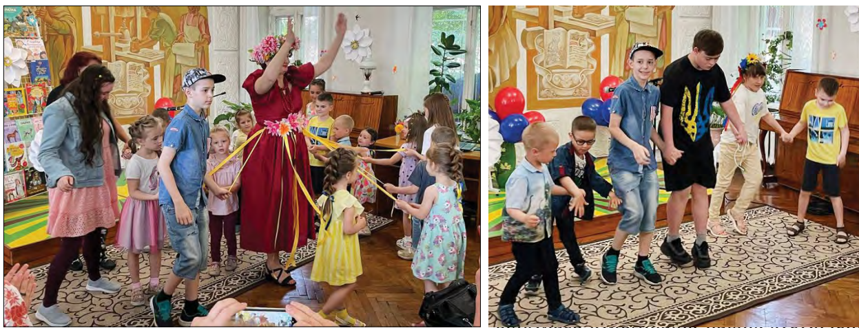
На святі в обласній бібліотеці для юнацтва ім. Василя Симоненка.