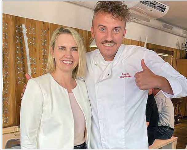
Посол США Бріджит Брінк під час зустрічі з Євгеном Клопотенком.

ЗАХІДНИЙ БЕРЕГ. – 51-літня журналістка Ширін Абу Аклек, яка працювала для арабської радіоагенції новин „Аль Джазіра“, загинула 11 травня під час стрілянини на Західному березі Йордану. Вона стояла разом з іншими журналістами біля входу до табору палестинських біженців. Її колеги кажуть, що вони стояли групою виразно перед ізраїльським військовим конвоем. Вони були в шоломах і синіх бронжилетах з написом „Преса“. Очевидці розповіли телеагенції „CNN“, що ізраїльські військові навмисне відкрили вогонь по журналістах. 19 травня у попередньому розслідуванні військові сказали, що не було ясно, хто спричинив смерть Ш. Аклек, яка мала подвійне палестинське й американське громадянство. Головний адвокат ізраїльського війська сказав 23 травня, що кримінальне розслідування не є автоматичним у зоні бойових дій. ООН, законодавці США й міжнародна спільнота закликають до незалежного розслідування. 24 травня „CNN“ оприлюднила два відео, які – разом з розповідями вісьмох очевидців та свідченнями судових аналітиків і експертів – вказують, що ізраїльські військові навмисне взяли журналістів на приціл. Одне 16-хвилинне відео показує, що ніде не було озброєних палестинців і не було жодних провокацій. Один журналіст був поранений. Ш. Аклек, яка працювала для „Аль Джазіра“ 25 років, часто висвітлювала життя палестинців у таборах біженців. („CNN“)