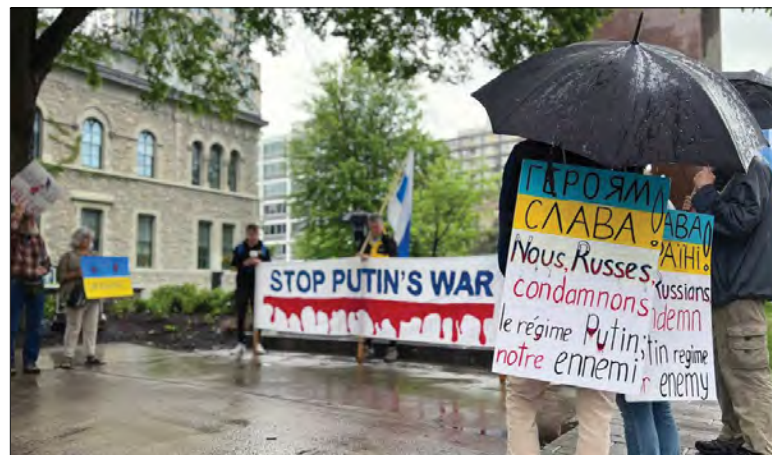
Акція у Оттаві.

„Я навіть приніс сюди свій російський паспорт, аби його привселюдно спалити й кинути під оці погані двері, але мені сказали, що поліція не схвалюватиме такі дії з міркувань пожежної безпеки“, – сказав москвич Олег.