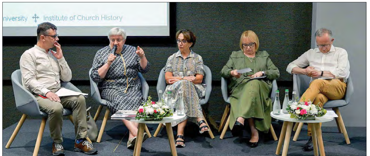
Учасники конференції в Українському католицькому університеті.

В Українському католицькому університеті (УКУ) 14 липня відбулась міжнародна конференція „Ватиканська Ostpolitik: історичні передумови та актуальні виклики“ („The Vatican's Ostpolitik: Historical Background and Contemporary Challenges“). У дискусії взяли участь колишні послы при Ватикані від Литви, Грузії, Європейського союзу та України.