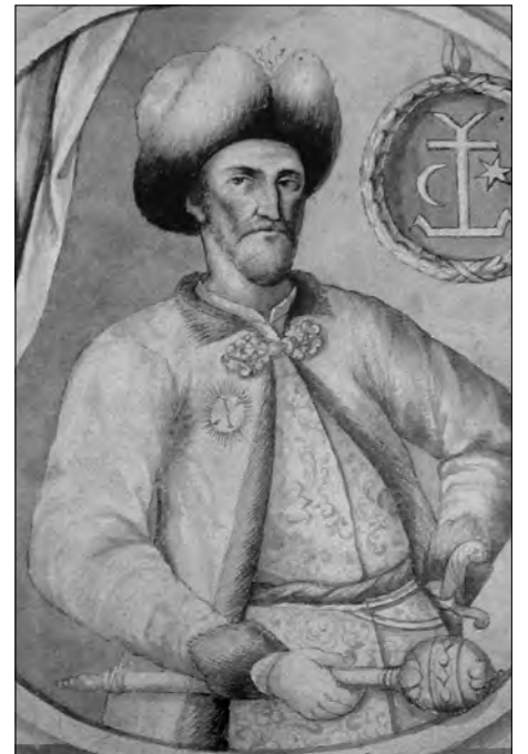
Гетьман Іван Мазепа. Автор: Самійло Величко, XVIII ст.

Мазепа був єдиним українським гетьманом, який незмінно тримав гетьманську булаву протягом 21 року. Перед Мазепою як господарником, адміністратором, дипломатом також варто схилити голову. Адже саме завдяки „рутинній“ діяльності Мазепи в Україні – Гетьманщині сформувалося ядро модерної української нації, постала козацька еліта,