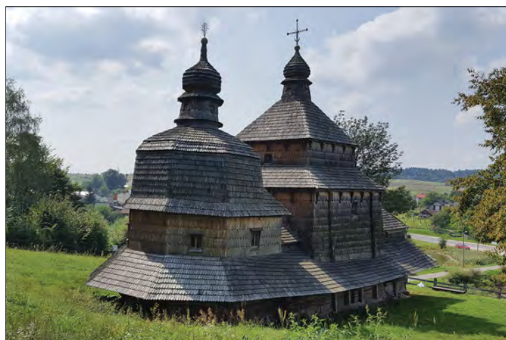
Найстаріша дерев'яна церква Святого Духа у селі Потелич, споруджена 1502 року. Видатна пам'ятка архітектури та монументального мистецтва галицької школи, 21 червня 2013 року включена у список світової спадщини.

Вогнегасники водяного туману підходять для порятунку внутрішнього оздоблення дерев'яних церков, оскільки вони розпилюють воду під тиском у дрібний туман, який випаровується, зводячи до мінімуму можливі пошкодження крихких поверхонь розписів, автентичних тканин,