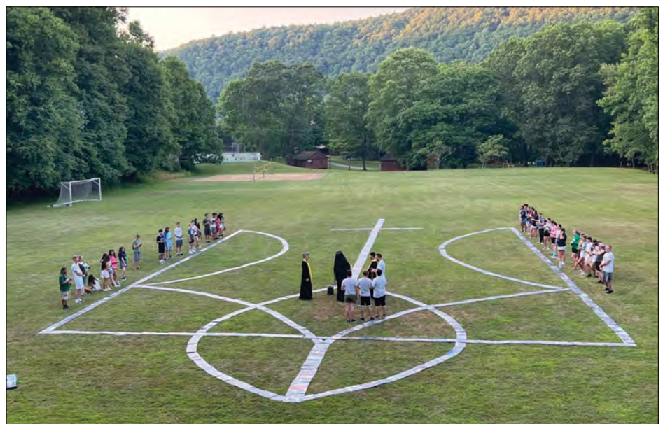
Молитовний Тризуб, викладений із 550 світлин війни в Україні, став об'єктом духовного моління та роздумів на Оселі всіх святих.