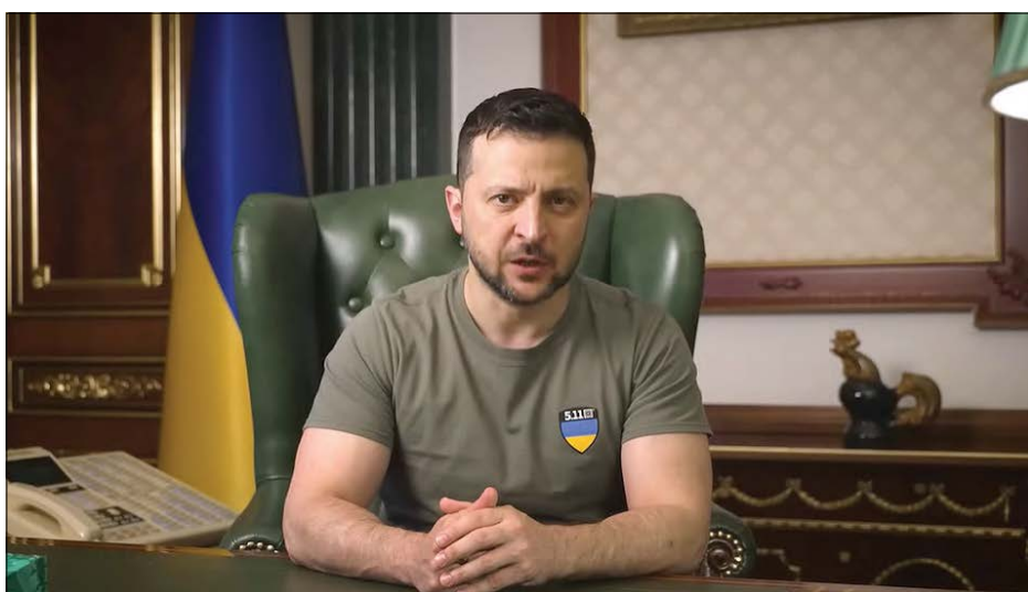
Президент України Володимир Зеленський.

Звернення Президента України 17 липня 2022 року