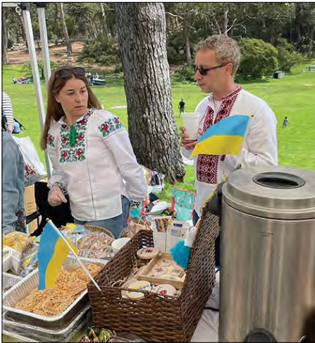
Щедрому спілкуванню гостей фестивалю сприяли вміло підготовлені господинями найрізноманітніші смаколики.