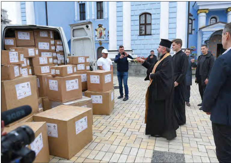
Митрополит Київський і всієї України Епіфаній освячує гуманітарну допомогу.

Волонтери благодійного фонду „Можемо разом“ допоможуть доставити медикаменти до 118 лікарень України. Першу частину допомоги одразу доправили до Головного військового клінічного госпіталю та Київського міського клінічного госпіталю ветеранів війни. (УНІАН)