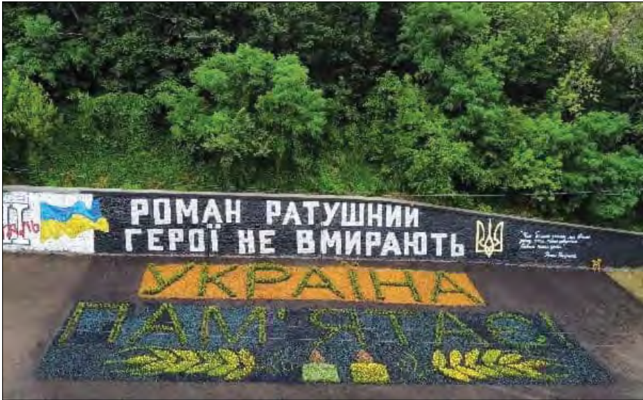
Місце пам'яті Романа Ратушного.