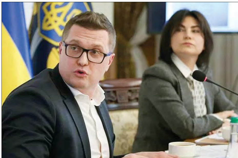
Іван Баканов та Ірина Венедіктова.

КИЇВ. – 19 липня Верховна Рада проголосувала за припинення повноважень Ірини Венедіктової на посаді Генерального прокурора України. Про це повідомив народний депутат Давид Арахамія.