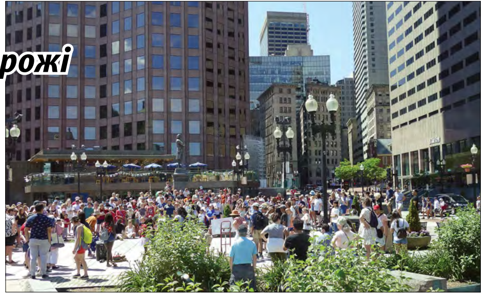
Свято у Бостоні.