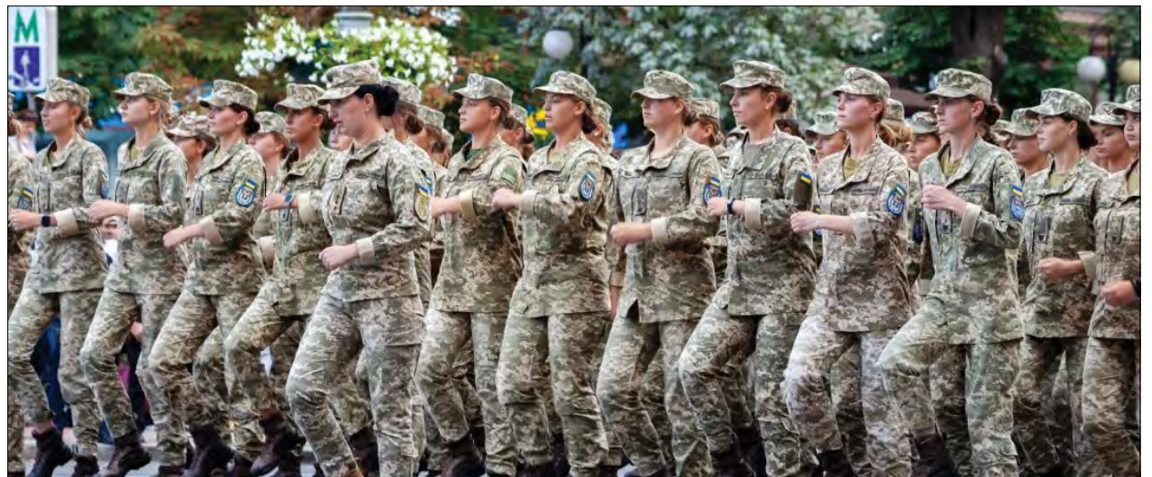
Жіночий підрозділ Збройних сил України.

КИЇВ. – Українських захисниць плянують забезпечити уніфікованою жіночою формою. Волонтери двох ініціативних груп цього тижня передадуть на безоплатній основі першу партію жіночої військової форми для тестування. Ідея виробництва жіночої військової форми з'явилася після численних запитів від захисниць, які зараз воюють на передовій. Чоловічі розміри й фасони одягу не відповідають жіночим. Жінкам доводиться перешивати форму або пристосовувати її