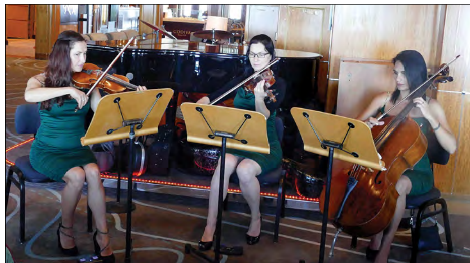
Українське скрипкове тріо „Бревіс“.

від 1929 року проводять в центрі Бостона 4 липня, через пандемію не відбувалося останні два роки. У ньому тепер брали участь 10-разова володарка нагороди Греммі“ Чака Хан, володар нагороди „Voice“ Хав'єр Колон та інші музичні виконавці.