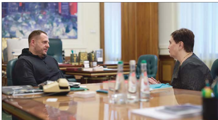
Керівник Офісу Президента України Андрій Єрмак провів зустріч з виконавчим директором Світового конгресу українців (СКУ) Сонею Соутус.

Також, на думку керівника Офісу Президента, війна Росії проти України, яка стала трагедією для України,