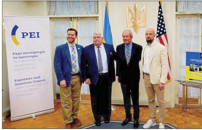
Учасники презентації проєкту Українського конгресового комітету Америки „Fighting Chance Ukraine“.

НЬЮ-ЙОРК. – Генеральному консульству України в Нью-Йорку відбулася презентація для місцевої преси нового проєкту Українського конгресового комітету Америки (УККА) „Fighting Chance Ukraine“. Проєкт покликаний активізувати надання американськими неурядовими організаціями нелетальної військової допомоги Збройним силам України, зокрема окремому роду сил ЗСУ – Силам територіальної оборони. Презентація проведена за участю одного з лідерів проєкту, колишнього заступника Секретаря військово-морських сил США Джеррі Галтіна, а також представників Міністерства оборони України, Генконсульства й УККА. (Укрінформ)