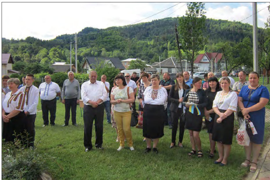
Батьки школярів і гості села.

Вони любитимуть свою Україну, як любили її їхні предки, і нікому не віддадуть на поталу ні її, ні свій прекрасний край.