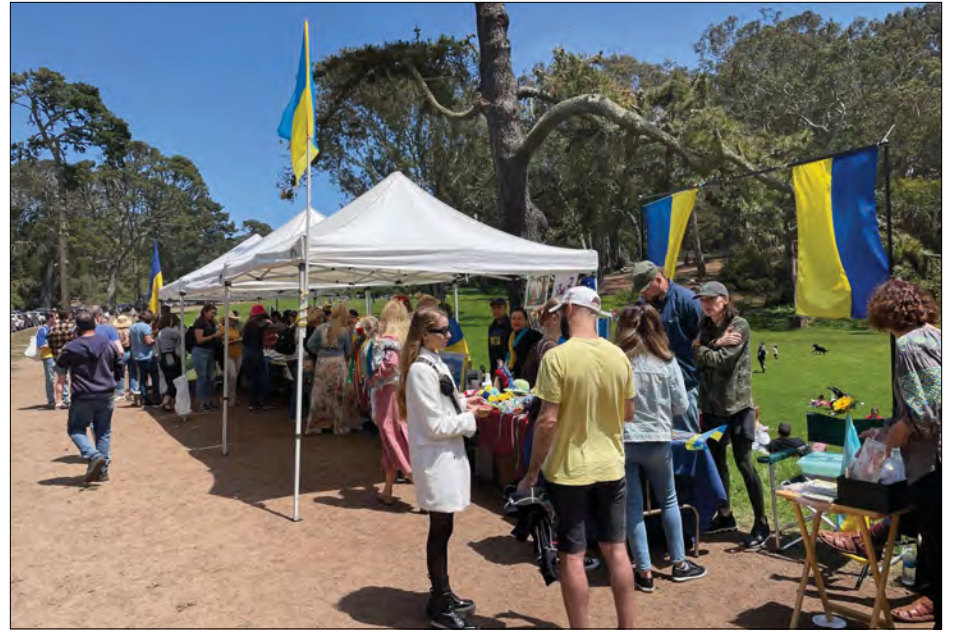
Свято в парку „Золоті Ворота“.

українській традиції віншувати всіх добрих людей, зичити їм миру, достатку і Божої благодаті. І це вдалося. Учасники зустрічі, хоч нині в нас і не Різдвяно-Новорічний цикл свят, а Івано-Купальський та Петрівський, продемонстрували, що вони пам'ятають, якого вони роду-племені, звідки пішла і постала Земля Руська – Україна. „Колядування“ у тісному родинному колі пройшло вдало. Щедрому спілкуванню кількох сотень родин сприяли вміло підготовлені господинями Оленою