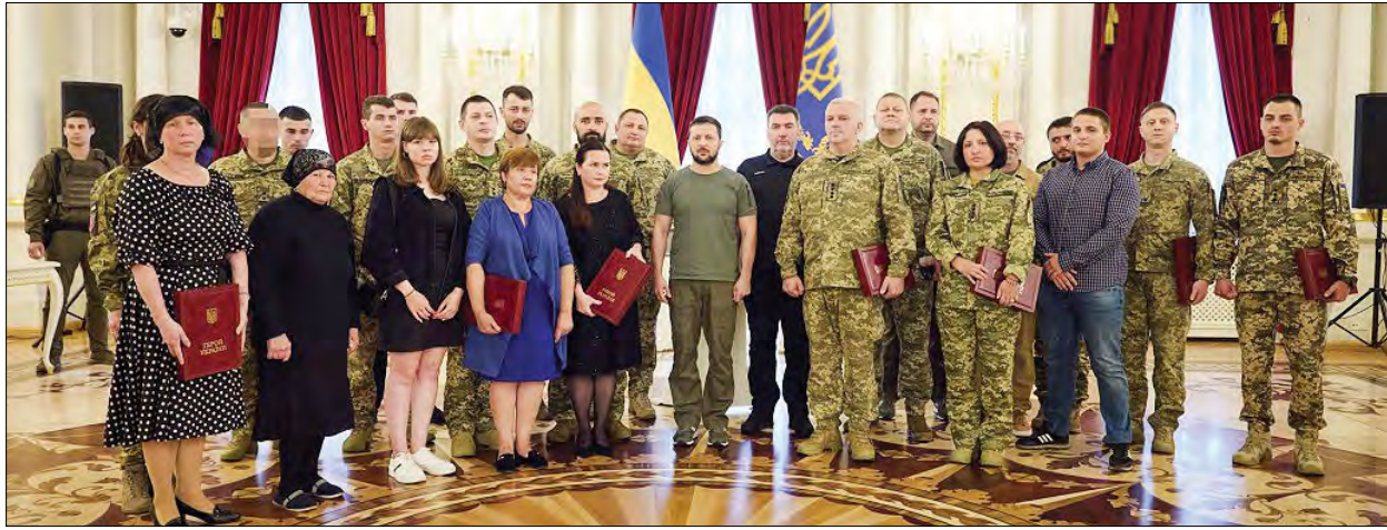
Церемонія нагородження в Маріїнському палаці Києва.

КИЇВ. – 14 липня Президент України Володимир Зеленський вручив ордени „Золота Зірка“ військовослужбовцям, яким присвоєно звання Героя України, та членам родин загиблих захисників, удостоєних цього звання посмертно.