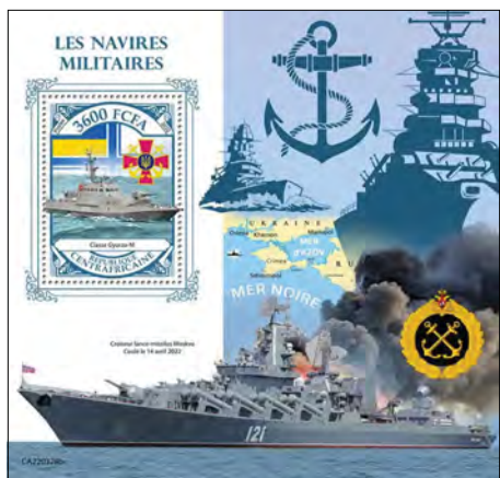
Пошта Центральної африканської республіки

200 тис. марок на підтримку України випустила пошта Австрії. Ці марки з гаслом „Разом заради миру“ продаються по 3 євро, з яких 2 євро будуть направлені організаціям „Сусіди в біді“ та ЮНІСЕФ.