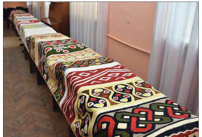
„Рушник єдності“ у бібліотеці.

Рушник подорожує країною і почергово розміщується в мережі спеціалізованих бібліотек для дітей. Естафета подорожі рушника почалася в Національній бібліотеці України для дітей в Києві.