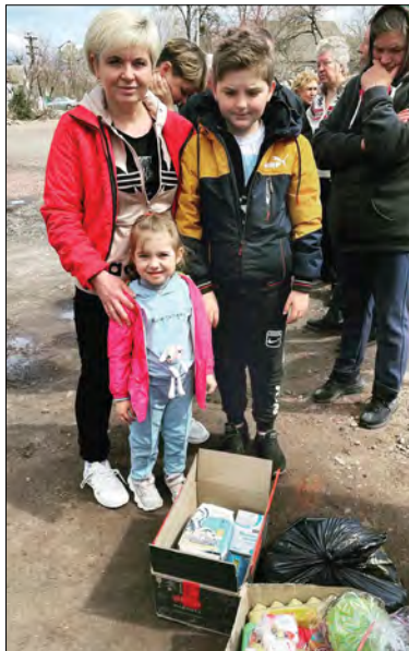
„Карії оченята“ приїхали у Новий Биків, Чернігівської області