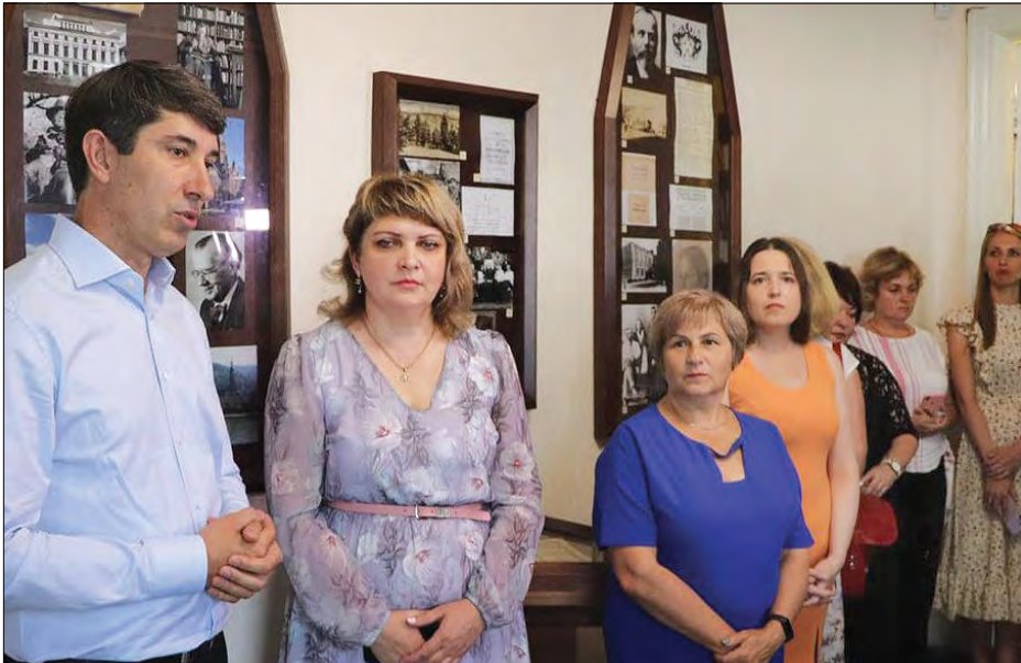
Відкриття музею Дмитра Чижевського.