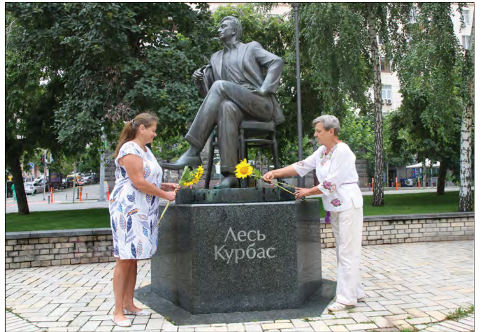
Активісти „Соловецького братства“ покладають квіти до пам'ятника геніальному українському театральному режисерові Лесю Курбасу, розстріляному разом з сотнями інших видатних українських мистців і державників в урочищі „Сандармох“ у 1937 році.