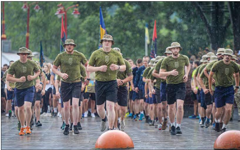
Марафон на підтримку захисників Маріюполя.

Організатори зазначають, що подібні акції вже проходили в Запоріжжі, Чернігові, Дніпрі, Рівному,