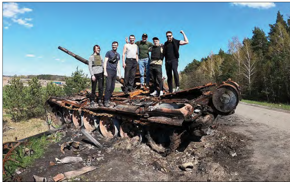
Воїни дякують з фронту.

Ми з вами робимо гарну справу! Ми переможемо!“