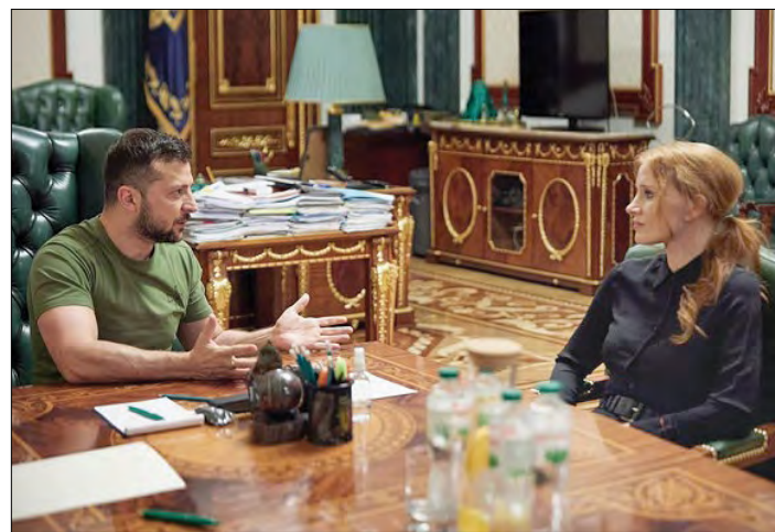
Президент Володимир Зеленський і Джесіка Честейн.

КИЇВ. – 7 серпня Президент Володимир Зеленський зустрівся з американською акторкою Джесікою Честейн. „Джесіка Честейн сьогодні в Україні. Для нас такі візити відомих людей – надзвичайно цінні. Завдяки цьому світ іще більше чутиме, знатиме та розумітиме правду про те, що відбувається в нашій країні“, – зауважив Президент. Американська акторка та продюсерка Джесіка Честейн прибула до Києва та відвідала дитячу лікарню „Охматдит“. Керівник Офісу Президента Андрій Єрмак теж подякував американській акторці Джесіці Честейн за те, що погодилася приїхати в Київ, адже дуже важливо, що всесвітньо відомі люди підтримують Україну у боротьбі за свободу.