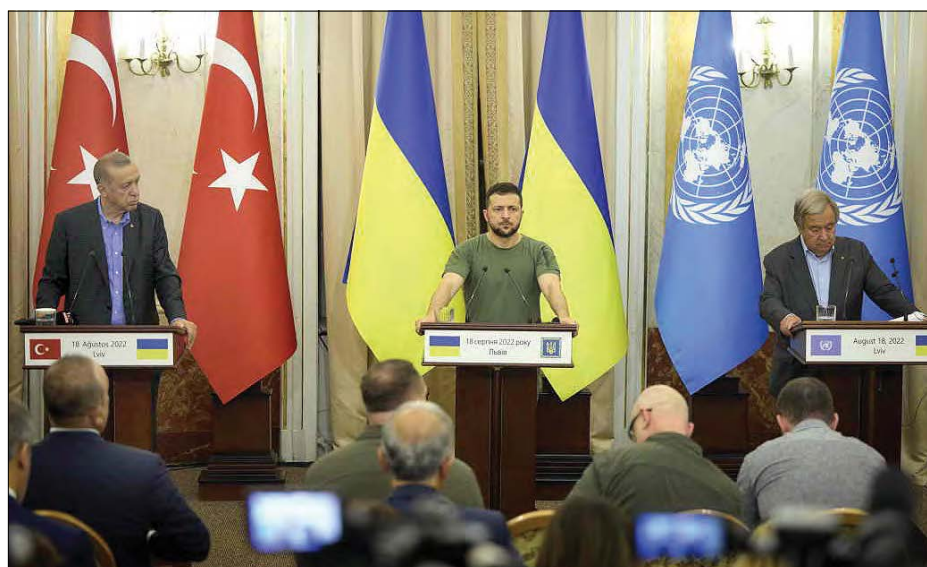
Учасники зустрічі у Львові (зліва): Президент Турецької Республіки Реджеп Таїп Ердоган, Президент України Володимир Зеленський, Генеральний секретар ООН Антоніу Гутерріш.

ЛьВІВ. – Президент України Володимир Зеленський, Президент Турецької Республіки Реджеп Таїп Ердоган та Генеральний секретар ООН Антоніу Гутерріш 18 серпня провели тристоронню зустріч у Львові.