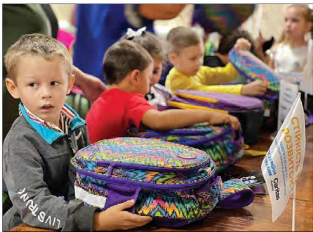
Учні отримали шкільні ранці.

КИЇВ. – Напередодні нового навчального року українців закликають допомогти зібрати до школи учнів з багатодітних родин, переселенців, а також тих, чий родич загинув на війні. Традиційну акцію „Шкільний портфель“ проводить міжнародний благодійний фонд „Карітас України“. „За понад 20 років нам вдалося забезпечити десятки тисяч українських школярів допомогою до школи. Ми впевнені, що матеріальний стан родини не може стати на заваді дитині отримувати якісні знання“, – кажуть у фонді.