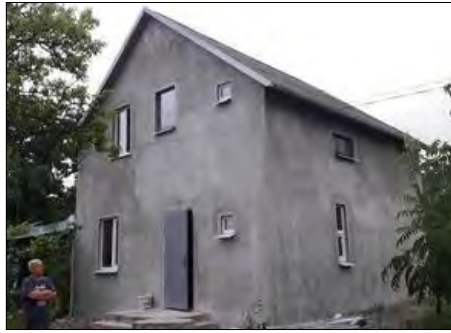
Майбутній будинок для біженців