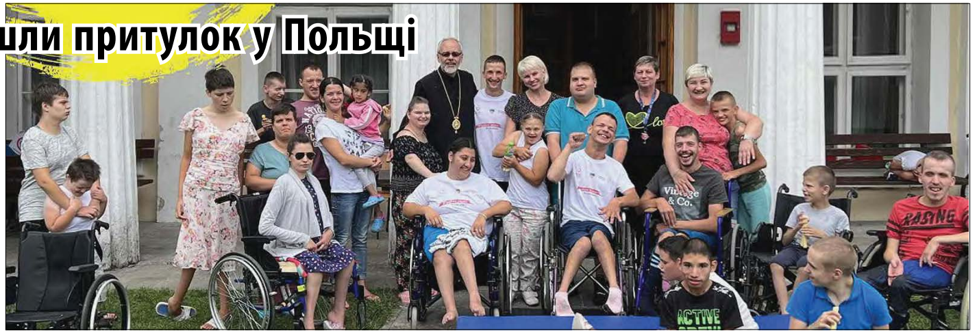
Архiepіскоп Даниїл з дітьми.

Відгомін сміху цього року змінився відлунням сирен, оскільки Російська Федерація вторглася в суверенну державу Україну. Більше діти не про-