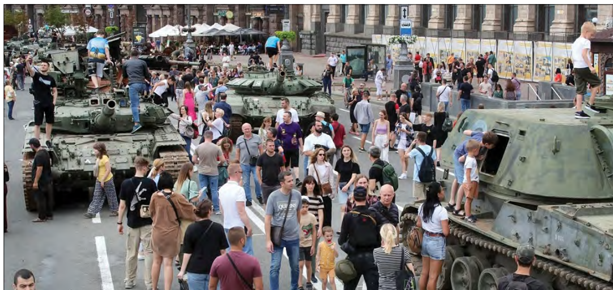
На виставці трофейної техніки в Києві.