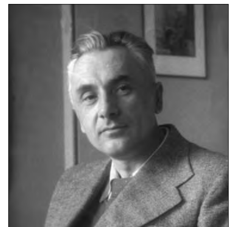
Юрій Яновський. Київ, 1946.

Доли деяких людей нагадують спалахи зірок: вони загораються на тлі нічного неба і так само швидко гаснуть, залишаючись в пам'яті небайдужих романтиків. Юрій Яновський народився 120 років тому, 27 серпня 1902 року, на хуторі Маєрове Єлизаветградського повіту (на Херсонщині) в багатодітній селянській родині. В 1917-му батьки переїхали до Єлизаветграда, де Юрко (в 1919 році) закінчив реальне училище. Деякий час працював у радянських установах міста, а в 1922-1924 роках навчався в Київському політехнічному інституті. Хоча інститут і не закінчив, але зацікавився літературною діяльністю і театром. Перший вірш