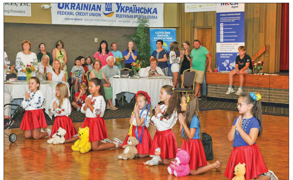
Молитва дітей з Української академії.