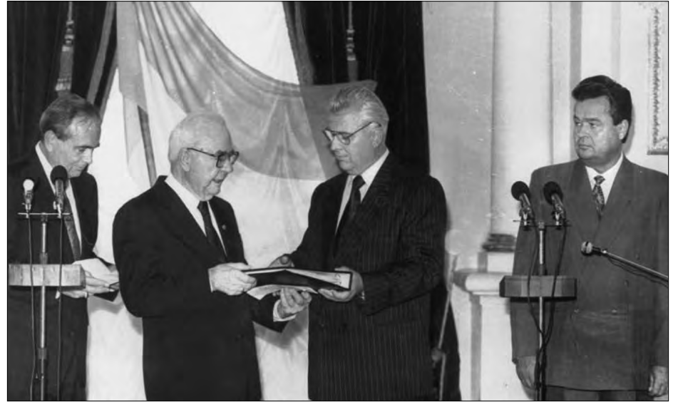
Урочисте передання останнім президентом УНР в екзилі М. Плав'юком клейнодів УНР та грамот про правонаступництво Президентіві Україні Леонідові Кравчуку (Фото з фондової колекції Національного музею історії України).