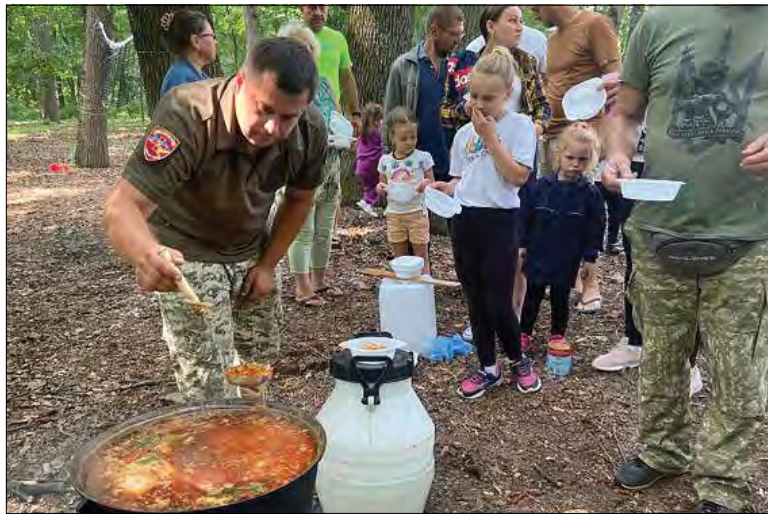
Борщ приготували військові.

Бійці добровольчого формування територіальної оборони „Чорний ворон“ продемонстрували свої навички, чим викликали захоплення, особливо хлопчаків. Під час свята можна було пограти у дартс, спробувати пересуватись на ходулях, про-