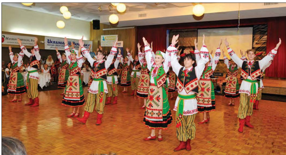
Хореографічний ансамбль "Вишиванка" з Чикаго.

парафіяльної управи, від парафіян сердечно дякував й закликав Боже благословіння для кожного, хто в той чи інший спосіб доклав зусиль, аби триденний Український фестиваль відбувся на високому рівні.