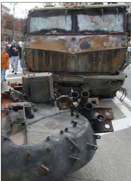
На виставці трофейної техніки в Києві.