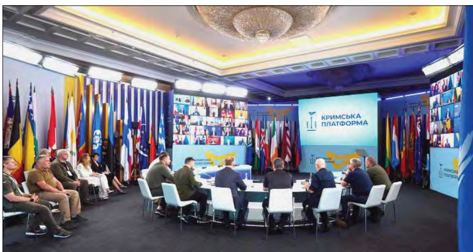
Під час Другого саміту Кримської платформи в Києві.

КИЇВ. – Другий саміт Міжнародної Кримської платформи відбувся 23 серпня в Києві. Його відкрив Президент Володимир Зеленський, який звернувся до учасників саміту.